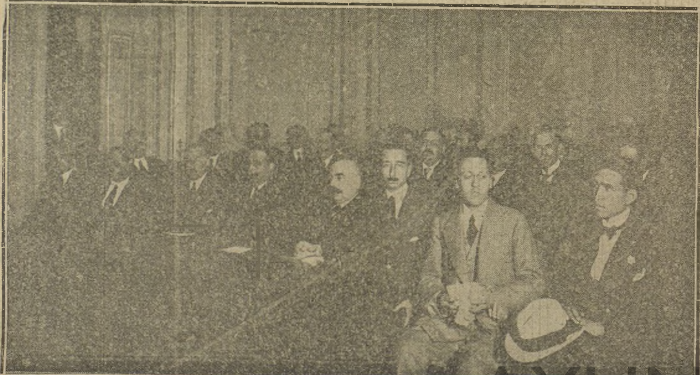
Presidencia del mitin maurista celebrado recientemente en la Sala Imperio, de Barcelona.

La Banda municipal tocó durante los intermedios.