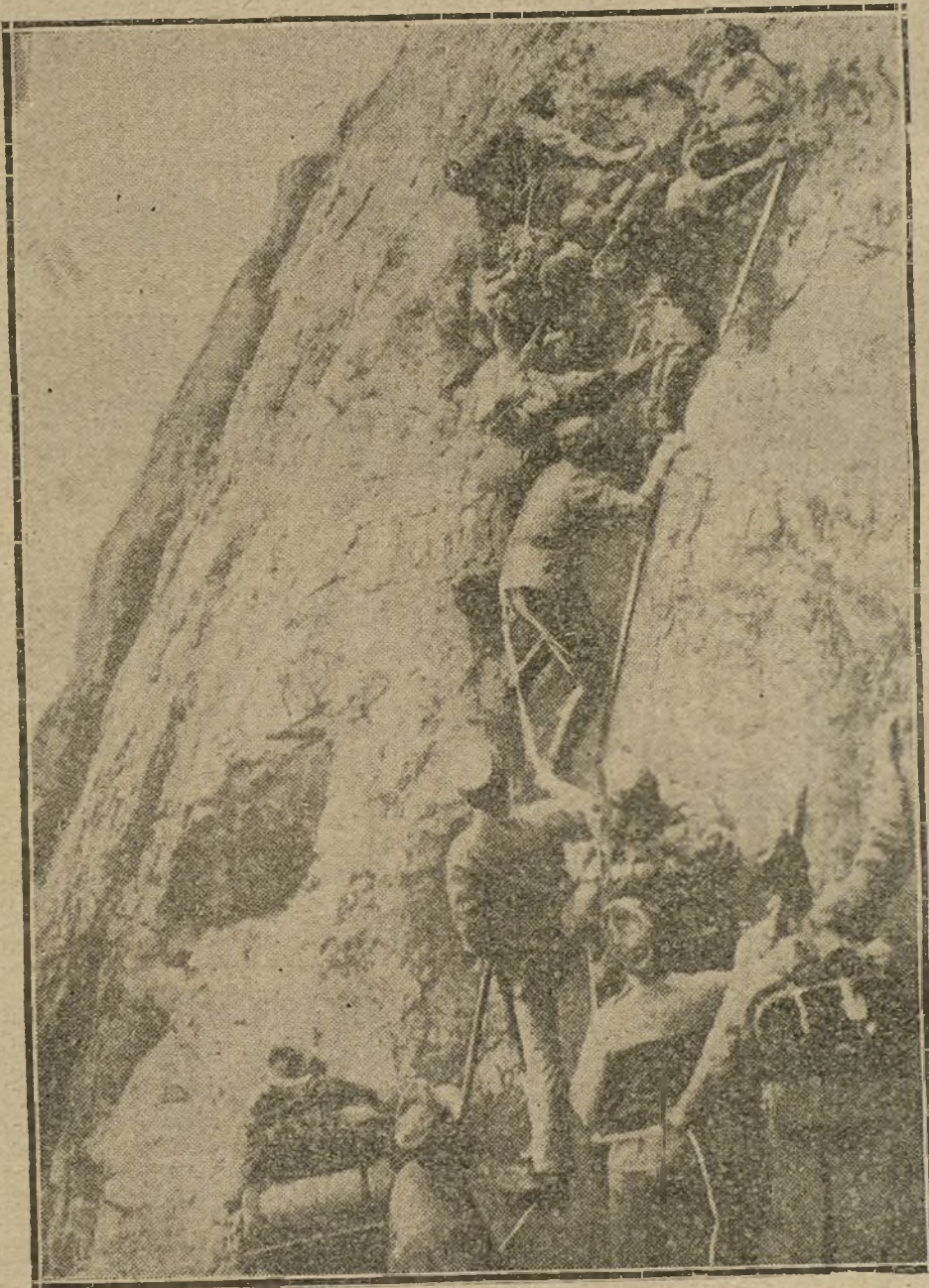
Tropas alpinas austrohúngaras escalando una montaña.

«El hecho de que el Consejo de Guerra de los aliados haya estimado necesario reunirse durante cuatro días seguidos indica la dificultad del problema. Todo el mundo se pregunta lo que va a pasar en los Balcanes. No vale la pena de ocultar el que la opinión en las esferas diplomáticas y militares de Francia, así como la gran masa del público, se expresa en