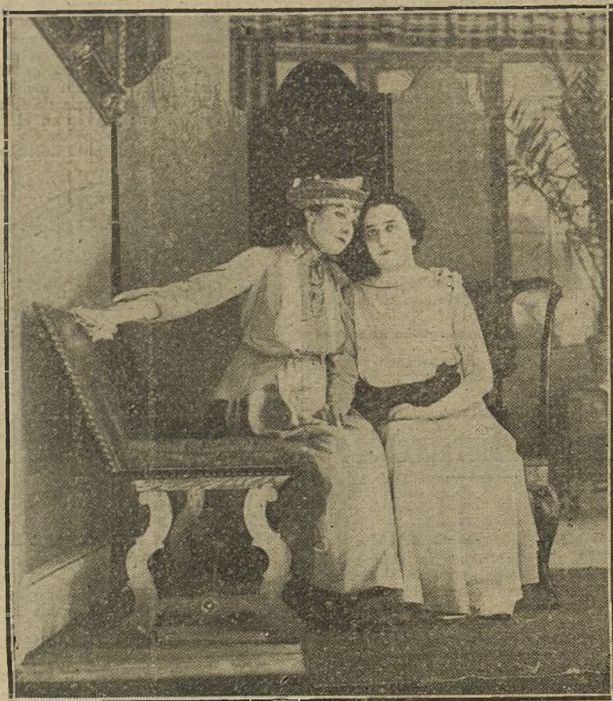
Las señoritas Pérez de Vargas y Carbone en una escena de «La propia estimación», comedia de Jacinto Benavente, estrenada anoche con buen éxito en el teatro de la Comedia.

INAUGURACIÓN DE LA COMEDIA. BENAVENTE, ENFERMO