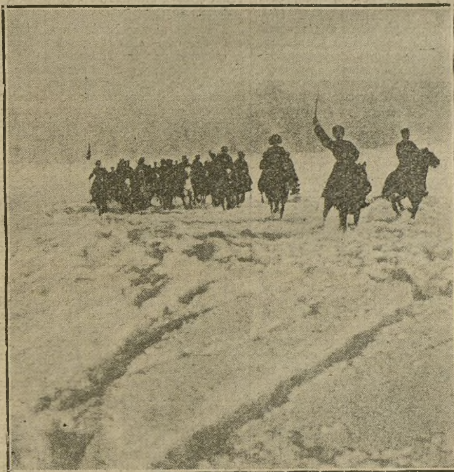
Un escuadrón de cosacos por una llanura nevada.

SEGUN DICEN DE ATENAS, UN ACORAZADO Y DOS TORPEDEROS HAN BOMBARDEADO EL PUERTO DE VARNA.—LOS ALIADOS TRABAJAN FEBRILMENTE EN EL VALLE DEL VARDAR.—LOS PROYECTOS DE LOS INVASORES DE ALBANIA Y MONTENEGRO. — ESPAÑA COMPRUEBA MATERIAL DE GUERRA EN LOS ESTADOS UNIDOS.—OTRAS NOTICIAS