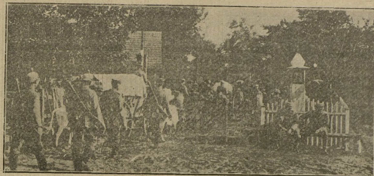
LA LUCHA EN OCCIDENTE.—Un convoy alemán al cruzar por las cercanías de una aldea del Iser.

LOS QUE SUSCRIBEN, AMANTES Y CULTIVADORES DE LAS CIENCIAS Y LAS ARTES, AFIRMANDO LA NEUTRALIDAD DEL ESTADO ESPAÑOL, SE COMPLACEN EN MANIFESTAR LA MAS RENDIDA ADMIRACION Y SIMPATIA POR LA GRANDEZA DEL PUEBLO GERMANICO, CUYOS INTERESES SON PERFECTAMENTE ARMONICOS CON LOS DE ESPAÑA, ASI COMO TAMBIEN SU PROFUNDO RECONOCIMIENTO A LA MAGNIFICENCIA DE LA CULTURA ALEMANA Y SU PODEROSA CONTRIBUCION PARA EL PROGRESO DEL MUNDO