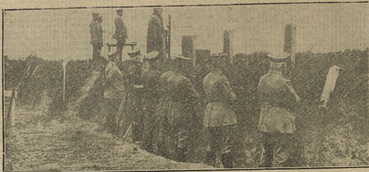
LA LUCHA EN ORIENTE.—El general von Heeringen, con su Estado Mayor, observando al enemigo con los periscopios desde una trinchera.