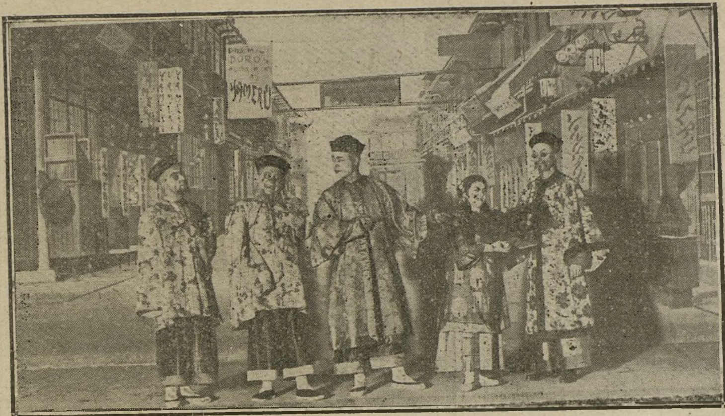
Escena de «Hijo del sol», obra de los Sres. Garrido y Quisiant, estrenada ayer en Apolo.

Si el hijo del ilustre autor de «Juan José» no tuviese ya una personalidad bien definida en el mundo de las letras, la hubiera conseguido anoche con creces. En el primer acto fué llamado á escena al ter-