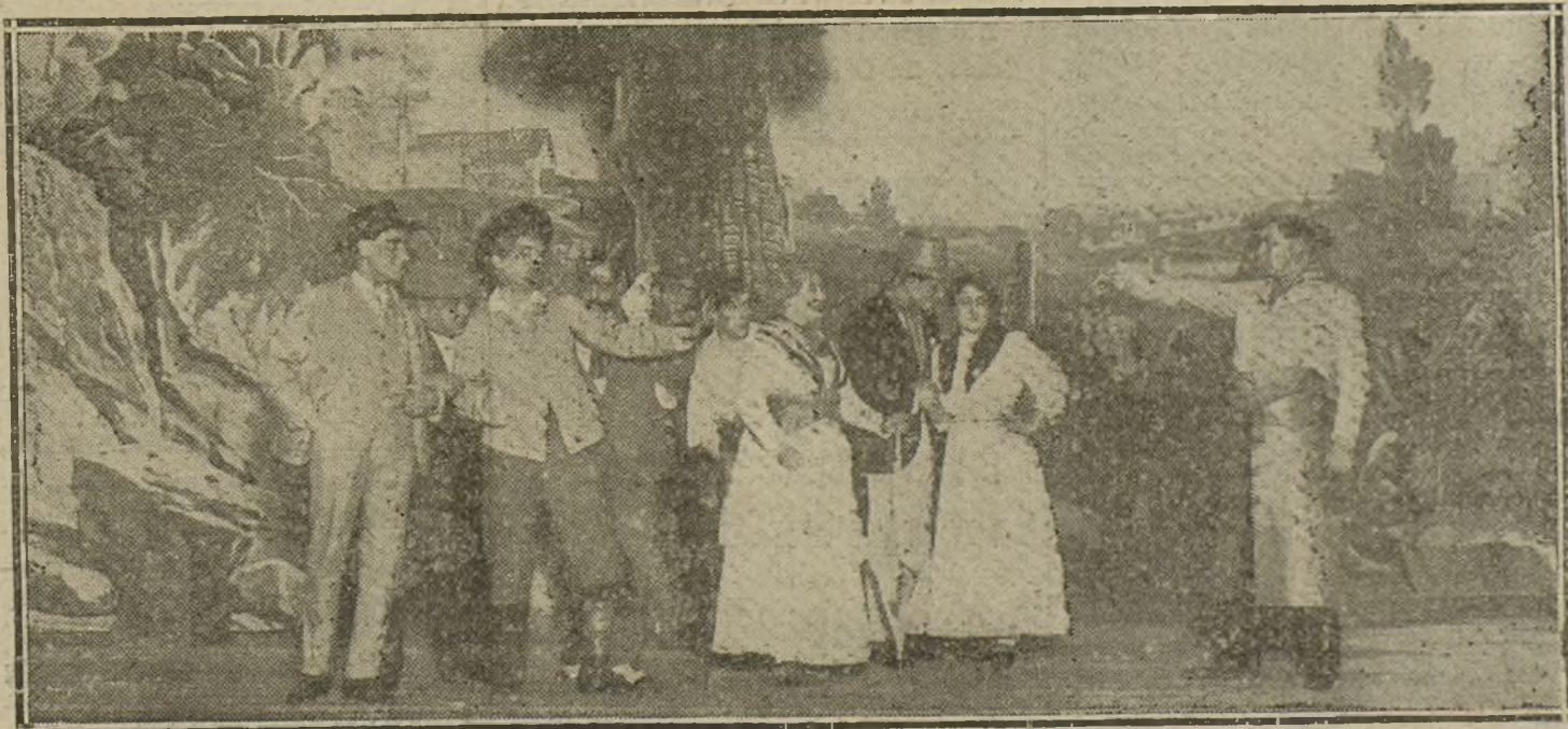
Una escena de «El roble de la Jarosa», comedia de Muñoz Seca, estrenada anoche en el teatro Español.

Salas de banquetes populares. Cabida de 100 cubiertos á 2.000.