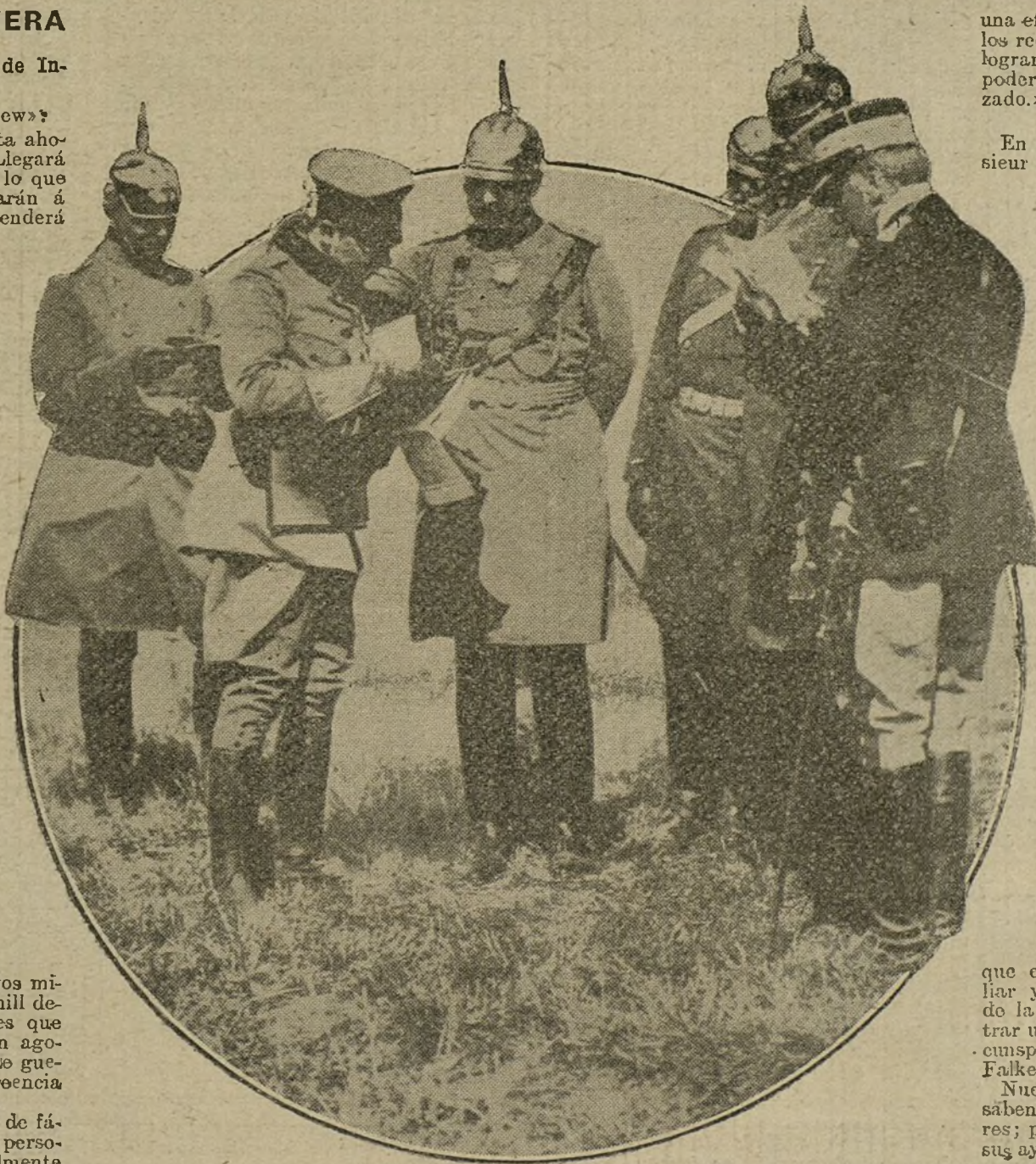
AYER Y HOY.—El jefe del Ejército italiano general Cadorna departiendo con el Kaiser durante las maniobras militares de Silesia en 1913.

Actualmente podemos calcular que próximamente el 40 por 100 de nuestras bajas vuelven ó volverán á los campos de bata-