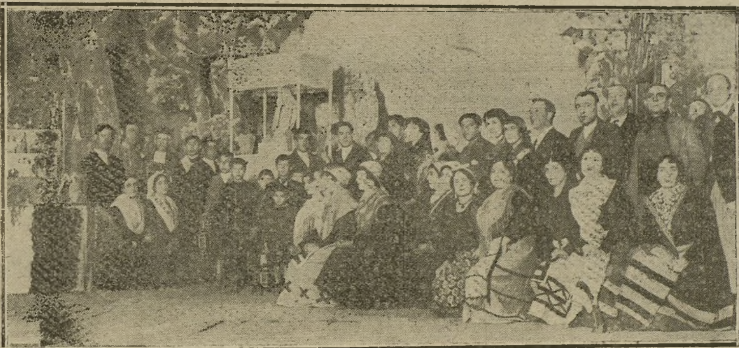
Una escena de «El idilio de Pedrín», zarzuela de los Sres. Dicenta (padre é hijo), música del maestro Gimeno, estrenada anoche en el teatro de Price.

minar la leyenda, que recitó el Sr. Barberá, una bellísima y sonora poesía, que por sí sola es capaz de acreditar á cualquiera de exquisito poeta.