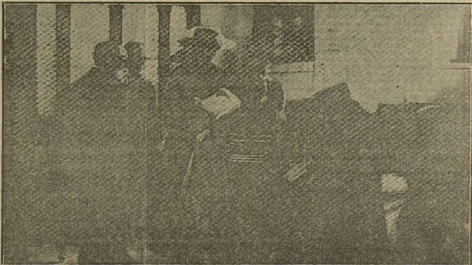
VISITA DE S. M. LA REINA VICTORIA AL ASILO MARIA CRISTINA.—Una asilada ofreciendo una labor de bordado á S. M.