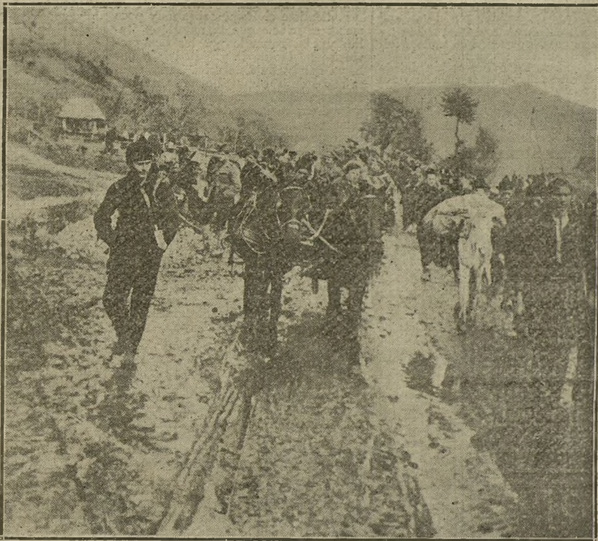
EL EXODO SERVIO.—Habitantes de las localidades servias amenazadas por los búlgaros, abandonando sus casas para refugiarse en Albania.

Nuestra Marina de guerra ha probado suficientemente, y lo probará de nuevo, que aprovechará todas las oportunidades que se le presenten para medir sus fuerzas con el enemigo, cada vez que las pro-