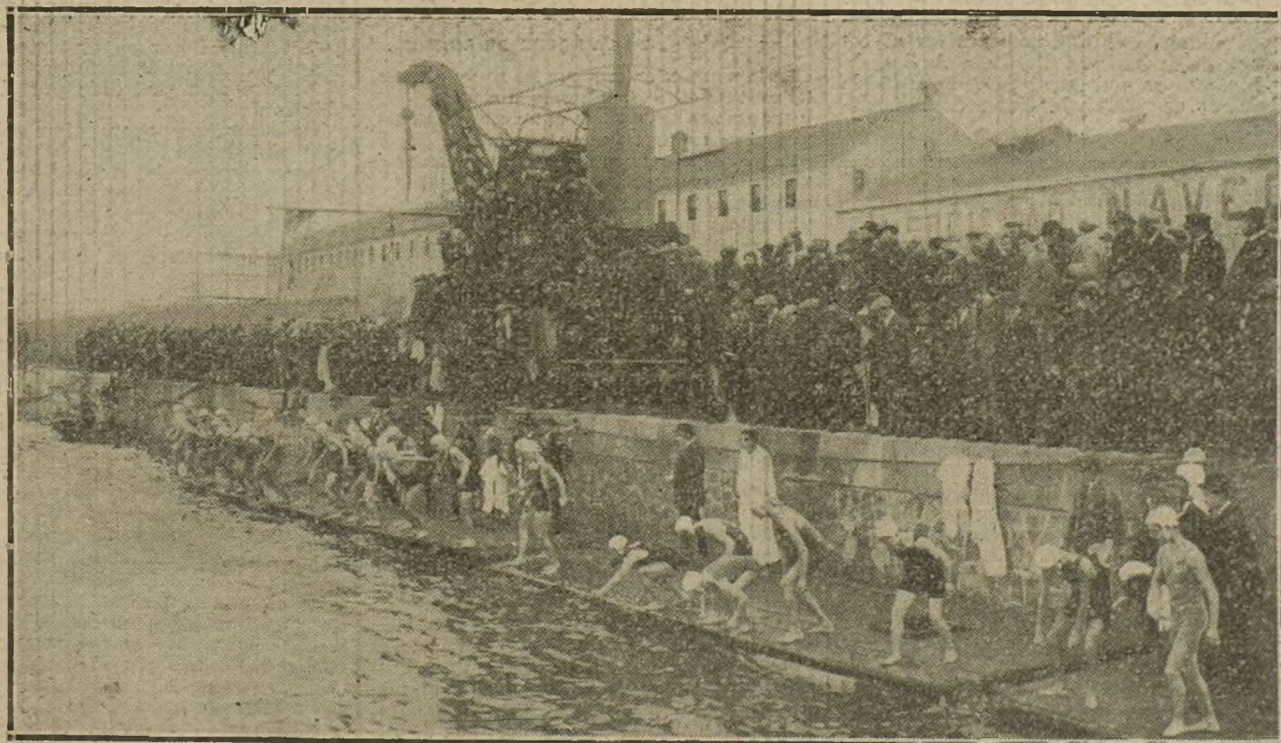
Vista parcial del puerto de Barcelona en el momento de comenzar el concurso de natación para disputarse la Copa Barcelona.

MOTO-GARAGE.—Motocicletas «James», accesorios y reparaciones.—Hermosilla, 85: