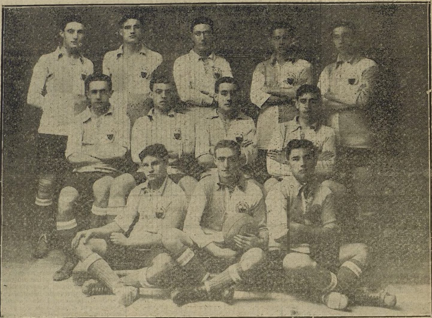
Notable primer equipo del Sabadell F. C., que jugará con el Madrid F. C. los días 1 y 2 de Enero de 1916.

Si buenos han sido los campeones de Portugal, mejores nos dicen que son los suizos, que jugarán con el Madrid F. C. los días 8 y 10 de Enero de 1916. El equipo que nos visitará es el «Montriod Sport», de Lausanne (Suiza francesa). El equipo está formado como sigue: