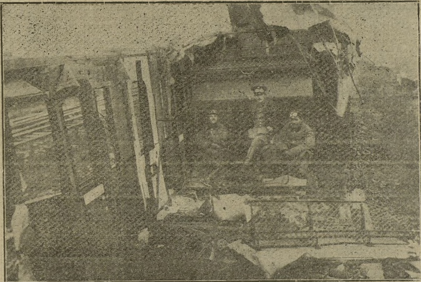
LA GUERRA EUROPEA.—Militares alemanes visitando un tren militar que había sido destruido por la artillería enemiga.

«Orden del día al 83 regimiento de Infantería número 134.