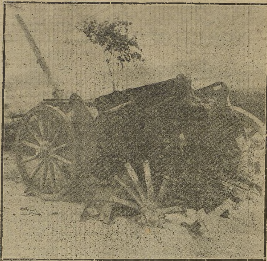
LA GUERRA EUROPEA.—Un carro de municiones destruido por la artillería alemana.

—Si hoy no se estableciera—dijo con el tono grave de un lord parlamen-