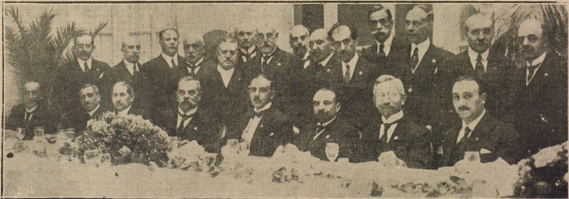
EL CONGRESO POSTAL.—BANQUETE OFRECIDO EN EL RITZ POR LA COMISION ESPAÑOLA ORGANIZADORA DEL VII CONGRESO, A LA COMISION INTERNACIONAL DE BERNÁ. QUE PRESIDE MR. DECCOPE T. (X).

Primera carrera. — Premio «Royal Bait»; 1.300 metros. Primero, 2.000 pesetas, «De Rigdeten», del marqués de San Miguel (Clout). Segundo, 300, «Palmipol», del duque de Toledo (Lyne). Tercero, 200, «Rosina», del conde de la Ciment (Archibald).