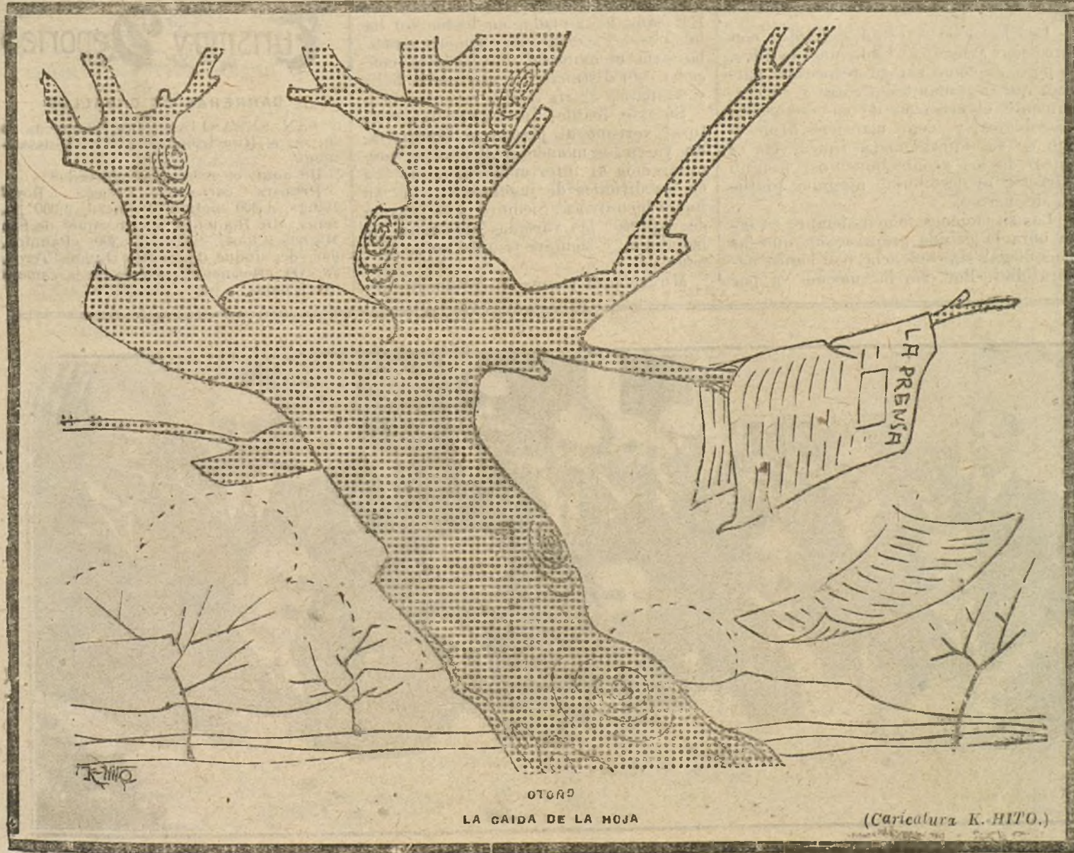
OTORG LA CAIDA DE LA HOJA

—Sí. —Entonces, ¿cómo se explica que intentara cruzar? ¿No le parece que, siendo la