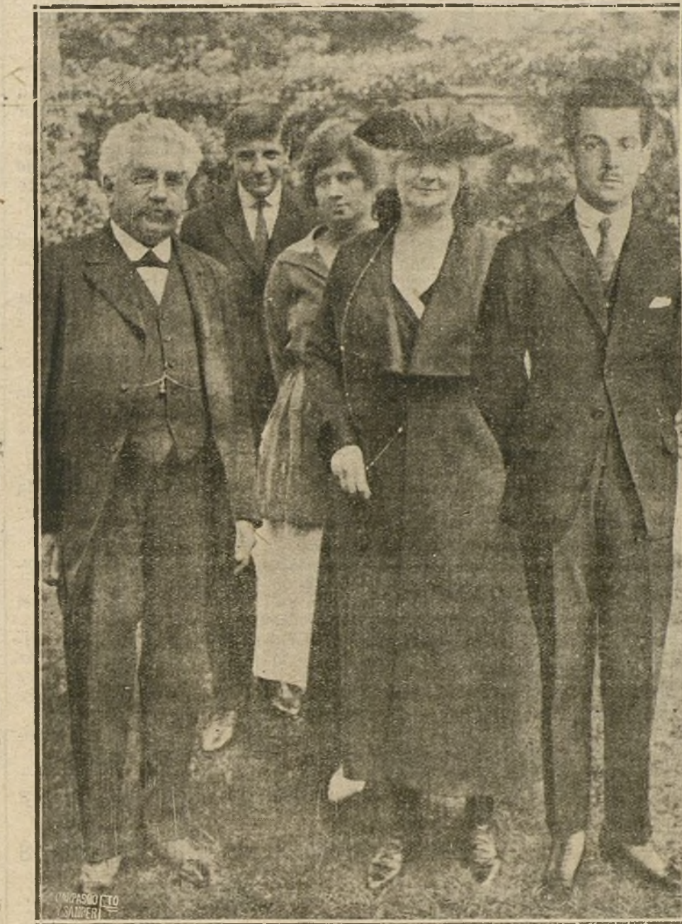
LA FAMILIA DEL NUEVO PRESIDENTE DE LA REPUBLICA FRANCESA.—M. MILLERAND, CON MADAME MILLERAND Y SUS TRES HIJOS, EN EL JARDIN DE LA CASA DEL PRESIDENTE.

De allí a poco, una de las mozas de servicio que hallábase junto a la puerta del salón dijo que hacia el piso entre-meló oíanse golpes como derribar un tabique; era que los sublevados habían hecho dueños de aquellos lugares. No me preciso mucho espacio para que viéramos a conocer que la Reina de