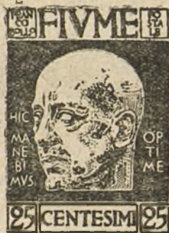
EL NUEVO SELLO QUE ACABA DE LANZAR D'ANNUNZIO EN FIUMME

Después de ser este jovencito ya se dibuja el hombre que había de ser. Su alma es osada y ligera. Por lo presumida que es y por lo generosa que es en ella esa presunción llegará hasta tener realmente las cualidades de que presume. En los límites de la exaltación se da ese caso de que lo aparente sea de