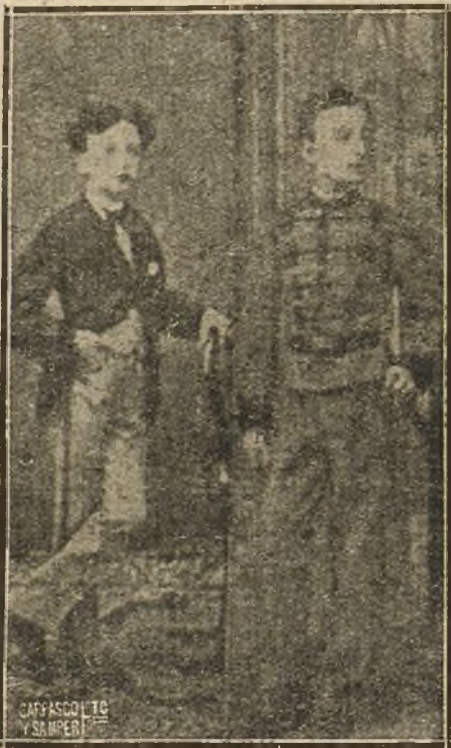
DOS ASPECTOS DE LA NINEZ DE D'ANNUNZIO

verdad, en una evolución rápida, lo que aparentaba.