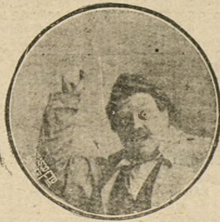
EL GENIAL ARTISTA VALLEJO SENTIENDOSE BOLCHEVIQUE.

No se amilanó Montoro, y, secundado por Peydró (el triunfador con el hijo del llorado Granados), tendieron la red a ese «fiburonazo» de la escena his-