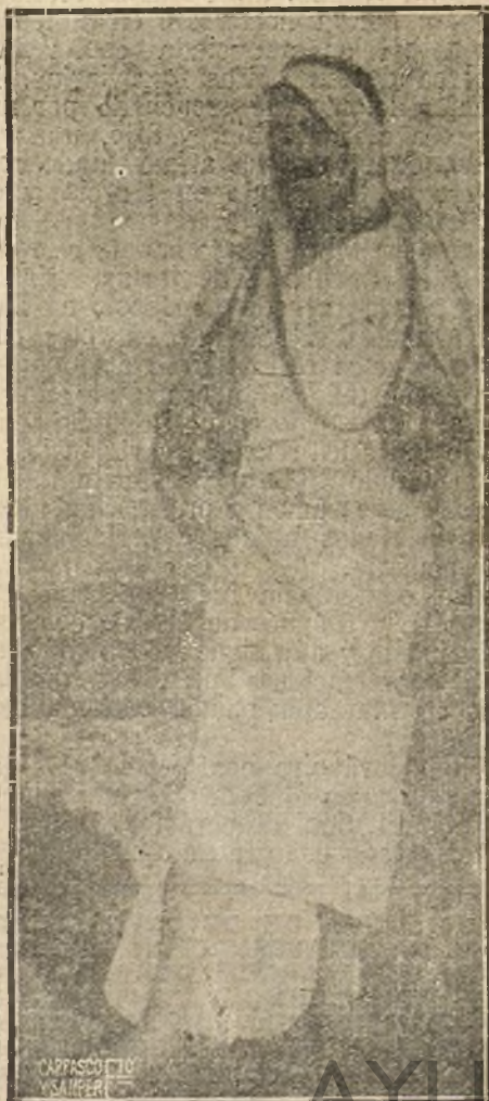
CURIOSA FOTOGRAFIA DEL POETA