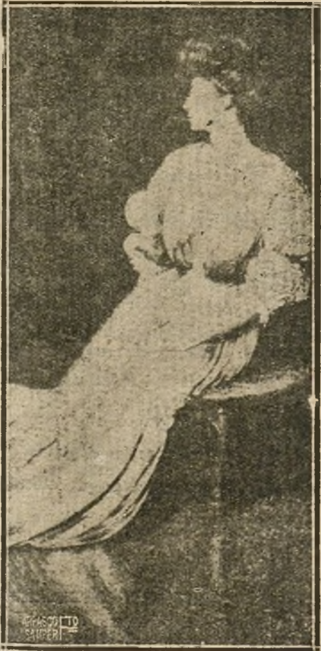
LA EMINENTE ACTRIZ ELEONORA DUSE