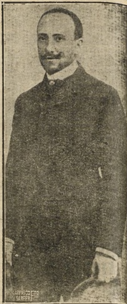
D'ANNUNZIO EN 1912

Ya es D'Annunzio, mucho antes de que la guerra estalle, el reivindicador de las tierras irredentas; pero le sirve la guerra europea para gritar sus verdades y mover a su país a la guerra. Toca el clarín subido a todos los bancos pu-