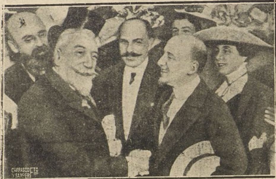
GABRIEL D'ANNUNZIO Y ANATOLE FRANCE ESTRECHANDOSE LA MANO