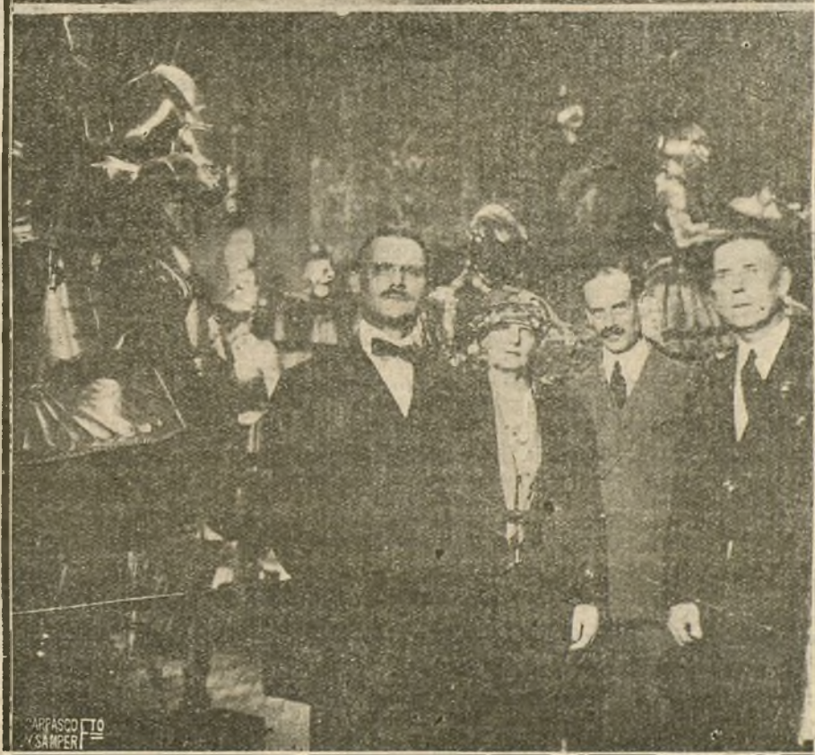
DEL CONGRESO POSTAL.—LOS DELEGADOS EXTRANJEROS DURANTE SU VISITA A LA ARMERIA REAL.

sacrificó su natural impulso de fuerza y dejó el paso libre a la intervención pacificadora. El interés nacional se superpone al ansia militar de la lucha bizarra. Esta vez, la victoria no tendrá el estruendo de los combates ni los gloriosos sacrificios del heroísmo. Esta vez la victoria pertenece a la paz.