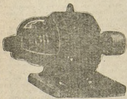
Motores para corriente trifásica.