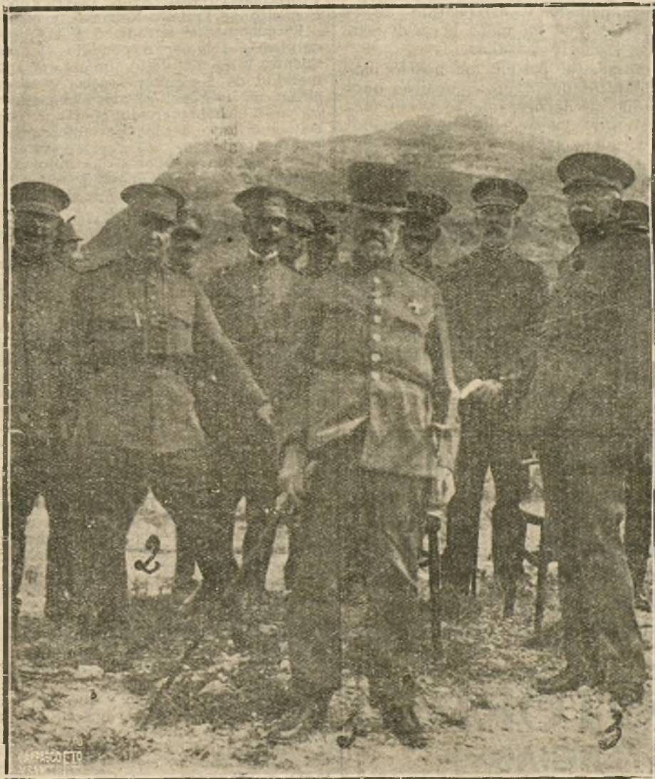
EL GENERAL WEYLER EN CARTAGENA.—EL DUQUE DE RUBI, GENERAL WEYLER (1), ACOMPAÑADO DE LOS GENERALES COELLO (2) Y CEBALLOS (3), PRESECIANDO LOS EJERCICIOS DE TIRO DE ARTILLERÍA DURANTE SU VISITA AL FUERTE DEL FRENTE IZQUIERDO.

Si el acordeón es voluptuoso y frágil, se deja acariciar como una mujer coqueta, se estira como el Presupuesto, lanza una voz académica y puede calificarse de ejercicio gimnástico al mismo tiempo que de caja melódica. ¡Qué importaban las diatribas, las sátiras, las censuras de sus enemigos!... Gente plebeya y sin buen gusto, que no saben una palabra de ortografía y que desconocen cómo se deslizan las ondas en el conducto auditivo para transportarnos a los paraísos celestiales de los maestros cantores de Nieremberg y los ciegos de las esquinas.