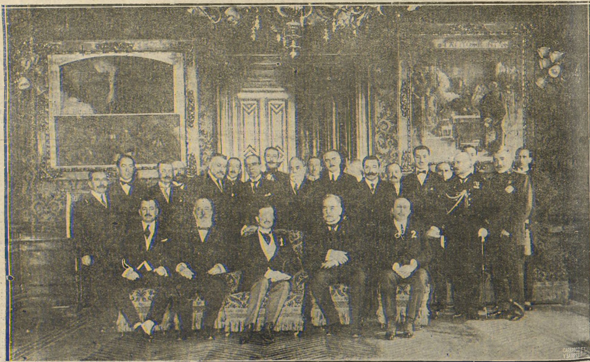
INTERESANTE FOTOGRAFIA DE LA COMISION QUE VA A CHILE REPRESENTANDO A ESPANA EN LAS FIESTAS QUE SE CELEBRARAN CON MOTIVO DEL CENTENARIO DE MA- GALLANES, Y QUE PRESIDE S. A. R. EL INFANTE DON FERNANDO (1), EN REPRESENTACION DE S. M. EL REY.—EN ESTE GRUPO FIGURAN TAMBIEN EL MINISTRO DE ESTADO, DON MARQUES DE LENA (2), Y TODO EL CUERPO DIPLOMATICO AMERICANO ACREDITADO EN ESPANA. (FOTOGRAFIA OBTENIDA EN UNO DE LOS SALONES DEL MINISTERIO DE ESTADO.