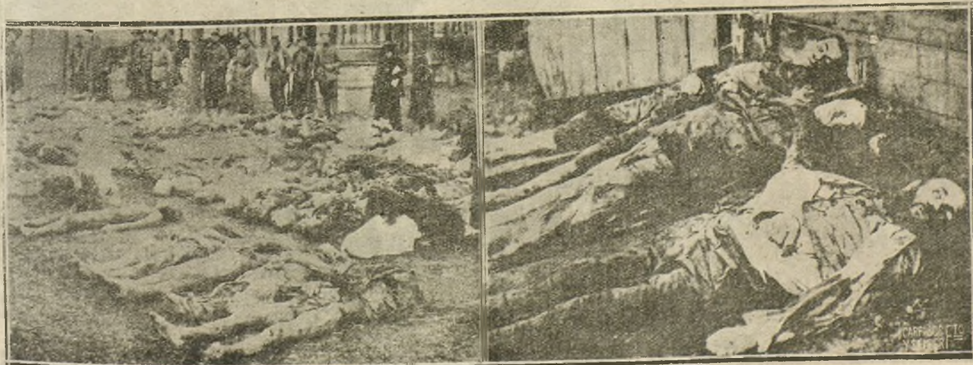
VÍCTIMAS DEL TERROR BOLCHEVISTA. (FOTOGRAFÍA TOMADA EN EL MOMENTO DE ENTRAR EN LA CIUDAD DE WALK LAS TROPAS ANTIBOLCHEVISTAS)

Sentimos las manifestaciones de esos milloneros; pero la Casa Pajares seguirá siendo la preferida del público por calidad y precio tan reducido a que vende.