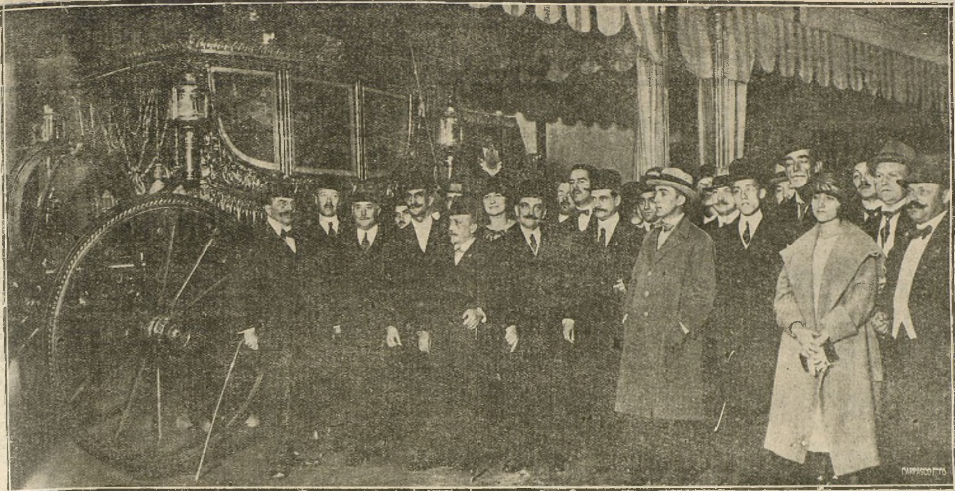
LOS DELEGADOS EXTRANJEROS DEL CONGRESO POSTAL DURANTE LA VISITA QUE HAN EFECTUADO A CABALLERIZAS REALES. (FOT. DAL.)

La rosa joven se erguía cada día más bella en su tallo flexible, rodeada de hojas de brillante púrpura amoratada.