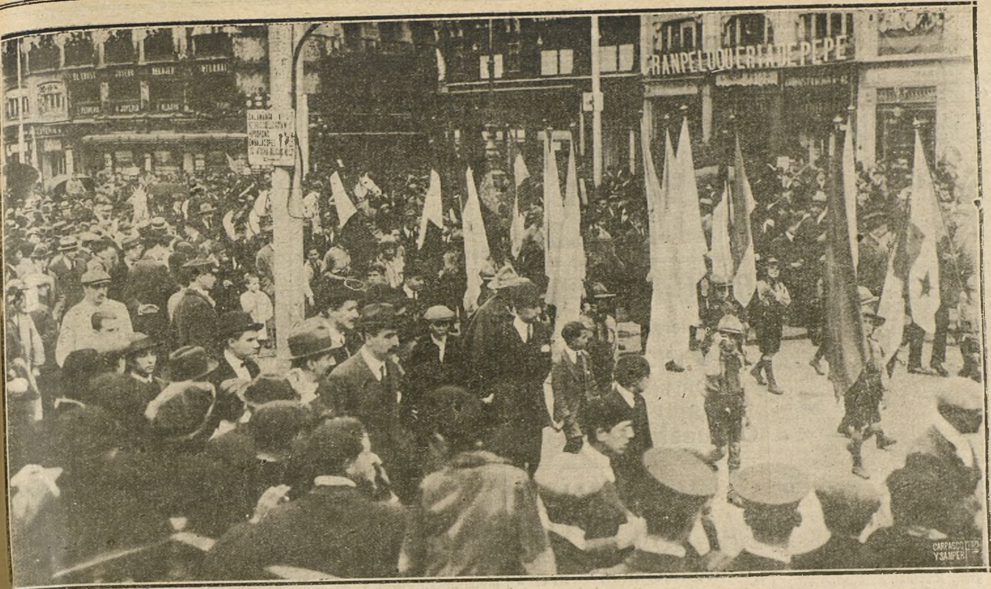
LA MANIFESTACION ESCOLAR. CELEBRADA ESTA MAÑANA CON MOTIVO DE LA FIESTA DE LA RAZA, A SU PASO POR LA PUERTA DEL SOL.