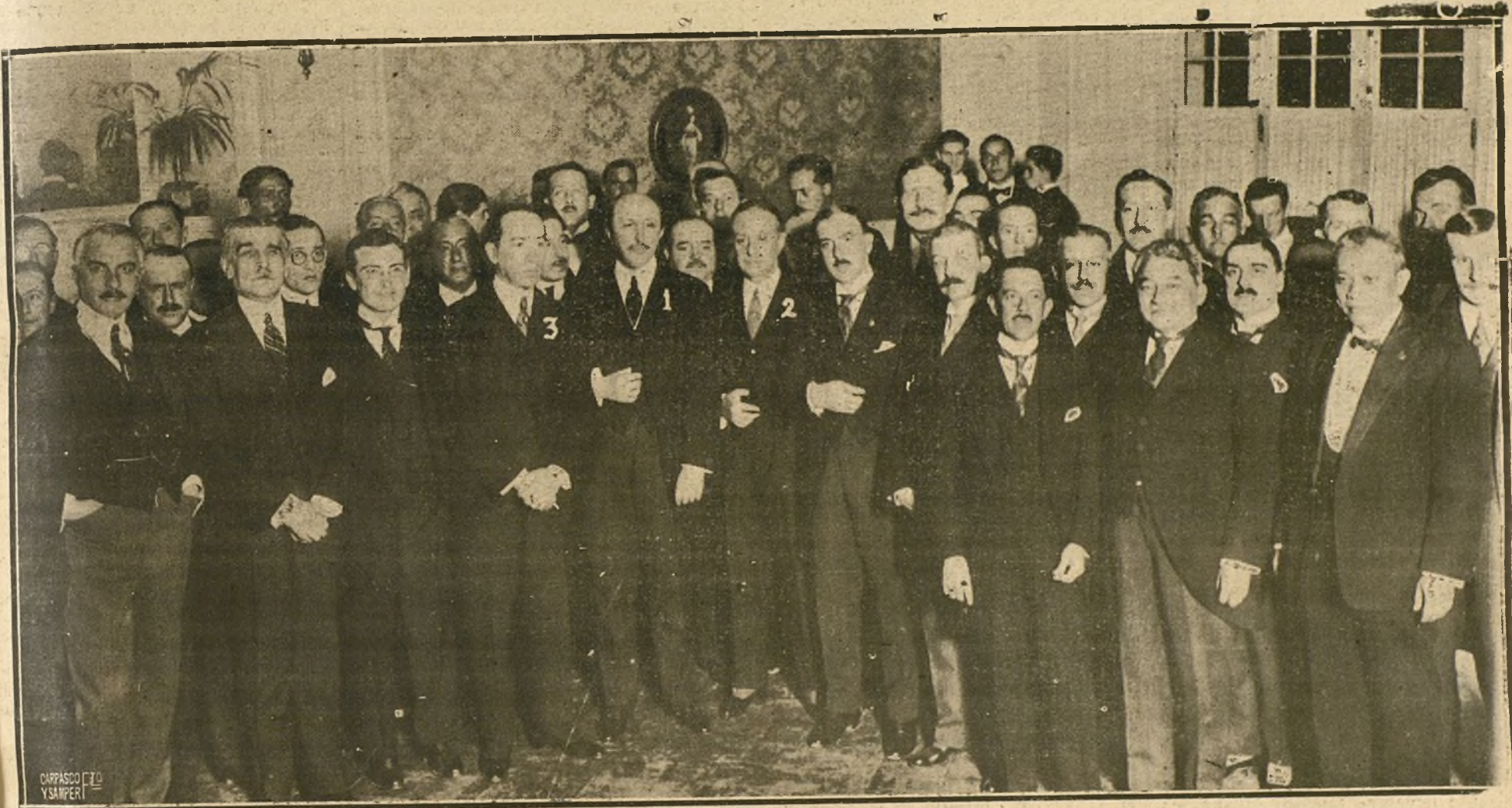
EL MINISTRO DE ESTADO, MARQUES DE LEMA (1), Y EL NUEVO EMBAJADOR DE ESPAÑA EN LA ARGENTINA, SEÑOR MARQUES DE AMPOSTA (2), CON LOS MINISTROS, CONSULARES Y DELEGADOS AMERICANOS, DURANTE EL TE CON QUE FUERON OBSEQUIADOS EN EL PALACE HOTEL POR EL ENCARGADO DE NEGOCIOS DE LA ARGENTINA, SEÑOR LEVILLIER (3), CON MOTIVO DE LA FIESTA DE LA RAZA.