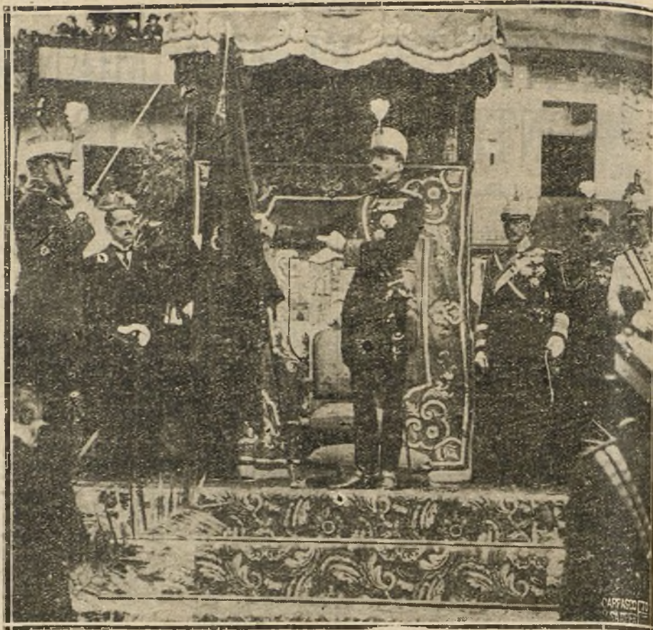
M. EL REY ENTREGANDO LA BANDERA AL NUEVO REGIMIENTO DE LAS ORDENES LITARES, DE GUARNICION EN ESTELLA.

Las colectividades no saben administrar; un solo hombre, sí. Un alcalde que se atreva, también. Un solo director puede dirigir, si es competente; cincuenta directores a la vez sólo pueden embrollar e impedir toda dirección conveniente y definida. Los cincuenta concejales de Madrid podrían ser buenos fiscalizadores; pero la dirección y administración debe llevarlas el alcalde. Cuando sea preciso hacer alguna «alcaldía en bien del vecindario», hay que hacerla; cuando el interés público demande audacias, hay que ser audaz; cuando la voluntad de un alcalde sea inferior a la de los cincuenta concejales, una «aurora boreal» sería eficazísima.