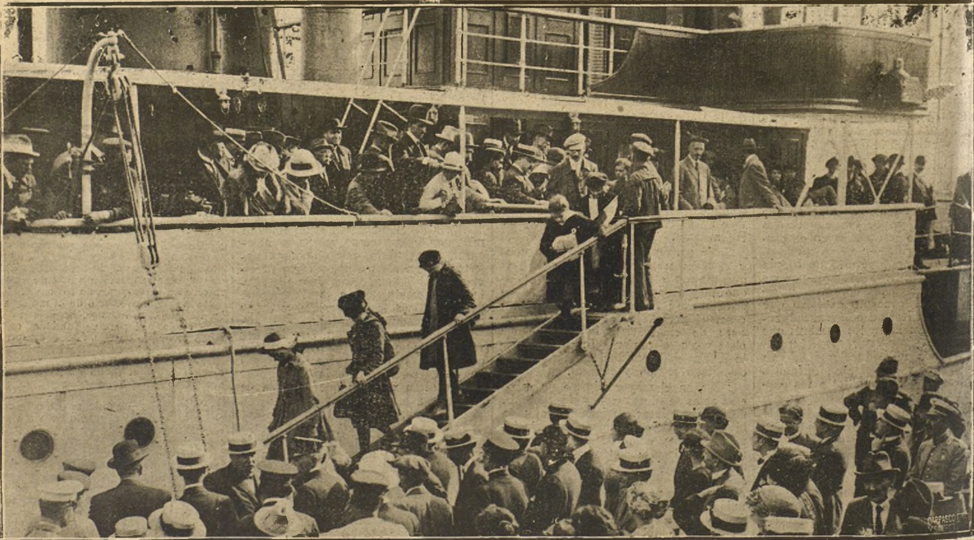
EMBARCO EN EL PUERTO DE BARCELONA DE LA PRIMERA EXPEDICION DE NIÑOS AUSTRIACOS, HUERFANOS DE LA GUERRA, RECOGIDOS POR FAMILIA DE LA CAPITAL

Durante el acto se pronunciaron varios discursos enalteciendo la figura de Ferrer.