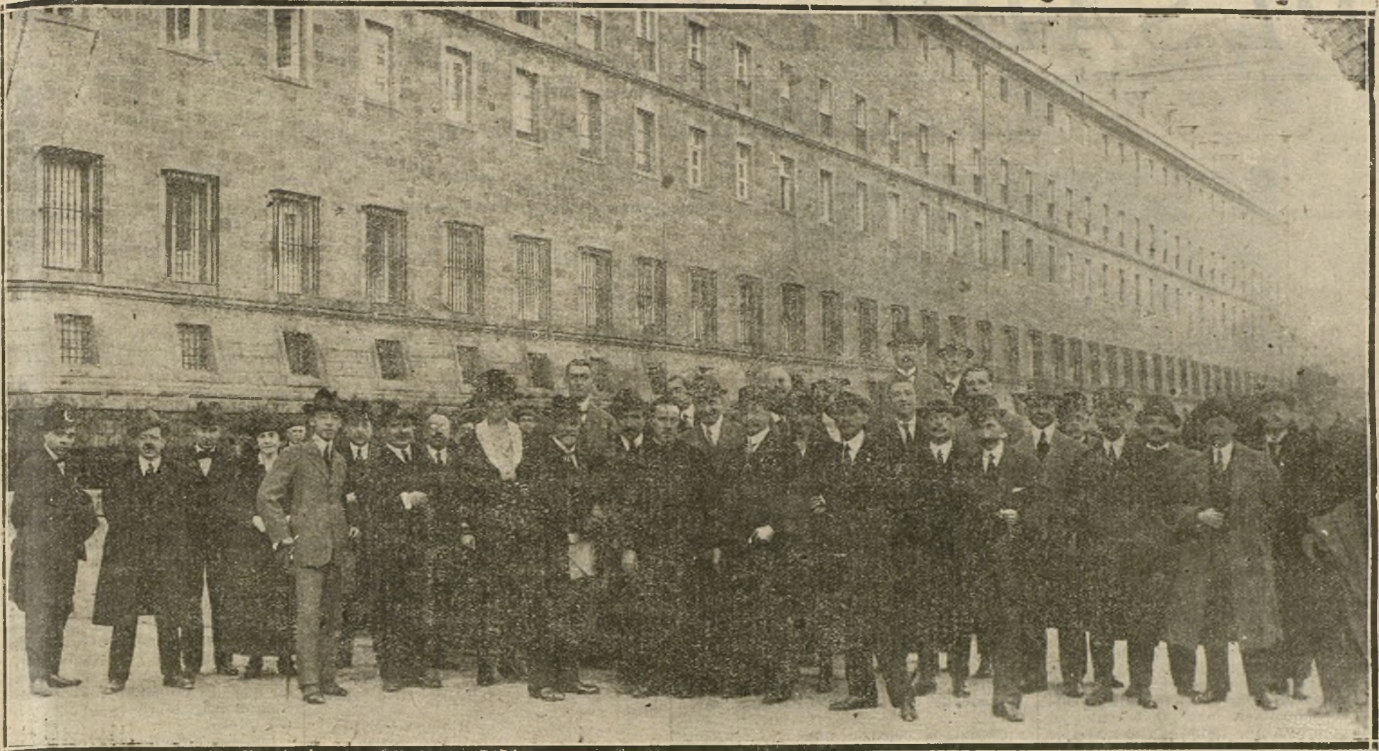
EL CONGRESO POSTAL—GRUPO DE DELEGADOS EXTRANJEROS EN LA LONJA DE EL ESCORIAL, CUYO MONASTERIO VISITARON AYER.