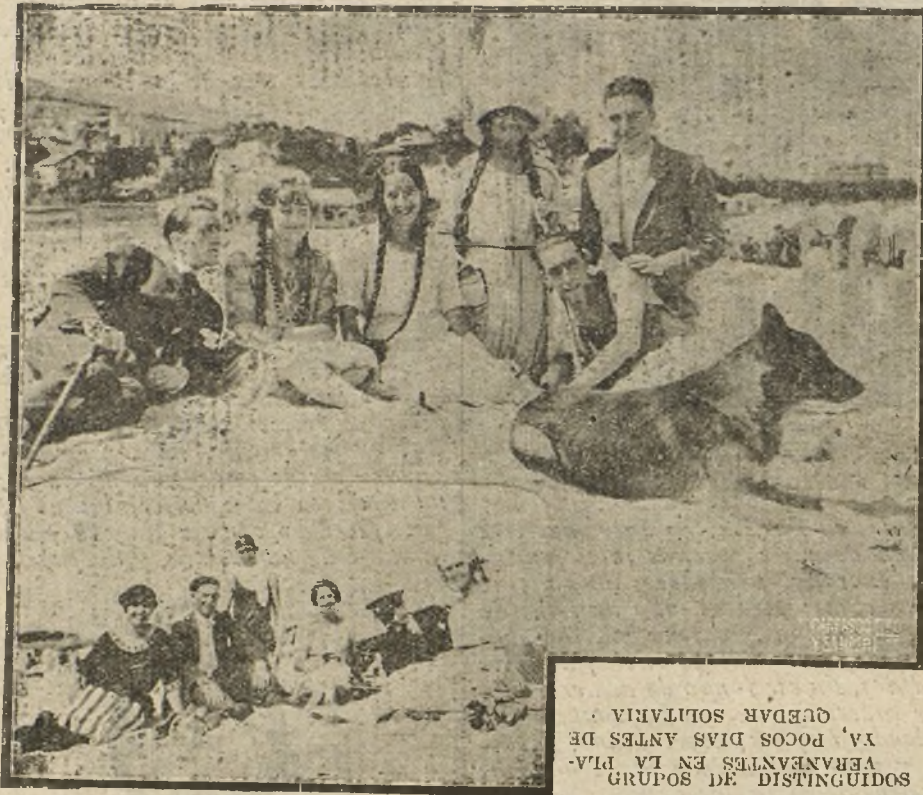
YA, POCOS DIAS ANTES DE VERNANAVTES EN LA PLAYA, Quedar solitaria

NO SE DEVUELVEN LOS ORIGINALES GRAFICOS NADA MAS QUE EN EL CASO EN QUE PREVIAMENTE HAYAN SIDO ADQUIRIDOS CON ESA CONDICION.