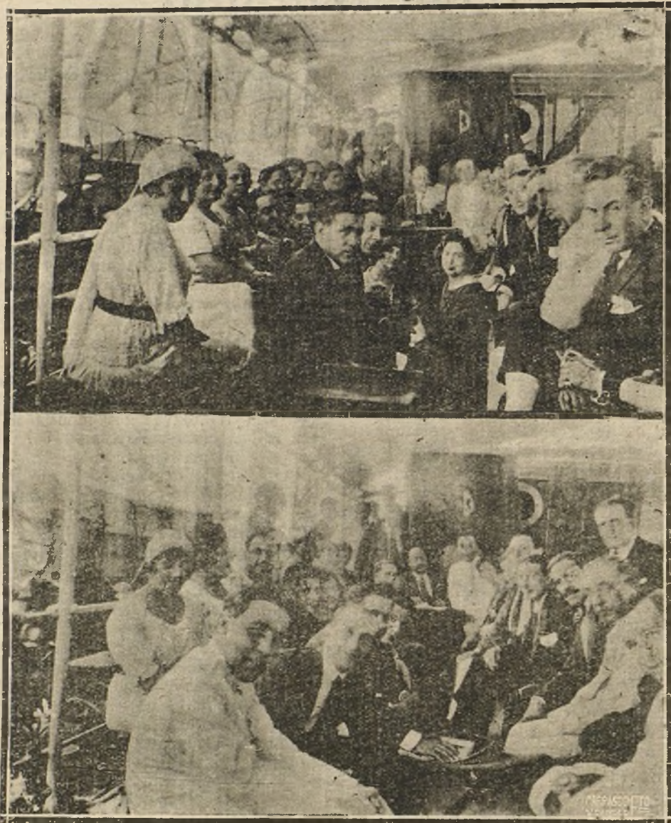
EL ESTRENO DE ESTA NOCHE.—EL ILUSTRE AUTOR LINARES RIVAS A BORDO DEL BARCO EN EL CUAL HAN HECHO EL VIAJE A LA HABANA, LEYENDO A LA COMPANIA DE LARA SU OBRA «CRISTOBALON», QUE SE ESTRENA ESTA NOCHE

Las circunstancias de esta obra, estrenada ya y con el favor de muchos públicos en diversas poblaciones de América, constituyen un caso especial que coarta mis palabras. Antes del estreno sé lo que quise hacer; pero no sé lo que hice; después de juzgada por el público y por la Prensa, sé ya lo que hice, y se esfuma, se borra el intento preliminar de mi pluma y de mis ideas.