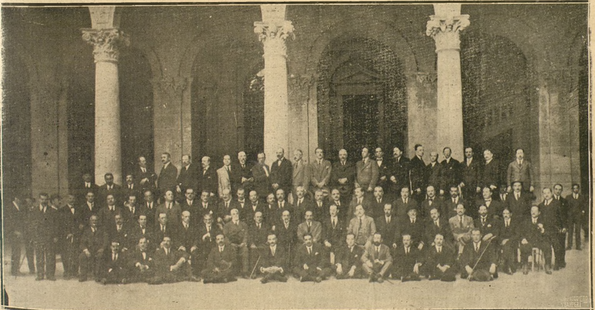
GRUPO DE ASISTENTES A LA VIII ASAMBLEA DE FARMACEUTICOS NACIONAL CELEBRADA EN TOLEDO.

Las demás conclusiones son parecidas a las acordadas en anteriores Asambleas.