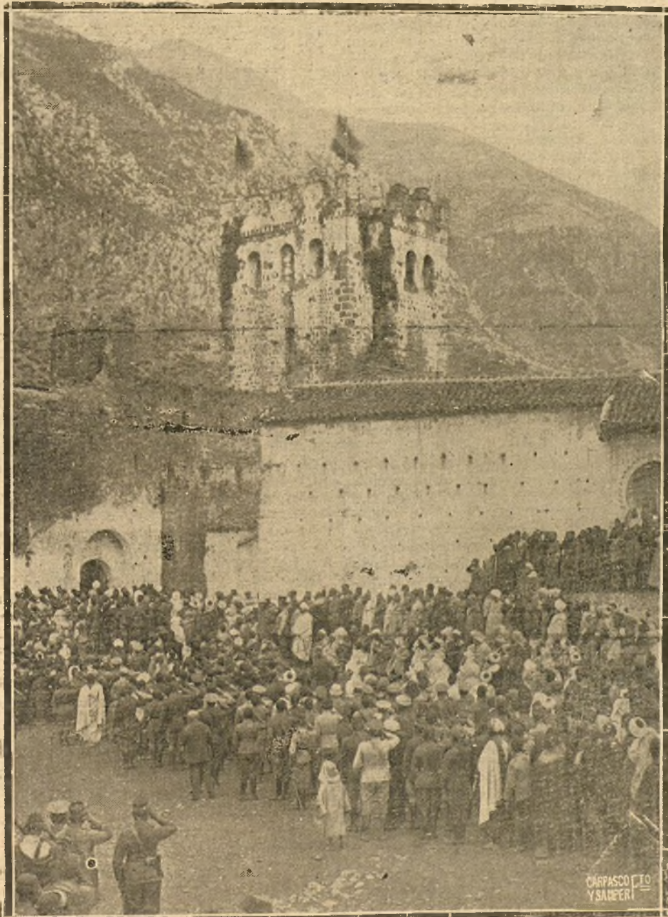
NUESTRA ACCIÓN EN MARRUECOS.—SOLLEMNE MOMENTO DE COLOCAR LA BANDERA ESPAÑOLA EN LO ALTO DE LA ALCAZABA DE XEXAEN.

Emprendió ésta el camino en medio del mayor entusiasmo y con el mejor espíritu patriótico.