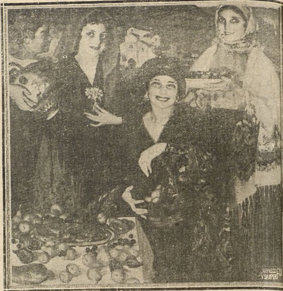
CUADRO DE CRUZ HERRERA, QUE FIGURA EN LA EXPOSICION DE OTOÑO

Es desconsolador tener que expresarse así, cuando nos hemos pasado tanto tiempo censurando el final desastroso del siglo XIX. Pero, ¿cuántas impresiones vigorosas podrán anteponerse a éstas de los cuadritos de Eugenio Lucas, que nos hablan de los sucesores de Goya? ¿Cuántos lienzos de la Exposición tienen la fuerza varonil y la serena melancolía del «Violinista», de