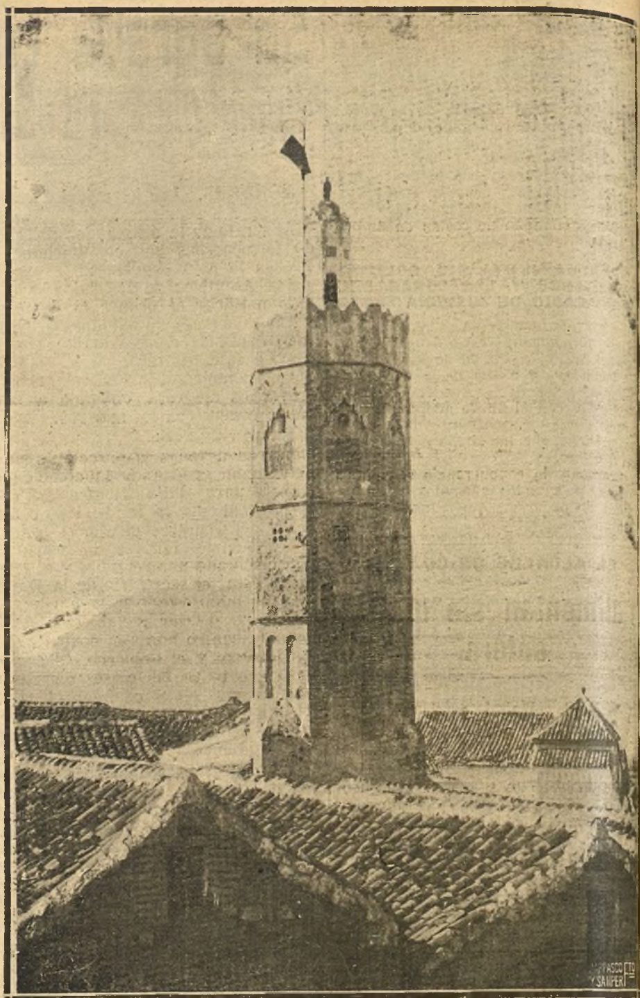
NUESTRA ACCION EN MARRUECOS.—JAMEA EL KEBIS (MEZQUITA GRANDE), UNA DE LAS ESBELTAS Y BELLAS TORRES DE LA CIUDAD SANTA DE XEXAUEN.

Tiéndese a mejorar la coordinación y relación de los órganos dependientes del ministerio, sin perjuicio de la conservación de una relativa autonomía administrativa, para el mejor desempeño de las atribuciones que tienen conferidas.