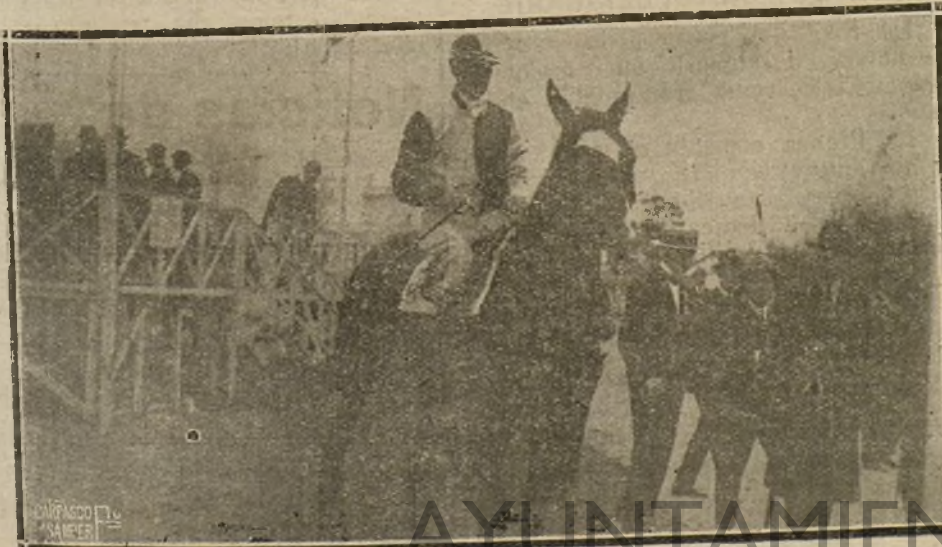
«VESTALIN», VENCEDOR DE LA COPA DEL PREMIO DE OTOÑO, PROPIEDAD DE LOS SEÑORES FABRA Y PALLEJA.

Intervienen: «Frap», de don Pedro Milá; «Brunan», del barón de Guell; «La Ramée», de J. Pons y Perola; «Rango», de Bosch-Ferrer-Viñamala; «Begg», de Fabra-Pallegá; «Vestalin», de los mismos señores; «Cyruar», del