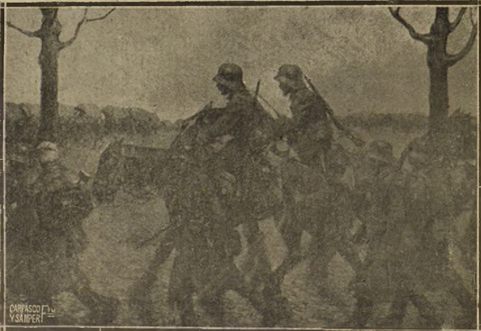
«1918», CUADRO DE AGUSTÍN LÓPEZ, QUE FIGURA EN LA EXPOSICION DE OTOÑO

Debía bastar a nuestras autoridades tan por la sospecha de que algo de esto ocu-