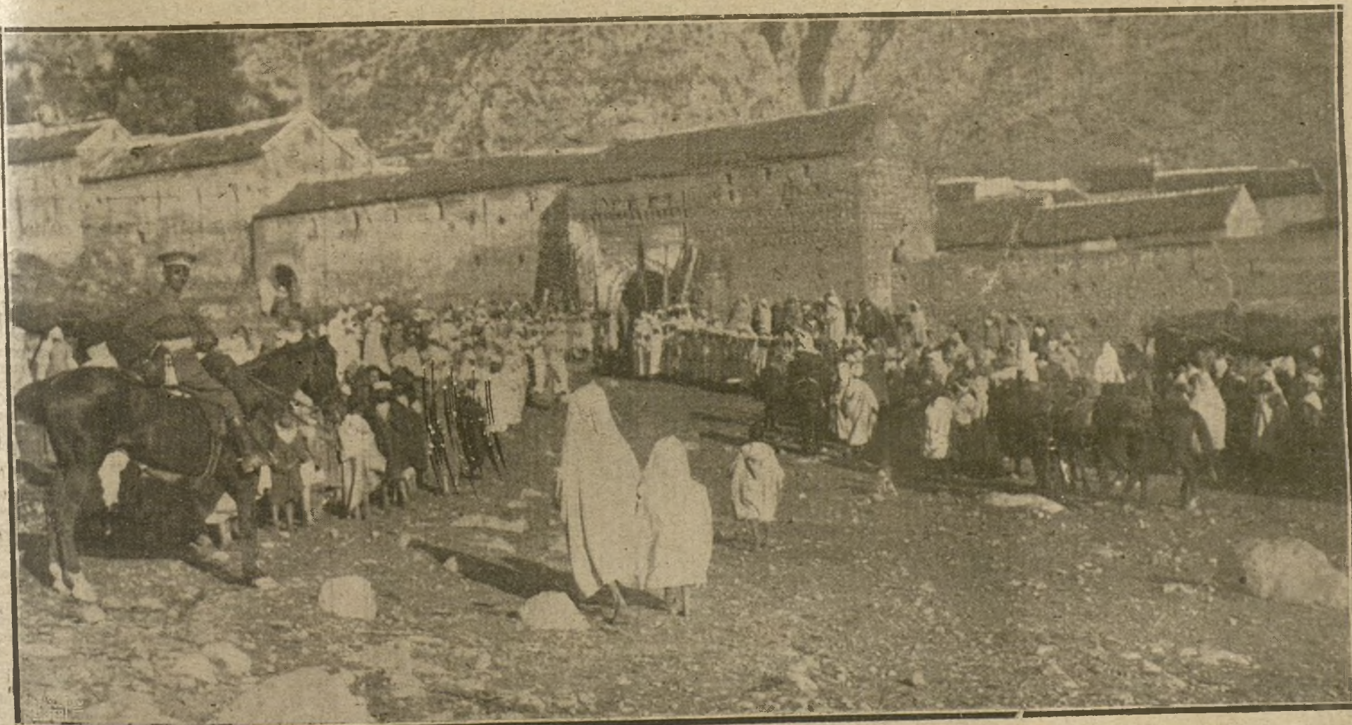
EN MARRUECOS.—ASPECTO QUE OFRECÍAN LAS PUERTAS DE LA CIUDAD SANTA DE XEXAUEN EN EL MOMENTO DE HACER SU SOLEMNE ENTRADA EL GENERAL BERENGUER.