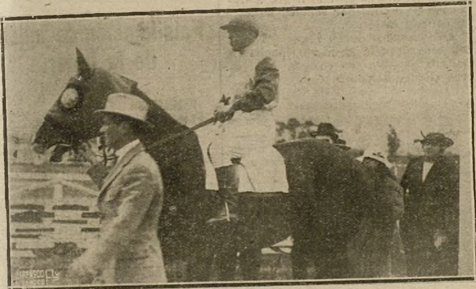
«FOXERL», VENCEDOR DEL PREMIO «ONYAR», PROPIEDAD DE DON EUSEBIO BERTRAN.

Vapor español «Segarra», para Valencia; vapor español «Sabin», para Tarragona; vapor francés «Darday», para Marsella; laúd español «Pepto», para Palma; vapor «Virgen de África», para Valencia; vapor español «Albino», para Gijón; laúd español «María», para Alicante; vapor americano «Elwyter», para Londres y escalas.