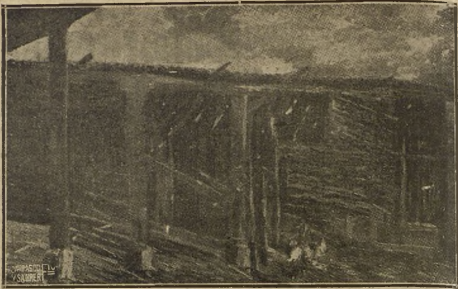
«UN ENCERRADERO», CUADRO DE JUAN ESTINA CAPO, QUE FIGURA EN LA EXPOSICION DE OTOÑO

to de un modo elevado, sin truculencias, sin sangre, sin crueldad, con ternura, con piadosa hidalguía.