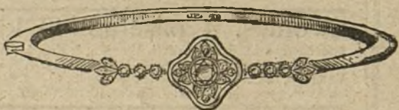
Núm. 4.—Pulsera un brillante y diamantes. Pesetas 450.