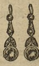
Núm. 6.—Pendientes 4 brillantes y diamantes. Pesetas 200.