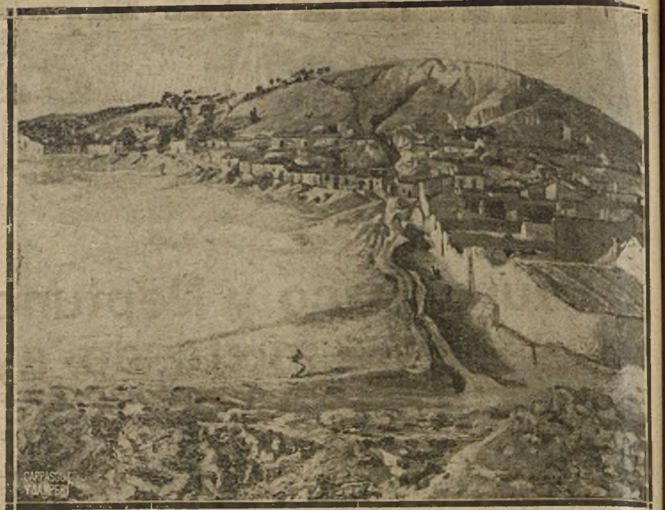
«CUESTA DE LA MARQUESA». PAISAJE DE GARCÍA LESMES, QUE FIGURA EN LA EXPOSICIÓN DE OTOÑO

Sus paisajes levantinos, sus apuntes locales, sus estudios de temas costumbristas, participan de ese doble encanto de la impaciencia moceril y la perfección madurada. Duda en algunos, con la incertidumbre tímida y candorosa de los primeros pasos; se afirma en otros con precoz seguridad, y define en todos de manera que disipa cualquier peligro