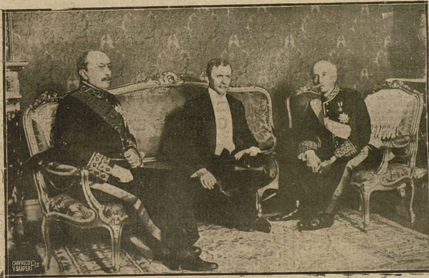
EL NUEVO EMBAJADOR DE ALEMANIA, BARON DE LOUGOBERTH VON SIMMER, CON EL PRESIDENTE DEL CONSEJO Y EL MINISTRO DE ESTADO, DURANTE LA VISITA OFICIAL QUE HIZO AL GOBIERNO.

NO SE DEVUELVEN LOS ORIGINALES GRAFICOS NADA MAS QUE EN EL CASO EN QUE PREVIAMENTE HAYAN SIDO ADQUIRIDOS CON ESA CONDICION.