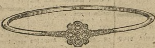
Núm. 2.—Pulsera 5 brillantes y diamantes. Pesetas 400.