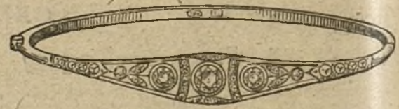
Núm. 6.—Pulsera 5 brillantes y diamantes. Pesetas 725.