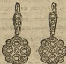
Núm. 2.—Pendientes 10 brillantes y diamantes. Pesetas 450.