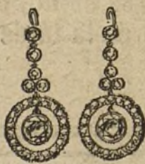
Núm. 5.—Pendientes 6 brillantes y diamantes. Pesetas 750.