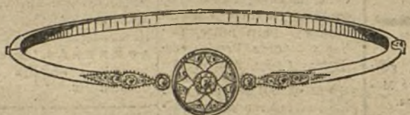
Núm. 1.—Pulsera 3 brillantes y diamantes. Pesetas 300.

MONTURAS DE PLATINO FINO Y ORO DE LEY 18 QUILATES CONTRASTADO