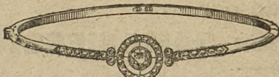
Núm. 5.—Pulsera 7 brillantes y diamantes. Pesetas 575.