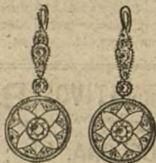
Núm. 1.—Pendientes 4 brillantes y diamantes. Pesetas 300.