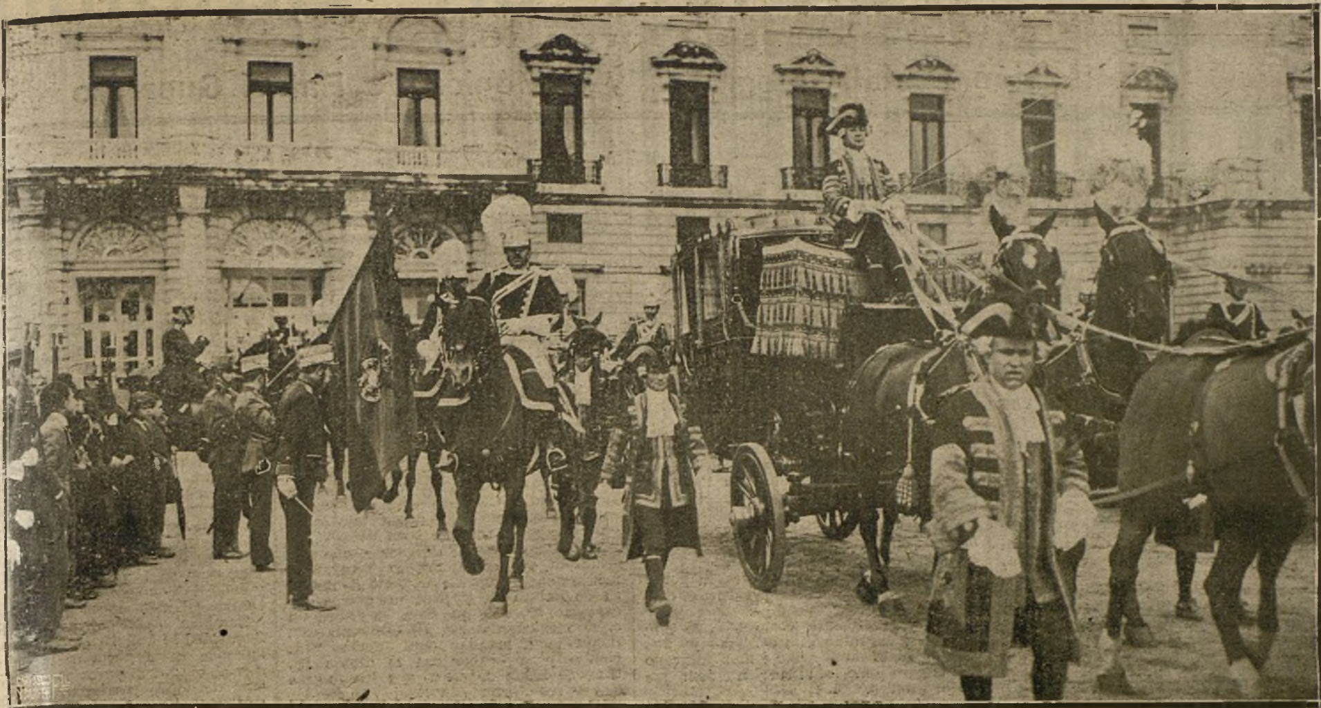
LA PRESENTACION DE CREDENCIALES DEL NUEVO EMBAJADOR DE ALEMANIA.—LA COMITIVA AL SALIR DE PALACIO.

del laborioso pintor madrileño; José María D'Hoy, que en un admirable temple, «Las sombras», afirma su prestigio de dibujante y su afición a escenas típicas del Madrid licencioso y pintoresco, de ese Madrid un poco de las crónicas picarescas del siglo pasado que se ha diluido en toda la literatura local; Muñoz Morillejo, también madrileño; Estefani, Seijo Rubio, Prádamas, Pelagín Martínez, Monasterio, López Serrano, López Cucalón, Galindo, Fernández Flórez, Domínguez, Bea Pelayo, Agudo y algunos otros cuyo recuerdo me es íntimo y que debían figurar en estas reseñas, más por estímulo de su obra futura que como recompensa de su obra actual.