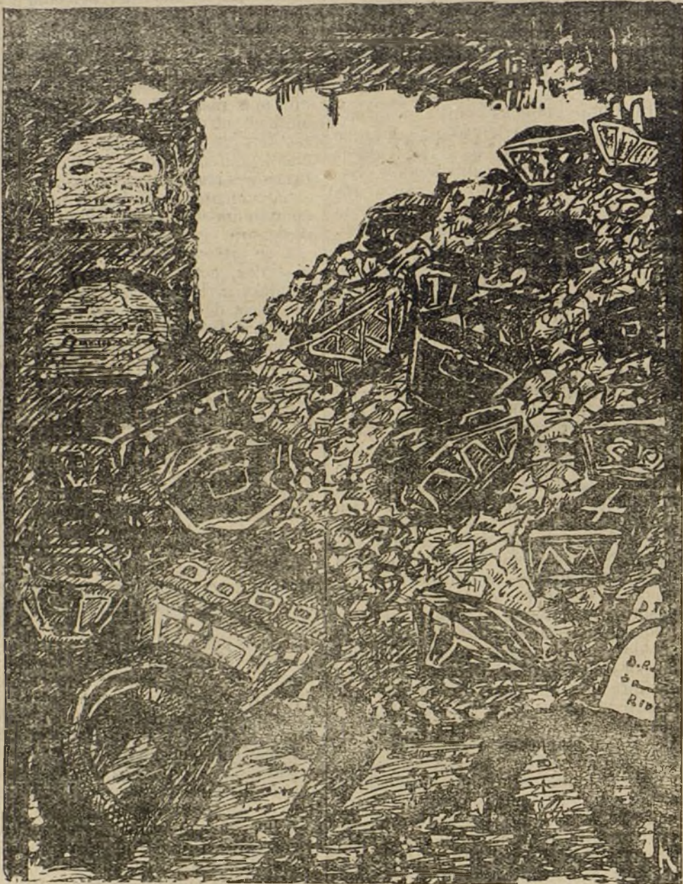
EL DRAMA DEL CEMENTERIO DE SAN MARTIN

He estado de nuevo en el bello cementerio de San Martín. Se han hundido más galerías, y se ve que acabarán por hundirse todas. Esperemos, que se nos darán a conocer todos los muertos que hoy se ocultan. Cada vez es un espectáculo más desgarrador y desdichado. El litigio entre aquellos que lo compraron para derribarlo y los que con muertos en sus galerías y sus patios se dispusieron a no dejarlos cumplir su propósito, continúa sin resolver. Hay guardesas por unos y por los otros, guardesas que no se saludan y que viven en distinto panteón, guardesas que vigilan con hostilidad al que entra.