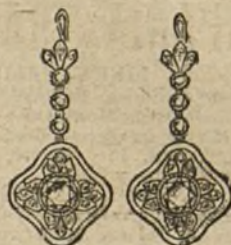
Núm. 4.—Pendientes 8 brillantes y diamantes. Pesetas 700.