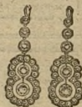
Núm. 3.—Pendientes 10 brillantes y diamantes. Pesetas 450.