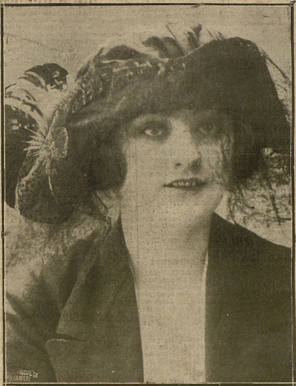
ORIGINAL VELO DE BLONDA, PARA SOMBRERO, SEGUN MODELO DE LA CASA LEWIS