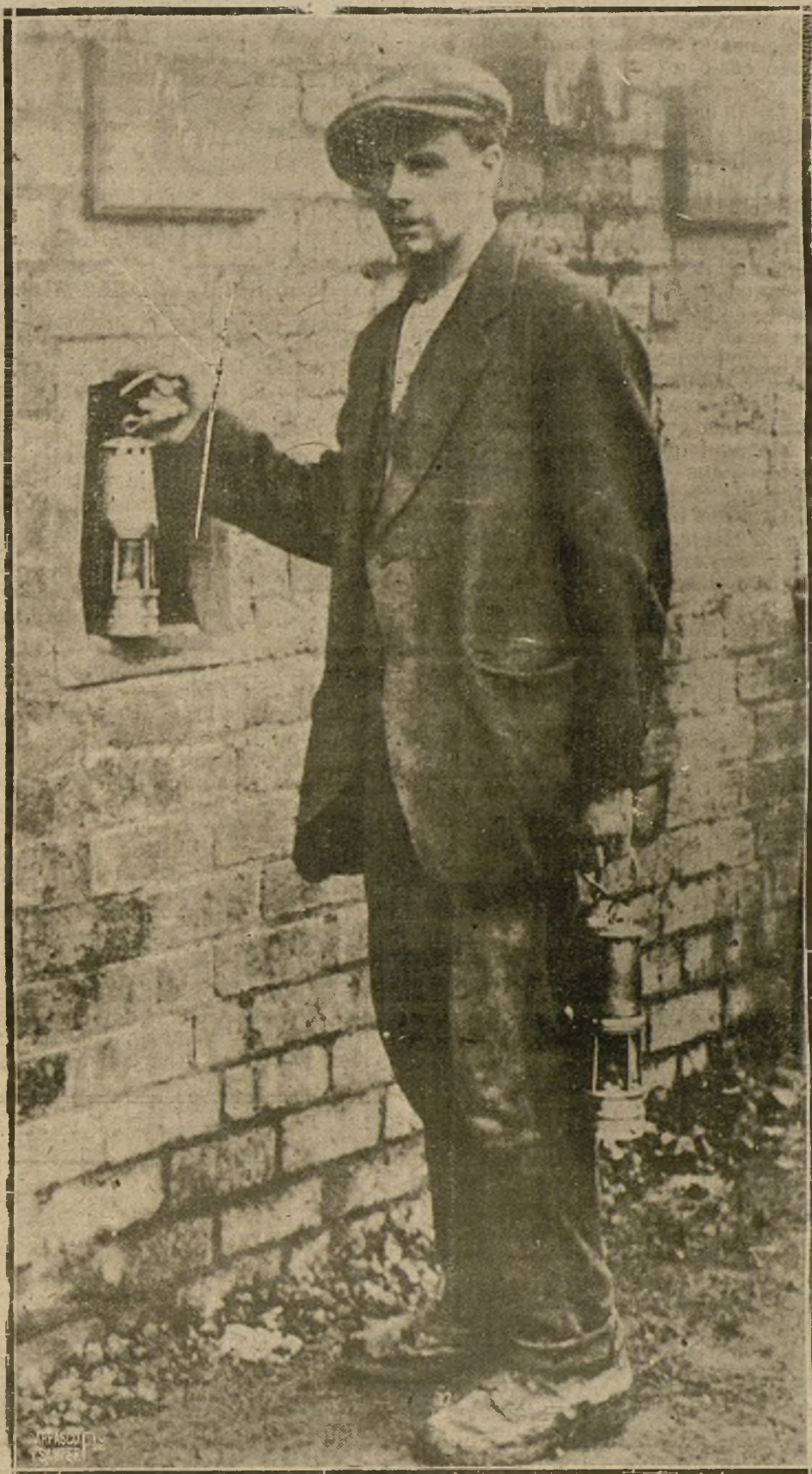
LA HUELGA DE MINEROS INGLESES.—UN OBRERO DE GALERIAS EN EL MOMENTO DE ABANDONAR EL TRABAJO.

No ignoramos que el señor Dato confía en que las futuras Cortes habrán de prestarle al Gobierno toda la necesaria robustez para hacer frente a esta pavorosa cuestión; pero eso no basta. No son conflictos éstos a los que se puedan dar plazos. Es preciso