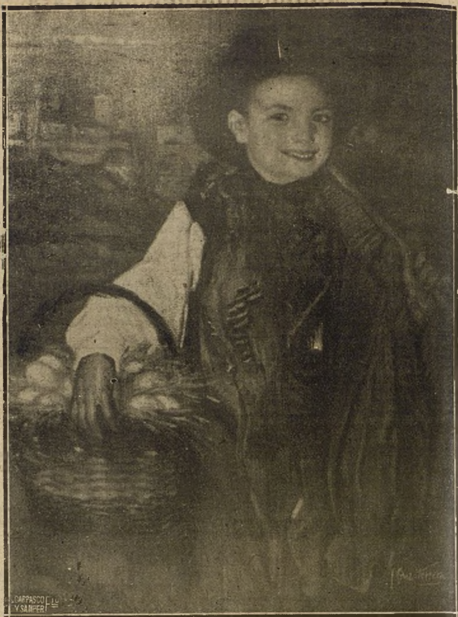
«EL GILDO», CUADRO DE CRUZ HERRERA QUE FIGURA EN LA EXPOSICION DE OTOÑO

Párrafo aparte merece también el belga León Londot, un pintor de técnica prodigiosa y sensibilidad excepcional. «Heure sombre» es uno de los cuadros de ambiente de este certamen mejor estudiado y al mismo tiempo uno de los que tienen más calidad de