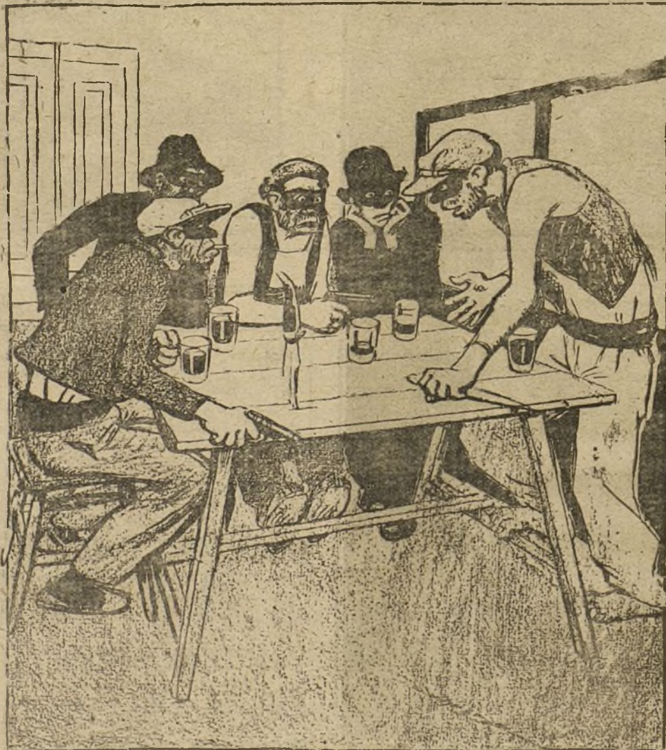
PARODIANDO EL TENORIO

LISBOA. Los ferroviarios de la Compañía portuguesa han acordado anudar el trabajo sin condiciones. Se han restablecido todos los servicios de Radio.