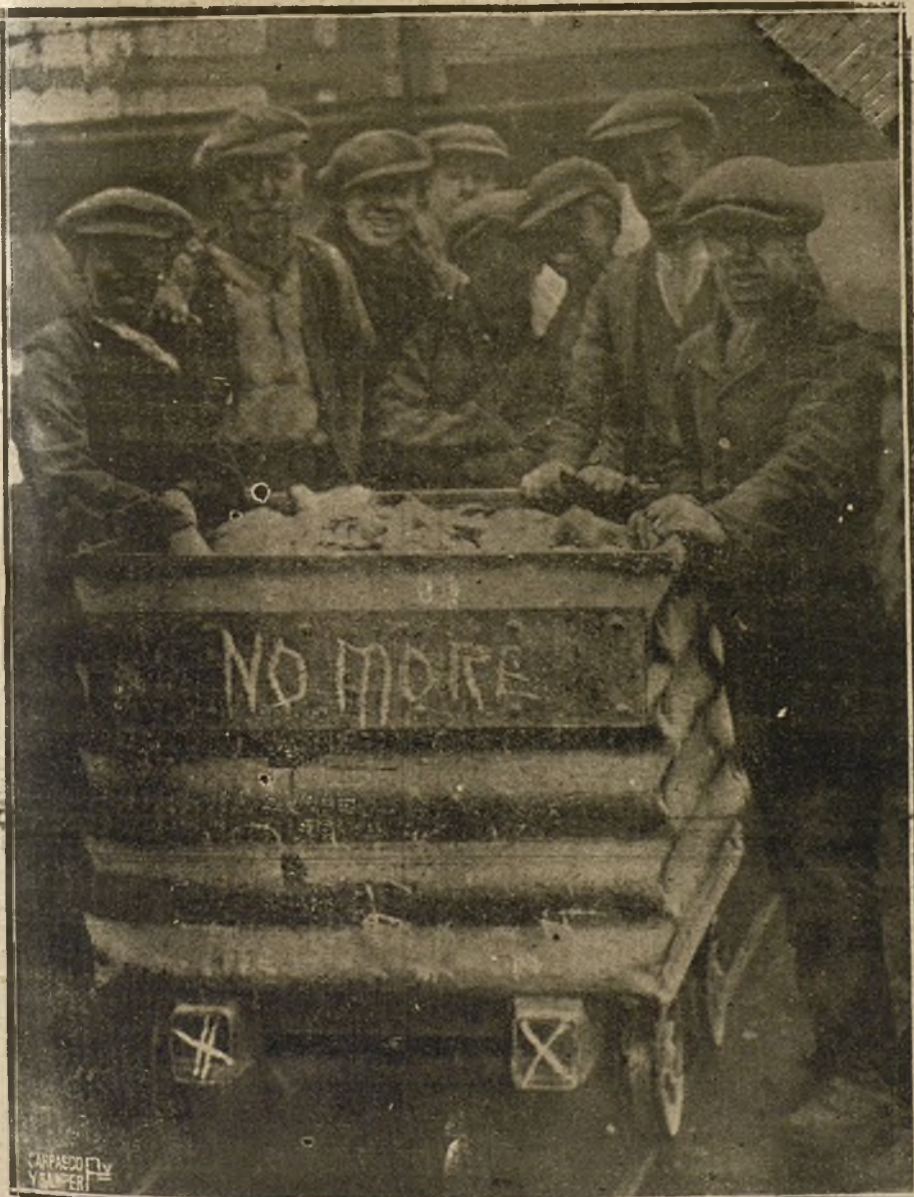
LA HUELGA DE MINEROS INGLESES.—OBREROS DEDICADOS AL TRANSPORTE DE CARBÓN, ANUNCIANDO EL COMIENZO DEL PARO.

empezar en seguida, rápidamente, sin esperar a que caigan acibilladas nuevas víctimas.