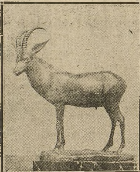
«UN ANTILOPE», ESCULTURA DE LUIS BENEDITO, QUE FIGURA EN LA EXPOSICIÓN DE OTOÑO

Al entrar en la sala grande de la Exposición detiene al visitante una cabeza descomunal de Virgen, erguida sobre un esqueleto de madera cubierto de follaje. Así dispuesta a la escayola en aquel andamio de palo, produce la impresión de un preparativo de cabalgata. Figurámonos que ya están dispuestos los caballos con sus arreos multicolores, sus gualdrapas bordeadas de madroños, sus cascos pintados de purpurina, para pasear la carroza por las calles y plazas de Madrid, seguida de un «clanderu» arrastrado también por caballos de coche fúnebre, con la comisión de festejos. Es una cabeza formidable, colosal, como la