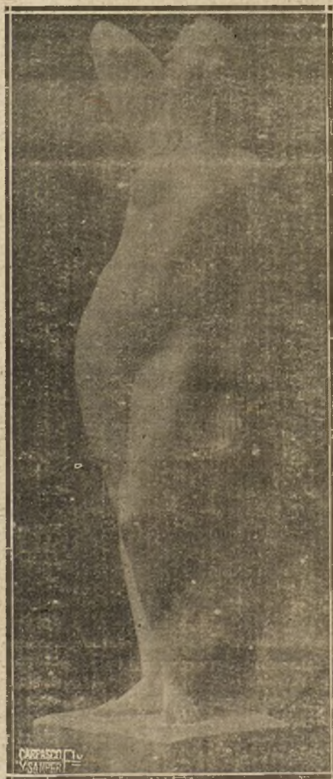
«DESNUDO», ESCULTURA DE MIGUEL DE LA CRUZ, QUE FIGURA EN LA EXPOSICIÓN DE OTOÑO

Dos esculturas, también pequeñas de tamaño y grandes de concepción, son «Terhura» y «Figurita», de José Clará. En las dos aparece bien observada la línea llena y amplia, de trazo arquitectónico, característica del insigne artista catalán.