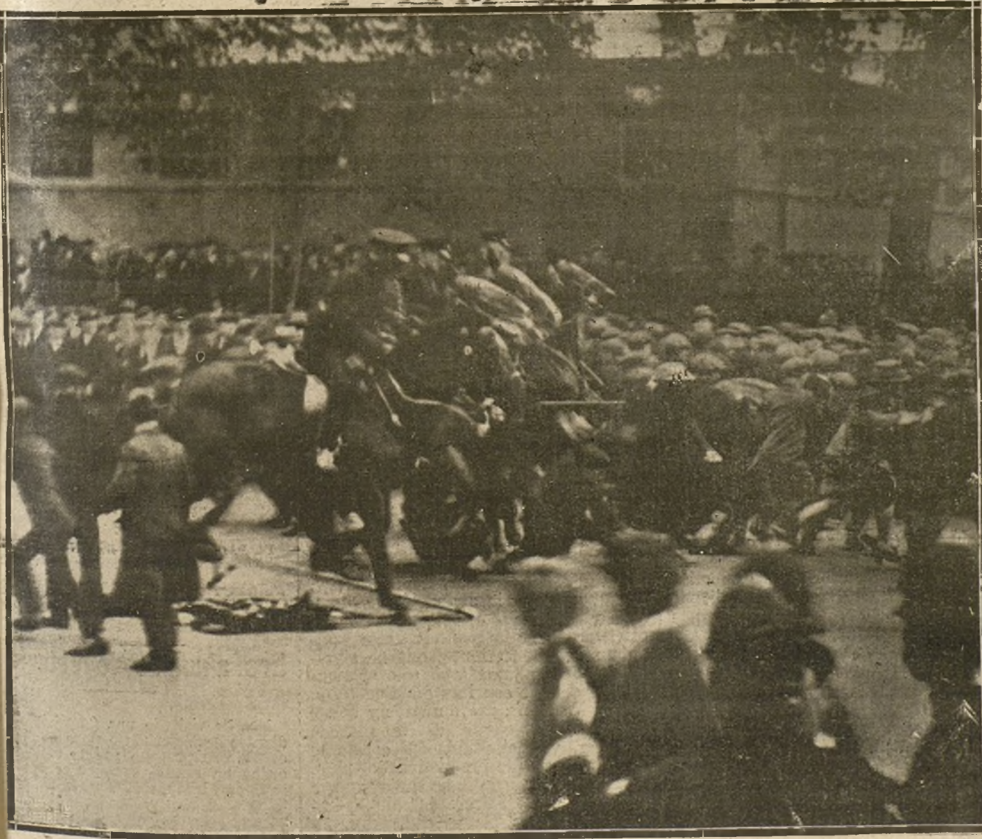
LOS SUCECOS DE IRLANDA.—UNA DE LAS CARGAS DADAS POR LA POLICIA CONTRA LOS REVOLUCIONARIOS, EN WHITEHALL. FOTOGRAFIA ILLUSTRATED

El significado cargo que tuvo el detenido de secretario del Centro de Estudios Sociales y la complicación que con este hecho tiene el presidente del Sindicato de metalúrgicos, hace sospe-