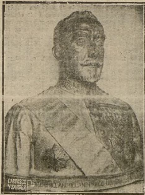
BUSTO EN BRONCE DEL EXCELENTISIMO DON MILLAN Y MILLAN DE PRIEGO, HOMENAJE DE GRATITUD QUE LE DEDICAN TODOS LOS FUNCIONARIOS DE GOBERNACION, OBRA DEL NOTABLE ESCULTOR DON JACINTO HIGUERA

Celita ha confirmado con esta co- rrida que tuvo un excelente debut, pues ha sido repetido seguidamente, a pesar de encontrarse ya en Méjico, los