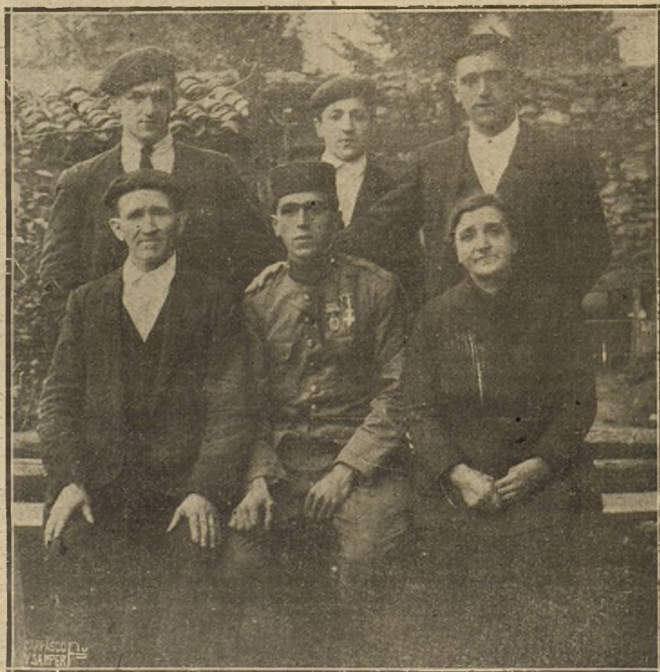
EL BIZARRO SOLDADO ALTUNA, CONOCIDO CON EL NOMBRE DEL HEROE DE XENAUEN, A SU LLEGADA AL PUEBLO DE TOLOSA, RODEADO DE TODA SU FAMILIA

Pero tan acertadas previsiones se han estrellado contra la indiferencia, la apatía, la abulia, la escasa preparación y la falta de solidaridad de los artistas españoles.