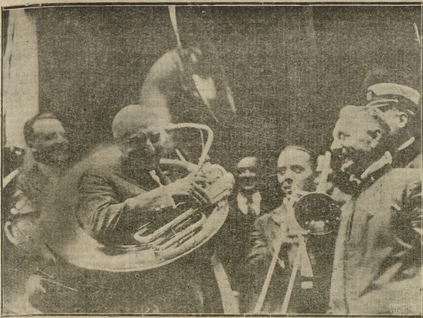
QUEBOSA FOTOTELEFIA PUBLICADA POR NOSOTROS NO HACE MUCHO, EN LA QUE APARECE EL PRESIDENTE DE LOS ESTADOS UNIDOS, MISTER HARDING, TOCANDO EL TROMBON AL FRENTE DE UNA PEQUEÑA BANDA DEL PUEBLO BLONDING CROWE, AFICION FREDILECTA DEL NUEVO JEFE DE ESTADO.

conformidad con lo expuesto por mister Smillie, la Conferencia votó una resolución por la que declara la terminación de la huelga, aconsejando a la vez a los obreros que reanuden el trabajo el jueves o cuanto antes sea posible.