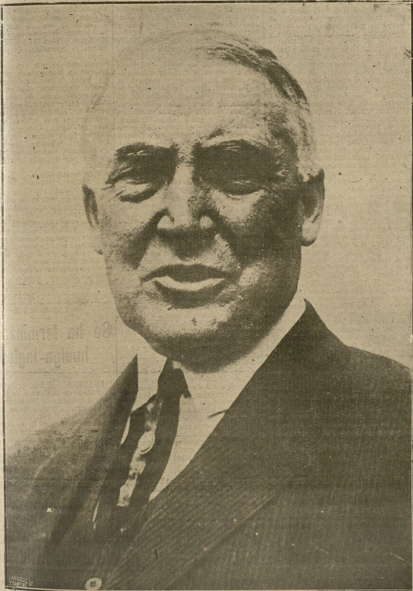
MISTER HARDING, QUE AYER RESULTO ELEGIDO PRESIDENTE DE LOS ESTADOS UNIDOS.

El Japón también tiene motivos de inquietud por el éxito republicano, cuyos hombres han preconizado leyes muy du-