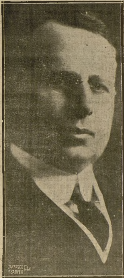
MISTER COX, CANDIDATO DEL PARTIDO DEMOCRATA, ASPIRANTE A LA PRESIDENCIA DE LOS ESTADOS UNIDOS, QUE HA SIDO DERROTADO EN LA LUCHA ELECTORAL

El telégrafo nos trae ya impresiones de los diversos países a quienes afecta más o menos la elección del nuevo Presidente de la gran República norteamericana.