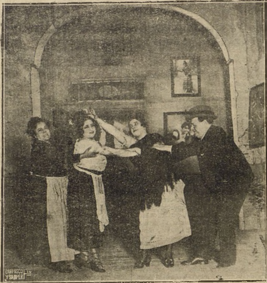
UNA ESCENA DEL SAINETE «LA DEL 2 DE MAYO», QUE SE ESTRENA ESTA NOCHE EN EL TEATRO DE APOLO.