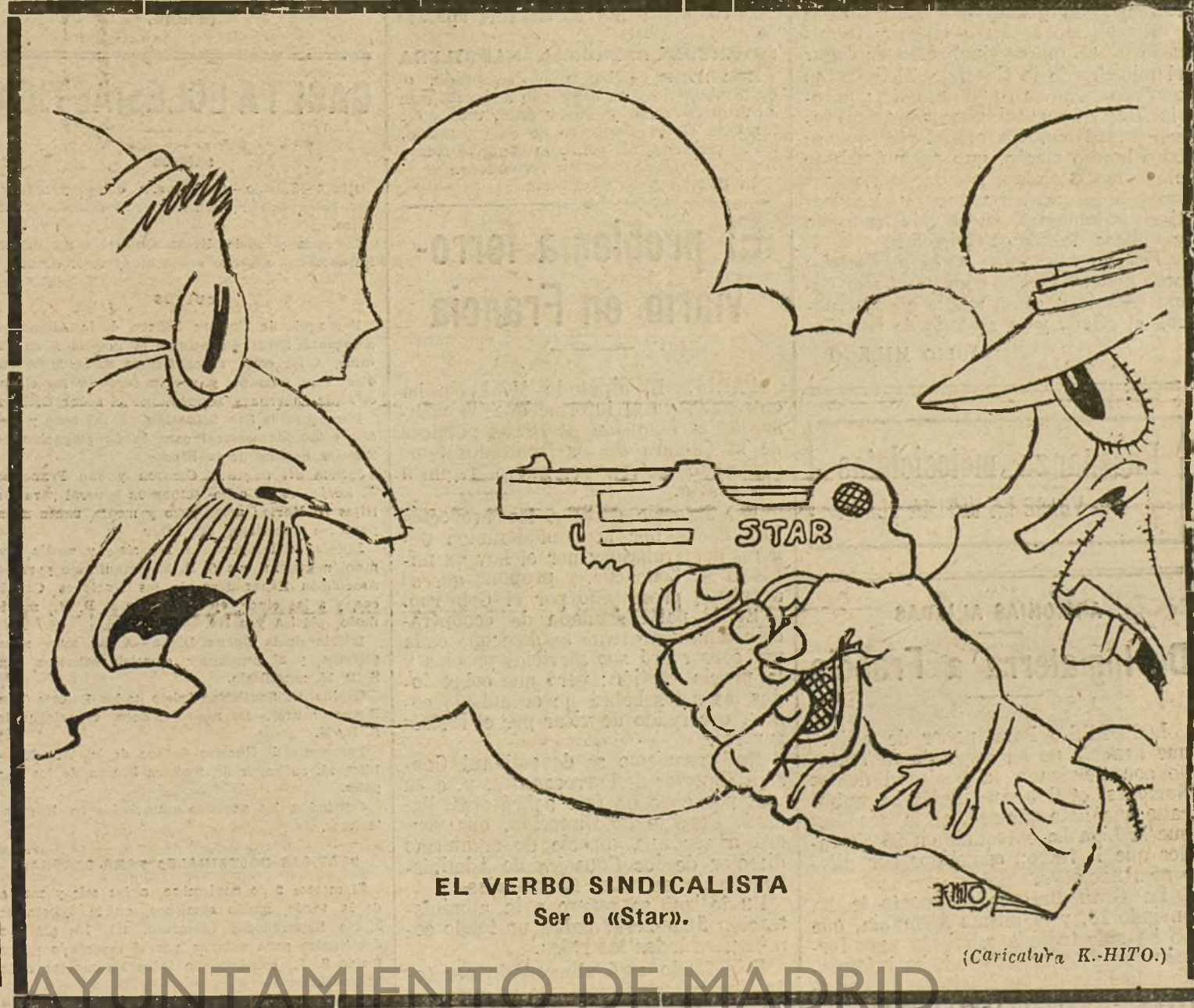
EL VERBO SINDICALISTA Ser o «Star».

«Ingenieros. — Varios camiones en servicio desde el año 10. Constantemente de cinco a siete en compostura. Ninguno de ellos es blindado, ni