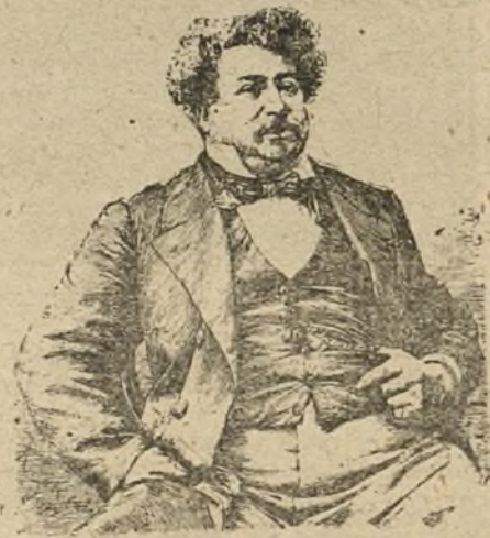
DESPUES DE HABERLA PROBADO, NO VACILO EN AUTORIZAR PUBLICAMENTE AL INVENTOR PARA DAR ESTA AGUA REGENERADORA EL NOMBRE DE «MONTE-CRISTO». ALEJANDRO DU MAS. (ANUNCIO DEL AÑO 85.)

la cual iban retrasados. Cada vez serán más una droga densa que envuelve en serpentina sutiles y en lazos invisibles la cabeza firme de los varones; cada vez tendrá más veneno, más opio, más coquinas indemoniables. Necesitan las mujeres más sonoras bocinas de su belleza, más renovadoras incitaciones, más originales aureolas de su figura.