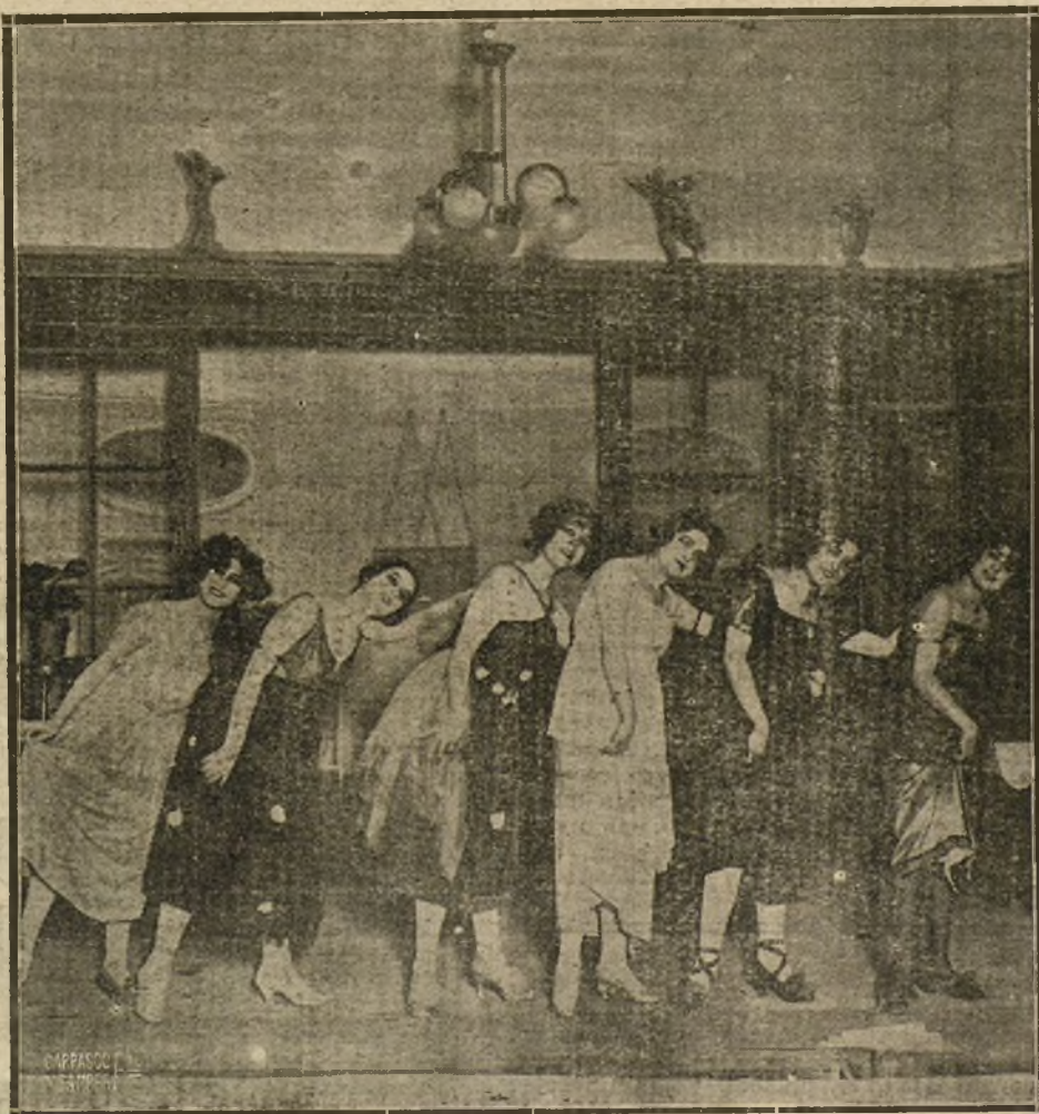
UNA ESCENA DE «MI SOBRINO FERNANDO», OBRA ESTRENADA EN EL TEATRO COMICO.

Descansa en paz el veterano periodista y bizarro jefe.