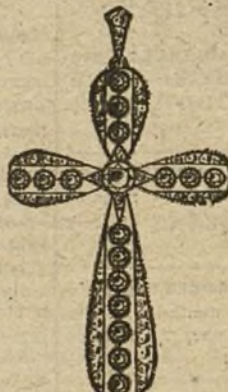
Núm. 7.—17 brillantes y diamantes. Ptas. 650.