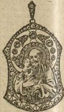
Núm. 8.—7 brillantes y diamantes. Ptas. 550.