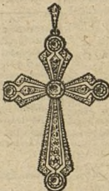
Núm. 6.—5 brillantes y diamantes. Ptas. 575.