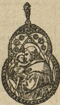
Núm. 5.—6 brillantes y diamantes. Ptas. 450.