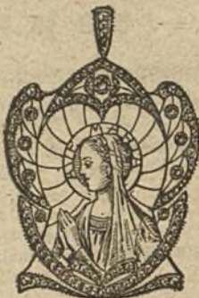
Núm. 2.—9 brillantes y diamantes. Ptas. 425.