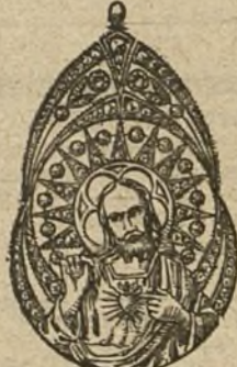
Núm. 3.—16 brillantes y diamantes. Ptas. 475.