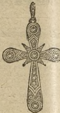
Núm. 4.—5 brillantes y diamantes. Ptas. 375.