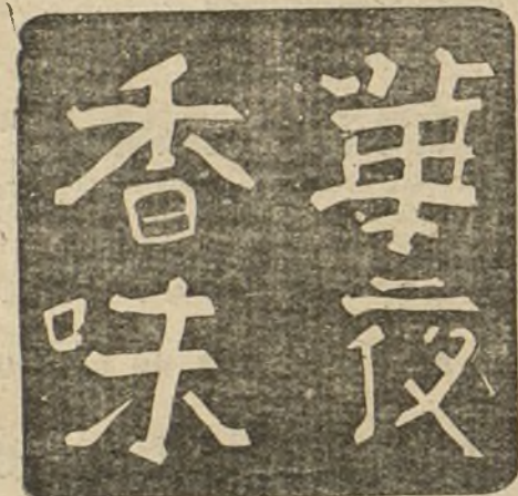
TRADUCID. NOCHE DE CHINA (PERFUME AGRADABLE)

Los anuncios de los perfumes aspiran a perpetuar la delicadeza del perfume. Los artistas se ponen elegantísimos haciendo esos dibujos de encargo. ¿Se le