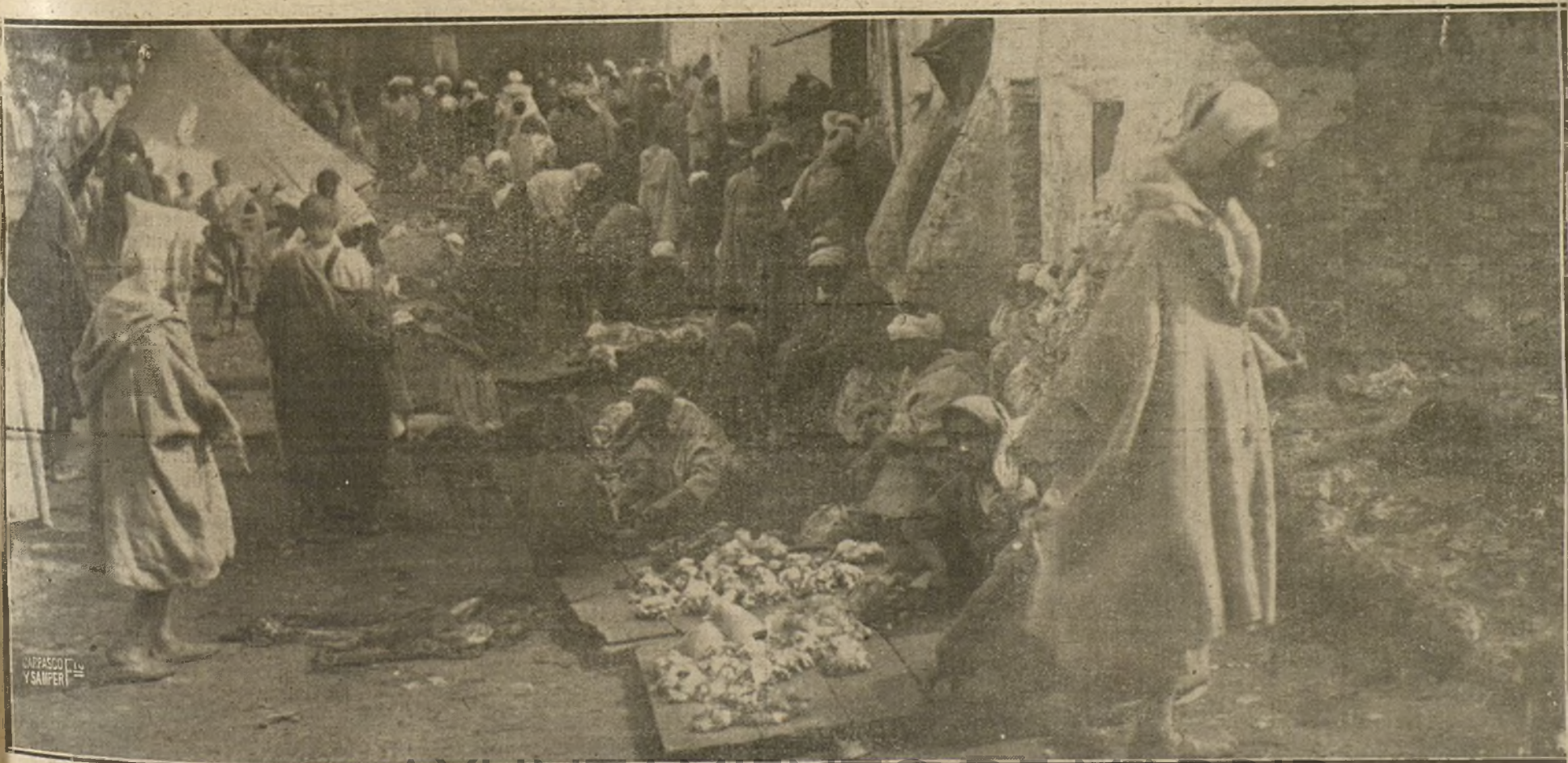
AYUNTAMIENTO DE MADRID UNA CALLE DE XEXAUEN.—TÍPICOS PUESTOS DE CARNE EN UN DÍA DE ZOCO. (FOT. CALATAYUD COSTA.)