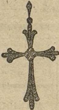
Núm. 1.—4 brillantes y diamantes. Ptas. 300.

MONTURAS DE PLATINO Y ORO DE LEY 18 QUILATES CONTRASTADO