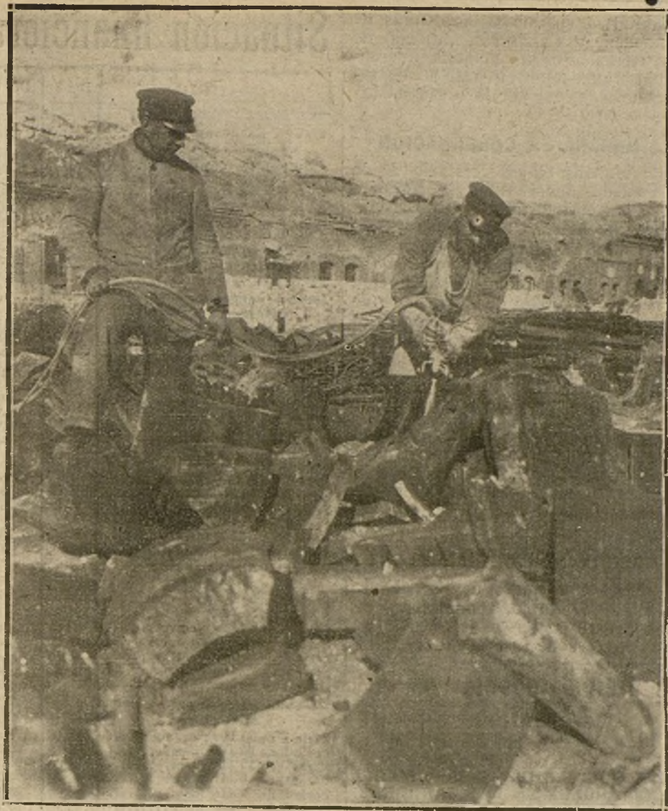
EL CUMPLIMIENTO DEL TRATADO DE VERSALLES.—OBREROS ALEMANES DESTRUYENDO LAS FORTIFICACIONES DE KIEL. (PHOTOTHER.)

Al gremio de fabricantes de pan han sido notificadas órdenes para que no fa- briquen ni un solo panecillo candela con harina de tasa, y como los fabricantes de pan no pueden pagar a 105 pesetas el saco de harina libre para vender panecillos a 10 céntimos, sólo se limitan a cumplir las órdenes recibidas de los señores tenien- tes de alcalde, fabricando kilos y medios kilos con la harina de tasa, pero queremos ha- cer constar que tenemos un perfecto dere- cho a que se nos dé a precio de tasa la harina para los panecillos de candela, pues es la recompensa convenida para que el kilo y medio kilo de pan sólo se ven- diera cuatro céntimos más que el kilo de harina, pues de no ser así el kilo de pan no se podría vender con el margen de cuatro céntimos, sino de 10; así es que, al reducirse las «colas», busquemos las responsabilidades en los señores tenien-