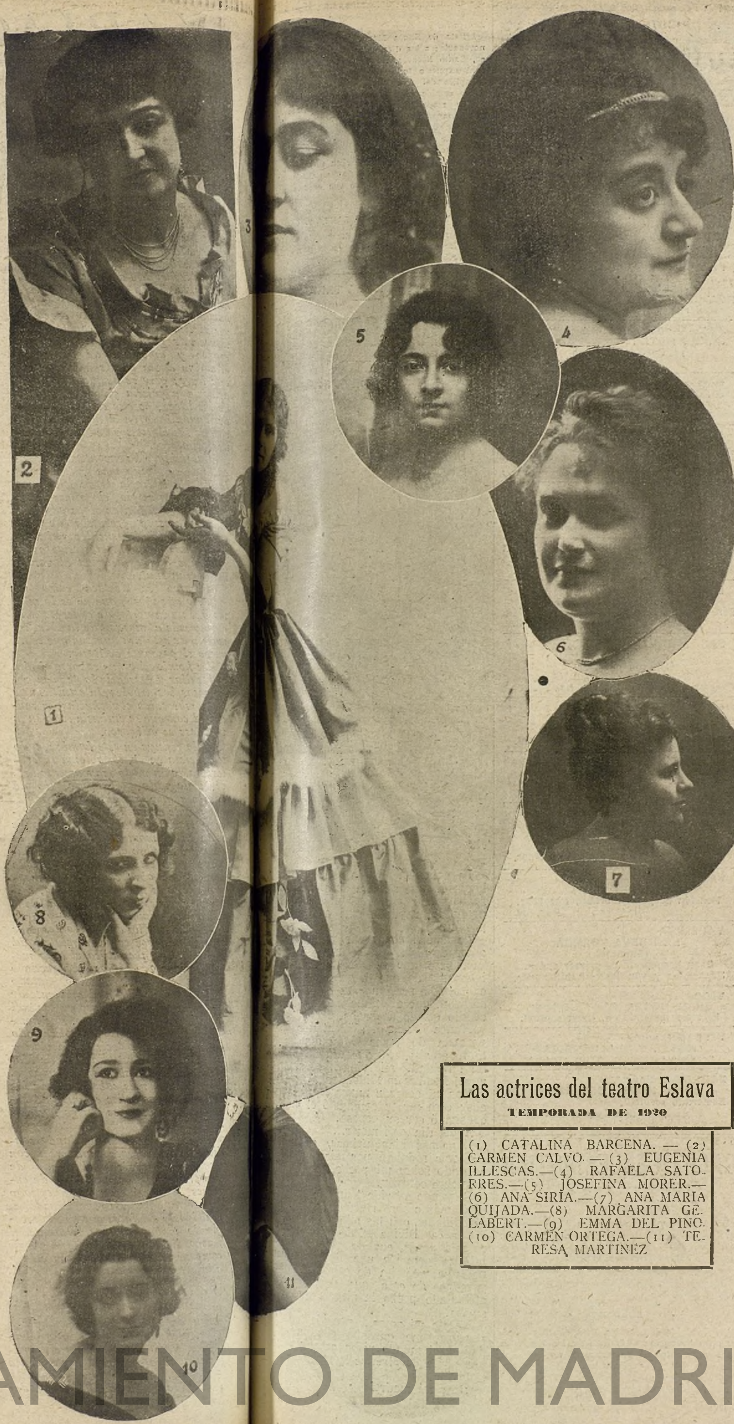
Las actrices del teatro Eslava TEMPORADA DE 1920