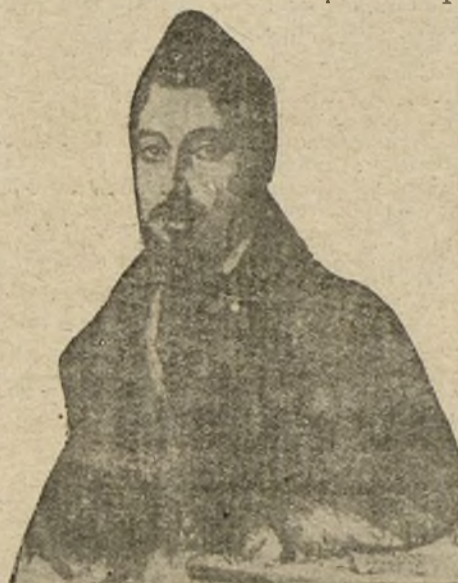
«FIGARO» SEGUN UNO DE SUS RETRATOS MAS AUTENTICOS QUE EXHUMA «COLOMBINE»

El Prado tenía esa indiferencia y esa serenidad de siempre, que da un poco de melancolía y de dulce y agradecido despecho al que pasa por él. Se veía que media de tal manera mis palabras que