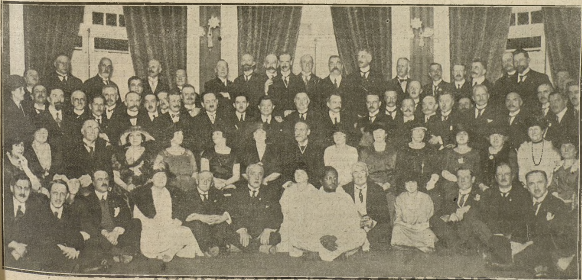
GRUPO DE DELEGADOS DEL CONGRESO POSTAL, QUE CONCURRIERON AL TE OFRECIDO AYER TARDE EN EL PALACE HOTEL POR LA DELEGACION INGLESA.