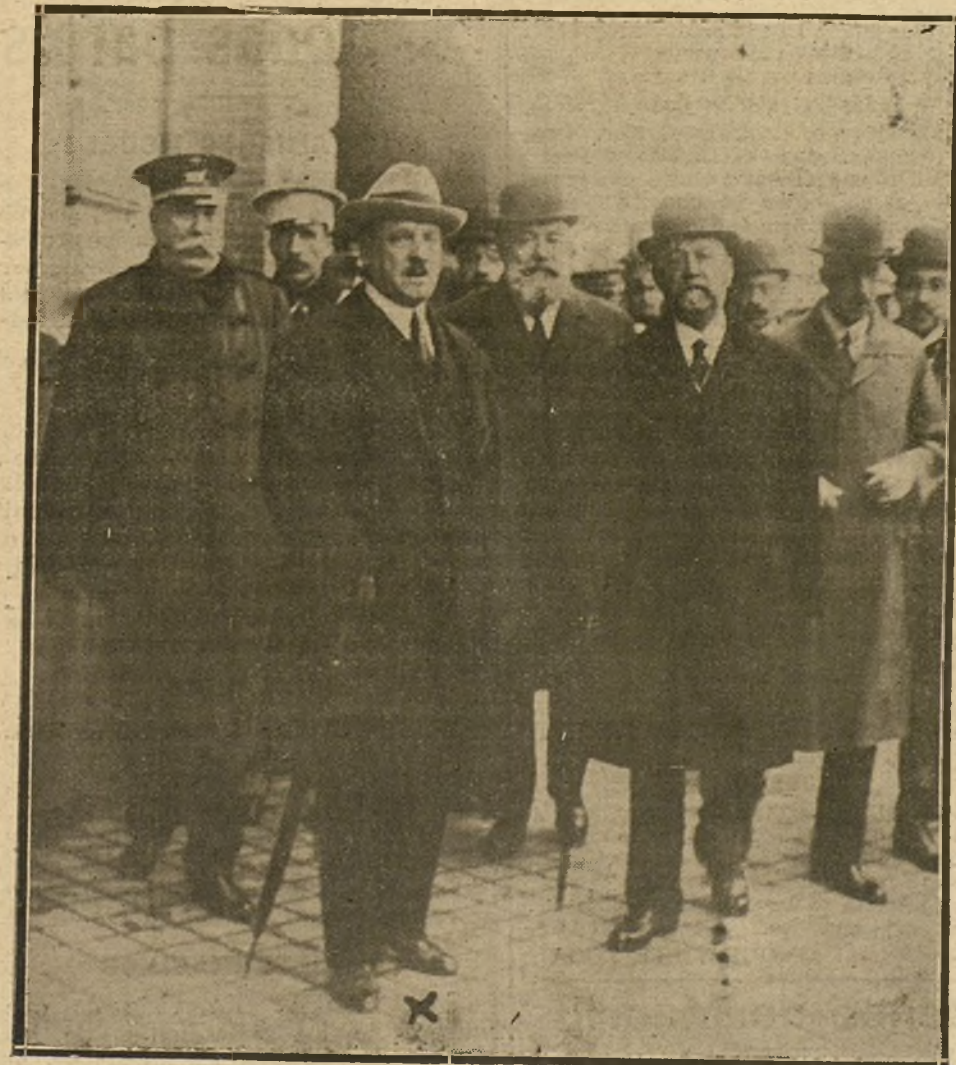
EL NUEVO GOBERNADOR DE BARCELONA, GENERAL MARTINEZ ANIDO (X), ACOMPAÑADO DEL MINISTRO DE LA GOBERNACION, CONDE DE BUGALLAL, A SU LLEGADA A MADRID ESTÁ MAÑANA

Sexto. Este régimen puede prorrogarse mientras las circunstancias que lo justifican duren.»