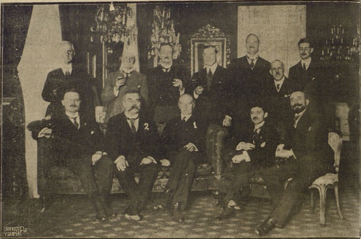
EL EMBAJADOR DE INGLATERRA (1) CON EL SECRETARIO GENERAL DE LA UNION POSTAL, M. DECOPPET (2), DESPUES DEL BANQUETE CON QUE ESTE ULTIMO FUE OBSEQUIADO EN LA EMBAJADA INGLESA.

Asimismo se anuncia para mañana la boda de la bellísima señorita Myriam Mon-