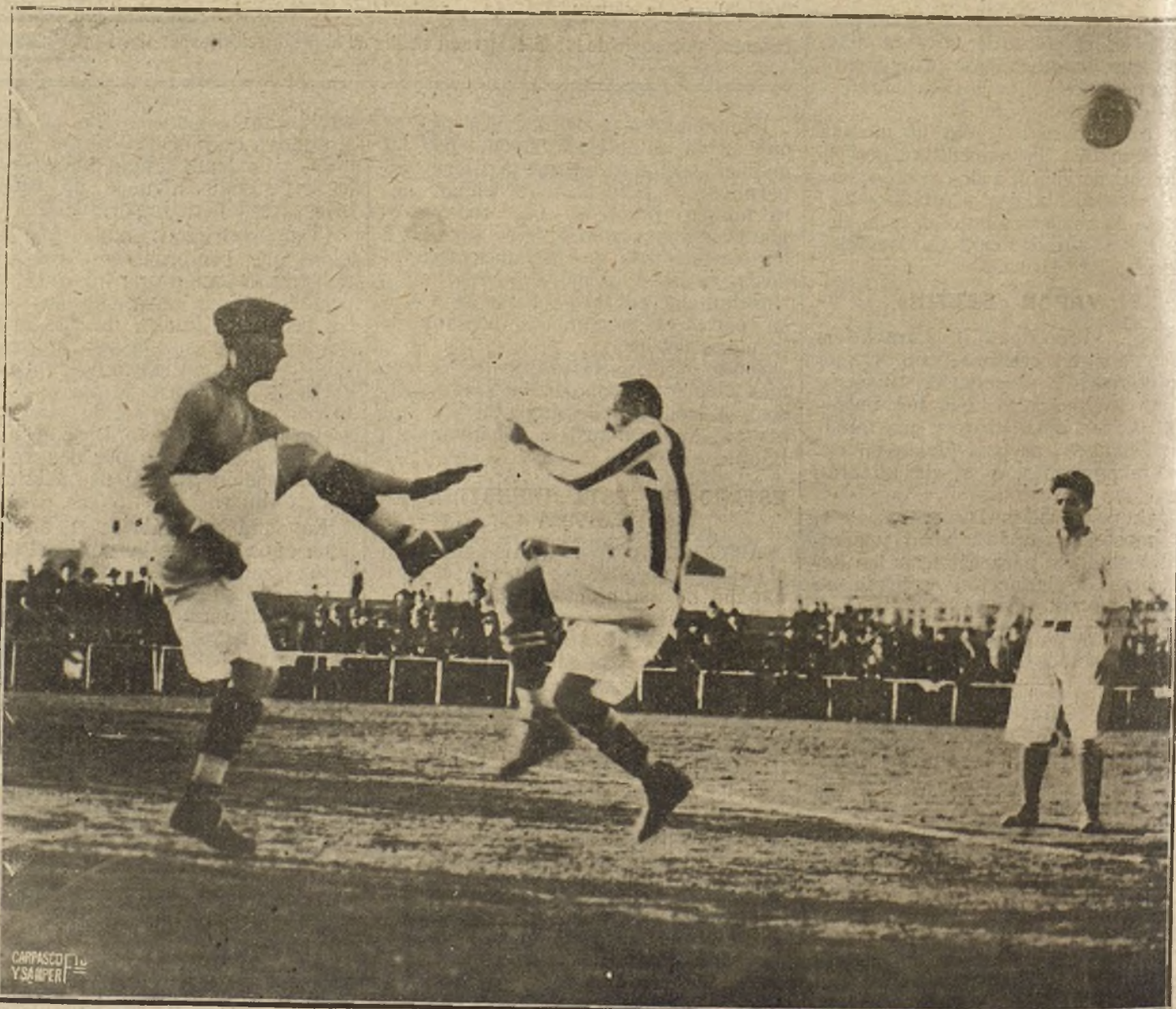
LOS DEPORTES EN SEVILLA.—UN MOMENTO INTERESANTÍSIMO DEL PARTIDO DE "FOOT-BALL" JUGADO ENTRE LOS EQUIPOS RIVALES "SEVILLA" Y "REAL BETIS BAJO MARIE" Y EN EL QUE GANÓ EL PRIMERO POR CUATRO "GOALS".

La portería grecorromana es algo pretencioso, vivienda para unos arrivistas, y queda en el portal como un pabellón de otra época, como los restos de alguna gran casa del mismo estilo.