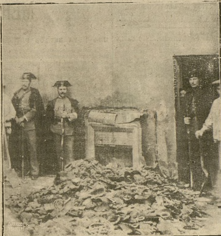
UN FORMIDABLE INCENDIO EN GUADALAJARA.—UN ASPECTO DEL ESTADO EN QUE QUEDA EL PALACIO DEL MARQUES DE VILLAMEJOR, HABITADO EN LA ACTUALIDAD POR LOS DUQUES DEL INFANTADO. EN LA FOTOGRAFIA SE VE LA CHIMENEA POR DONDE EMPEZO EL INCENDIO.

Por eso se esperaba que la campaña emprendida ahora contra el Gobierno había de tomar caracteres imponentes, y que el señor Dato, ante los discursos amenazadores del señor La Cierva, dimitiría sin hacer las elecciones. Así lo creyó incluso el mismo señor La Cierva cuando se abrevió a retirar al Gobierno en Valencia. Pero el tiempo pasa, y nada de cuanto se venía vaticinando ha ocurrido, y en cambio el telégrafo nos trae noticias de las