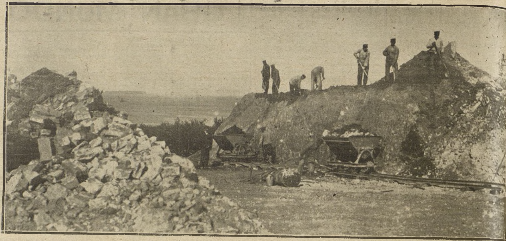
EL CUMPLIMIENTO DEL TRATADO DE VERSALLES.—OBREROS ALEMANES DEMOLIENDO EL FAMOSO FUERTE DE KÖRÜNGEN, UNO DE LOS MÁS IMPORTANTES DE LAS FORTIFICACIONES DE KIEL.