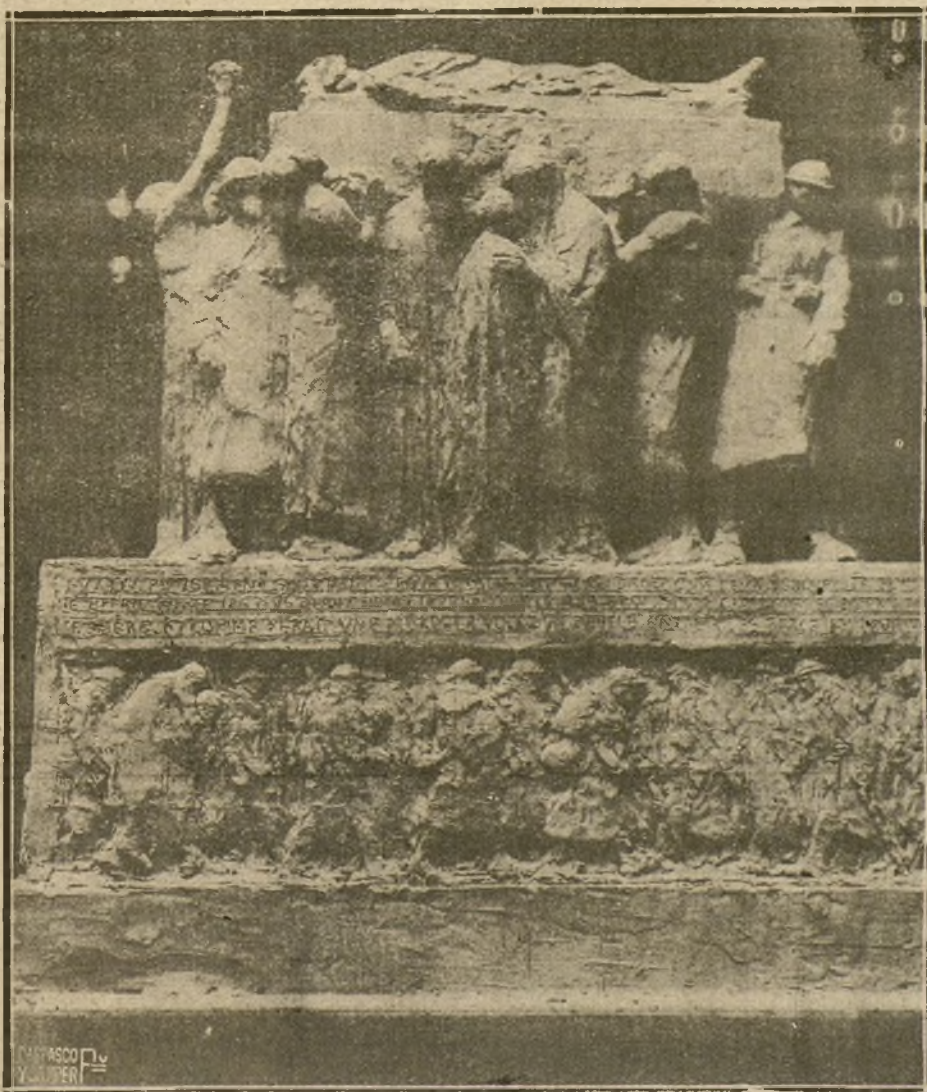
LA TUMBA DEL SOLDADO.—PROYECTO DE MONUMENTO A LAS VÍCTIMAS DE LA GUERRA, ERIGIDO EN HOMENAJE AL SOLDADO DESCONOCIDO. OBRA DEL ESCULTOR PAUL LANDOWSKI