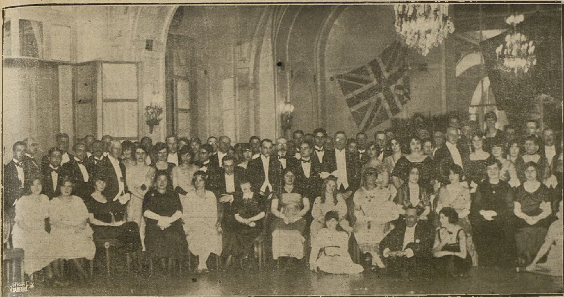
GRUPO DE PERSONALIDADES INGLESAS EN EL RITZ, DONDE CELEBRARON UNA INTERESANTE FIESTA CON MOTIVO DEL SEGUNDO ANIVERSARIO DE LA FIRMA DEL ARMISTICIO.