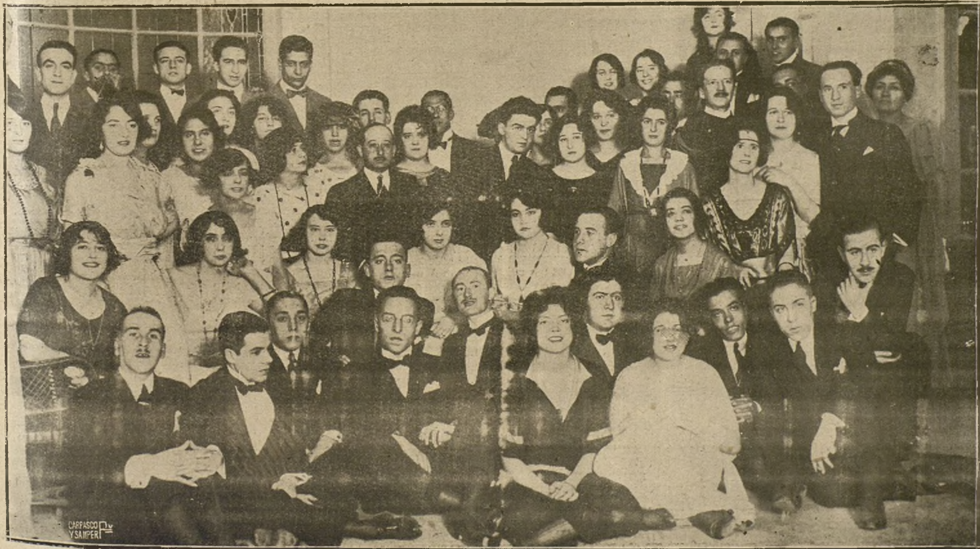
GRUPO DE PERSONALIDADES FRANCESAS CONCURRENTES AL BANQUETE CELEBRADO AYER NOCHE EN EL PALACE HOTEL PARA FESTEJAR EL SEGUNDO ANIVERSARIO DE LA FIRMA DEL ARMISTICIO.

De conformidad a lo dispuesto en la Real orden de 1 de mayo de 1920 y la dictada en 21 de septiembre del mismo año para ejecución de la anterior, esta Facultad abre un concurso para pensionar al alumno o alumnos que hayan cursado los