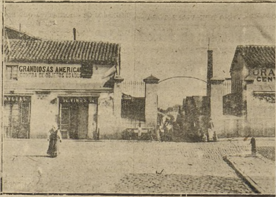
LA PUERTA DE LAS GRANDIOSAS AMERICAS, QUE DESAPARECERAN DENTRO DE BREVE TIEMPO.

Se sienten estos días en el Rastro, que estas alfombras y estas esteras han estado mucho tiempo en los sótanos húmedos.