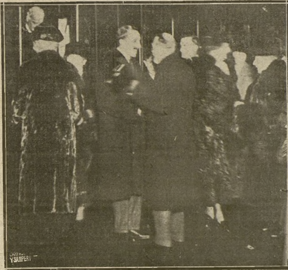
LEGADA DE SS. MM. LOS REYES DE ESPAÑA A LONDRES, DON ALFONSO Y DONA VICTORIA SON RECIBIDOS EN LA ESTACION POR SS. MM. LOS REYES DE INGLATERRA.

Tienen responsabilidad los Poderes públicos, porque siempre hurtaron al conocimiento del país la entera verdad