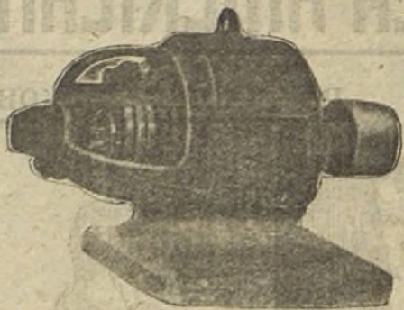
Motores para corriente trifásica.

Representante de la "Electricidad", S. A. Sabadell