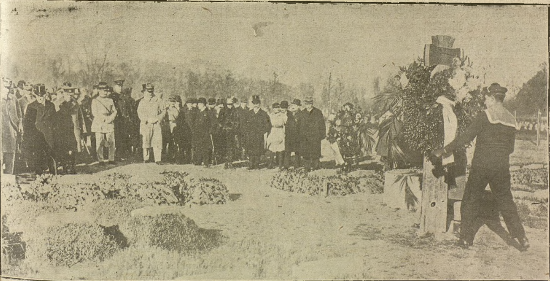
HOMENAJE A LAS VICTIMAS DE LA GUERRA EN BERLIN. EL NUEVO EMBAJADOR DE FRANCIA VISITANDO LAS TUMBAS DE LOS PRISIONEROS FRANCESES MUERTOS DURANTE SU CAUTIVERIO EN ALEMANIA.

LA TAREA DE DEVOLVER TODOS LOS ORIGINALES QUE NO PUBLICAMOS SERIA ABURRADORA, Y PARA EVITARLA, COMO PARA PREVENIR REGLAMACIONES, QUE RESULTARIA IMPOSIBLE ATENDER, RECORDAMOS QUE NO SE DEVUELVEN LOS ORIGINALES.