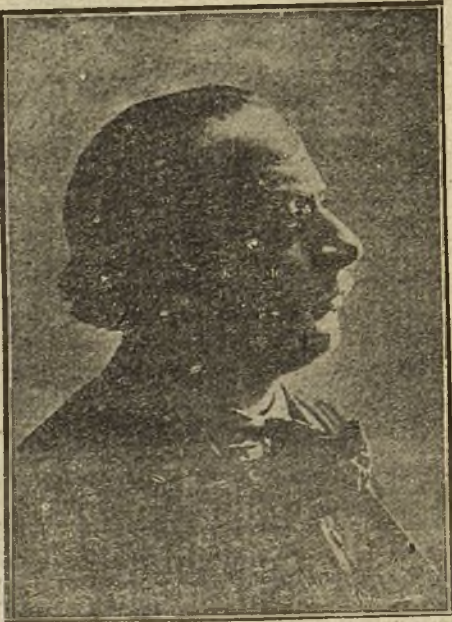
CONTRALUZ DE EUGENIO NOEL