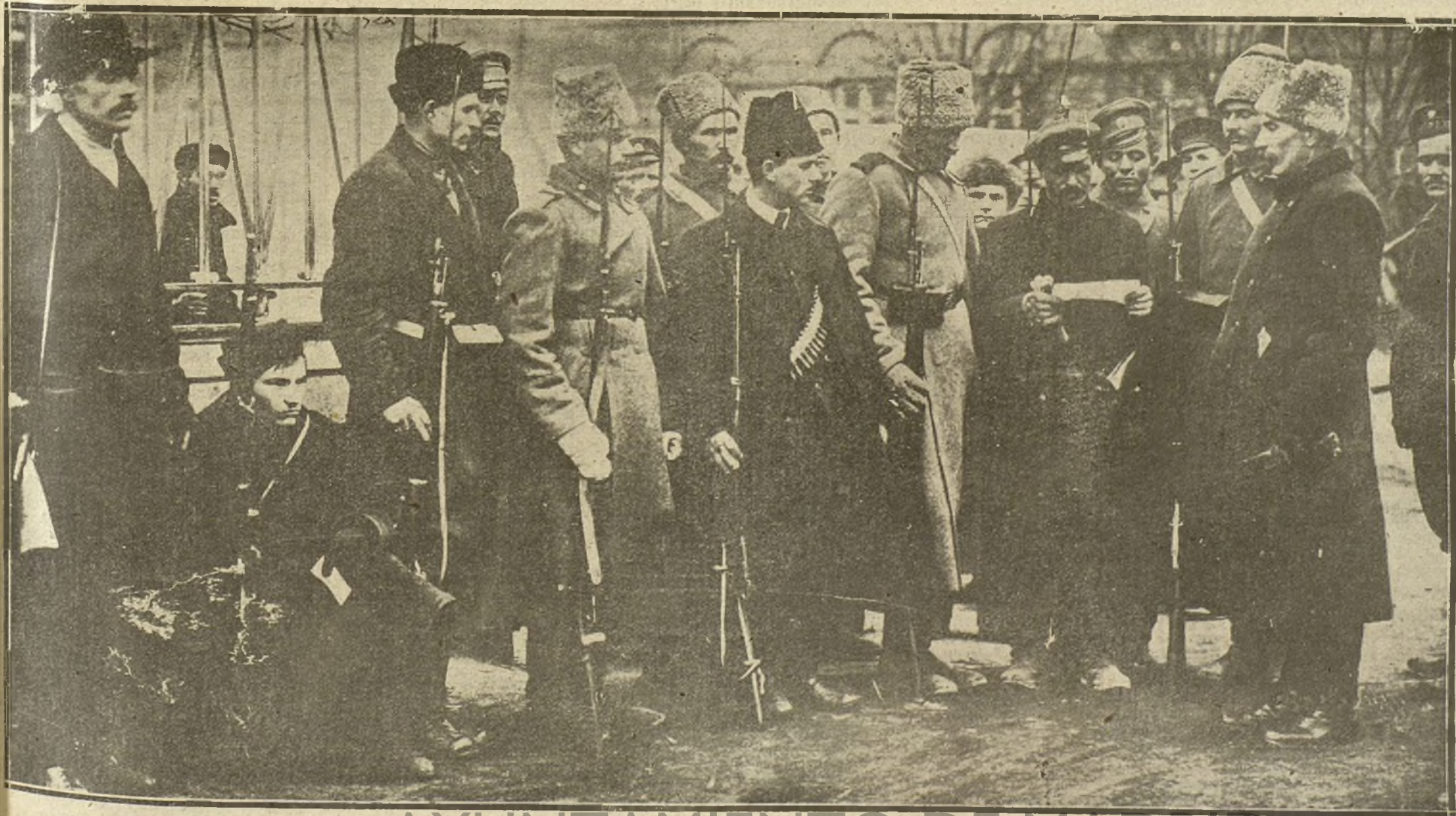
LOS BOLCHEVIQUES RUSOS.—TIPOS DE SOLDADOS DEL EJERCITO ROJO ESCUCHANDO LA LECTURA DE UNA ORDEN MILITAR.

En Cercadilla y la Central se han cometido dos nuevos asaltos de trenes de mercancías por varios individuos, que arrojaron a la vía gran número de bultos y se dieron luego a la fuga.