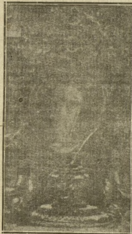
EL CORAZÓN DE SANTA TERESA DE JESUS

Algo se arranca al cadáver de sus ilusiones, de sus cábalas, de las cosas que en las mismas cenizas se organizan