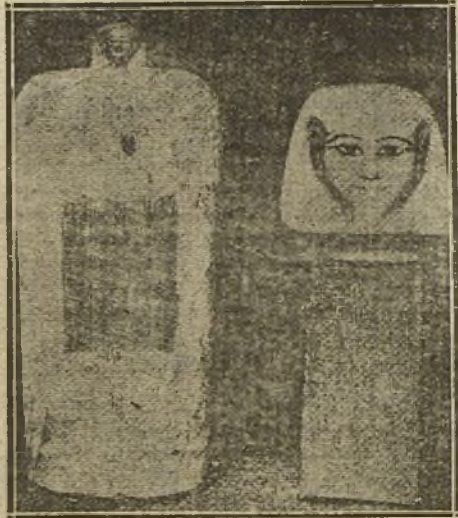
VASOS CANÓPICOS, DONDE LOS EGIPCOS CONSERVABAN EL CORAZÓN DE LOS DIFUNTOS

Los cristianos sólo con sus grandes hombres han hecho esa excepción, y por eso, entre otros corazones, se conservan el de Carlos de Anjón, en Angers; el