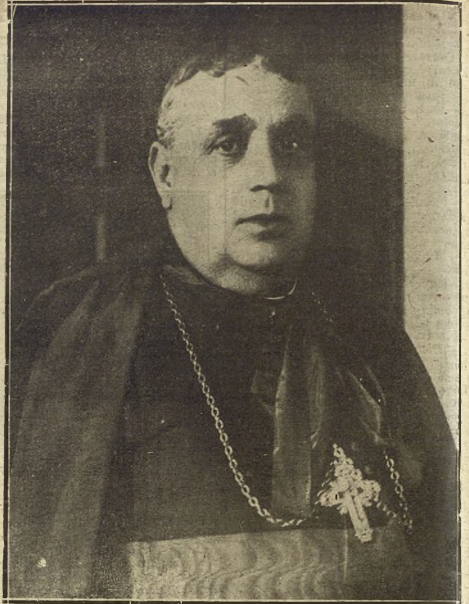
EL CARDENAL DON ENRIQUE ALMARAZ Y SANTOS, QUE HA SIDO DESIGNADO PARA PAR LA SILLA PRIMADA DE ESPAÑA

El Gobierno teme a cada hora la votación de una moción de desconfianza, a consecuencia de los escándalos averiguados en el transcurso de la discusión de los ya famosos contratos de adquisición de importantes partidas de