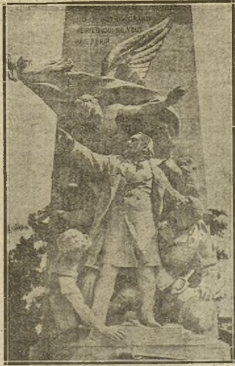
ESTATUA DE GAMBETTA

Muchas más son las historias de corazones célebres, como el de San Luis, al que cuando murió en Túnez se le sacó el corazón y fué hervido en agua y vino al fin de conservado, y como los de los Habsburgos, que desde el siglo XIII son conservados junto a sus cadáveres en vasos de cristal montados en oro, y como aquellos corazones que se supone, el de Napoleón I, comido