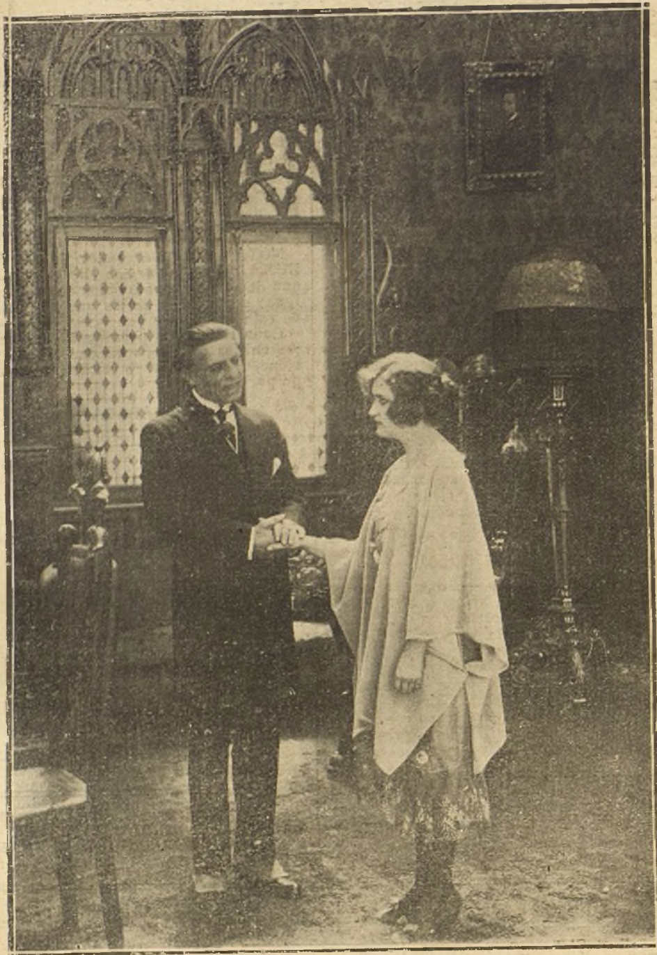
La señorita Del Río y el señor Viñas en una escena de la «filme» EXPIACION , primera película de la casa española ATLANTIDA. A juzgar por la adjunta muestra, no está lejos el día en que la producción nacional ocupe un puesto de honor en las pantallas.