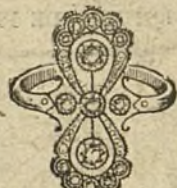
Núm. 13.—5 brillantes y diamantes. Ptas. 400.