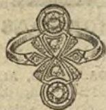
Núm. 5.—2 brillantes y diamantes. Ptas. 240.