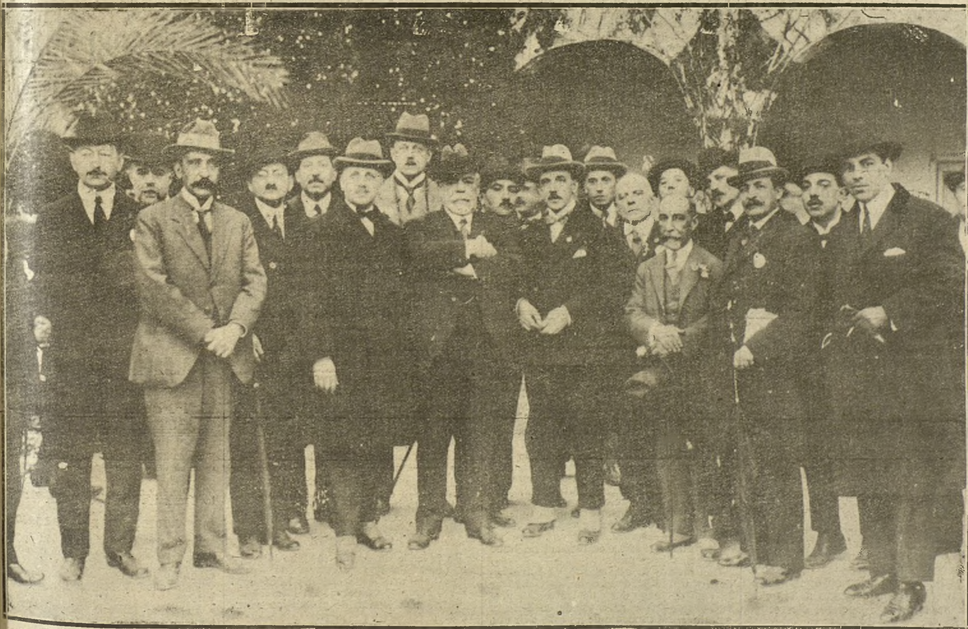
LOS DELEGADOS DEL CONGRESO POSTAL EN ANCALUCIA. ARRIBA: LOS CONGRESISTAS VISITANDO LA MEZQUITA DE CORDOBA. EL DELEGADO DE ETIOPIA EN UN ANGULO DEL PATIO DE LOS LEONES DE LA ALHAMBRA. DE GRANADA. DEBAJO: LOS DELEGADOS AMERICANOS EN LA FINCA "RUZAFAL" DE LOS SEÑORES CARBONELL, EN CORDOBA.