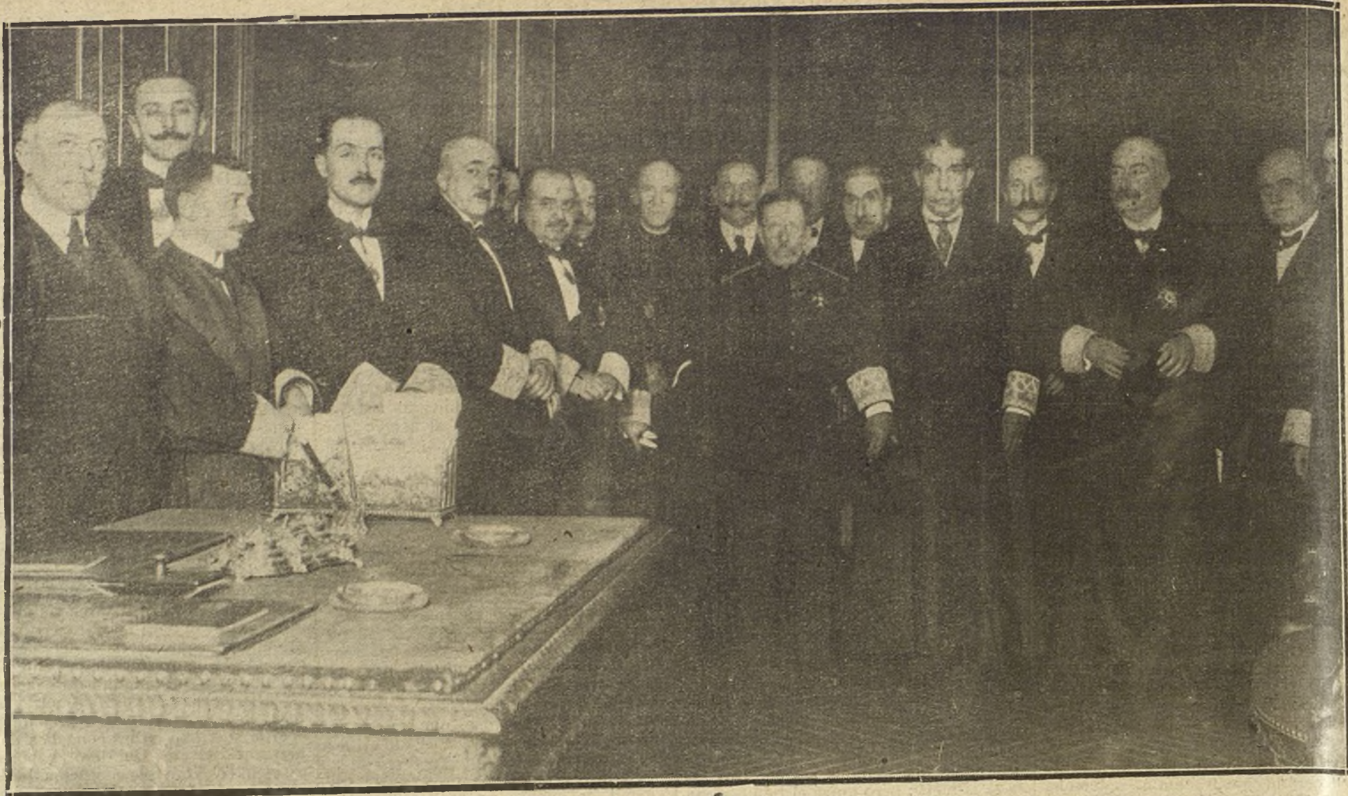
EL ILUSTRE EX MINISTRO DON FRANCISCO BERGAMÍN, AL TERMINAR SU NOTABLE DISCURSO DE APERTURA DEL CURSO DE LA REAL ACADEMIA DE JURISPRUDENCIA.

«Ayer a decirnos que soy ahora mismo un académico»