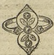
Núm. 1.—3 brillantes y diamantes. Ptas. 150.

MONTURAS DE PLATINO FINO Y ORO DE LEY 18 QUILATES CONTRASTADO