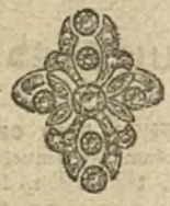
Núm. 10.—7 brillantes y diamantes. Ptas. 3.