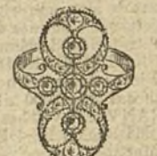
Núm. 8.—5 brillantes y diamantes. Ptas. 290.