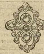
Núm. 15.—7 brillantes y diamantes. Ptas. 500.