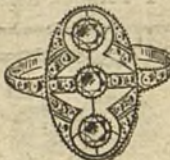
Núm. 12.—3 brillantes y diamantes. Ptas. 375.