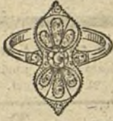
Núm. 2.—1 brillante y diamantes. Ptas. 175.