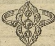
Núm. 3.—3 brillantes y diamantes. Ptas. 200.