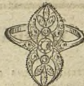
Núm. 6.—3 brillantes y diamantes. Ptas. 250.