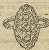
Núm. 9.—3 brillantes y diamantes. Ptas. 300.