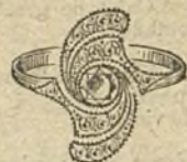
Núm. 7.—1 brillante y diamantes. Ptas. 275.