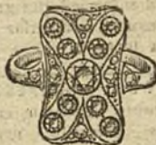
Núm. 14.—9 brillantes y diamantes. Ptas. 450.