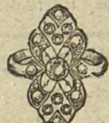
Núm. 11.—7 brillantes y diamantes. Ptas. 350.