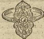
Núm. 4.—3 brillantes y diamantes. Ptas. 225.