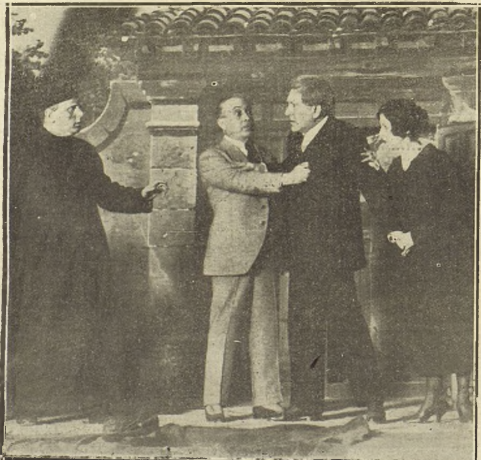
UNA ESCENA DEL DRAMA «LA PRINCESITA RUBIA», ESTRENADO ANOCHÉ EN EL COLISEO IMPERIAL.

Me voy a Londres así que tengo arreglados los papeles. ¿Quiere encargarse de hacérmelos despachar? Ten-