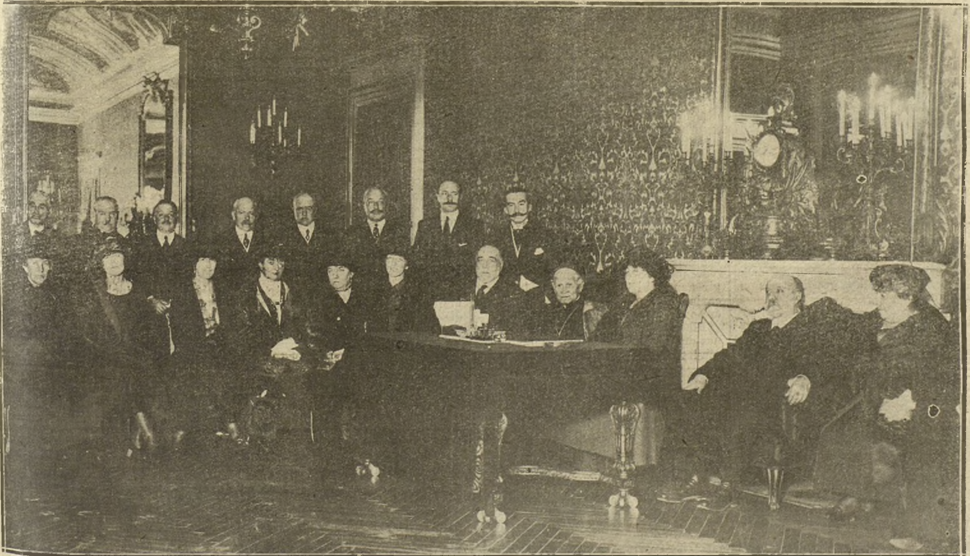
CONSTITUCION DE LA JUNTA ORGANIZADORA DEL AGENDAMIENTO DEL SOLDADO EN MARRUECOS. ACTO VERIFICADO AYER TARDE EN EL MINISTERIO DE LA GUERRA.

provocó aquel desastre sin par en la historia política de nuestro país. Ha llegado otra campaña electoral, y de nuevo es el señor La Cierva quien gobierna y dirige las huestes mauristas, con la oposición, claro está, de los