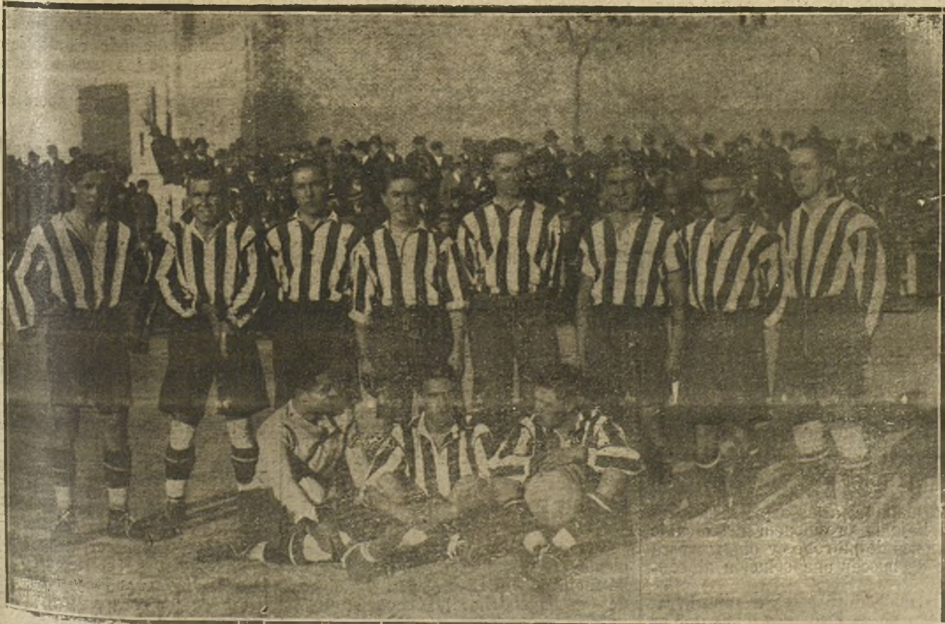
EL EQUIPO DEL «ATHLETIC», GANADOR DEL PARTIDO DE «FOOT-BALL» JUGADO AYER CONTRA EL «MADRID F. C.».

En la nota oficiosa del Consejo se consigna que el ministro de la Gobernación expuso la situación del conflicto del abastecimiento del pan en Madrid con referencia a los informes de las autoridades, de las cuales resulta haberse logrado una producción en el día de hoy superior a la de los días inmediatamente anteriores a la retirada de los obreros, hallándose asegurado el sucesivo incremento, y estribando la mayor dificultad en la distribución, merced al cierre de algunos despachos, que se espera compensar con las disposiciones