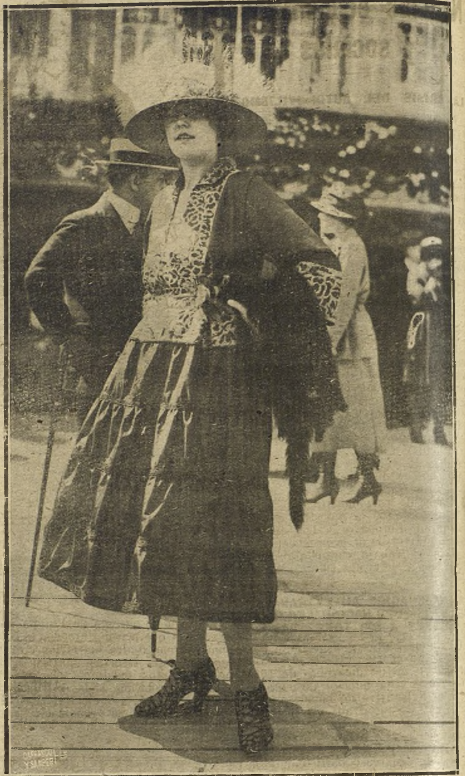
MODERNO TRAJE DE CALLE, CON BORDADOS DE ENCAJE Y FALDA DE FRUNCES, CREACION DE LA CASA LAPS

NO SE DEVUELVEN LOS ORIGINALES GRAFICOS NADA MAS QUE EN EL CASO EN QUE PREVIAMENTE HAYAN SIDO ADQUIRIDOS CON ESA CONDICION.