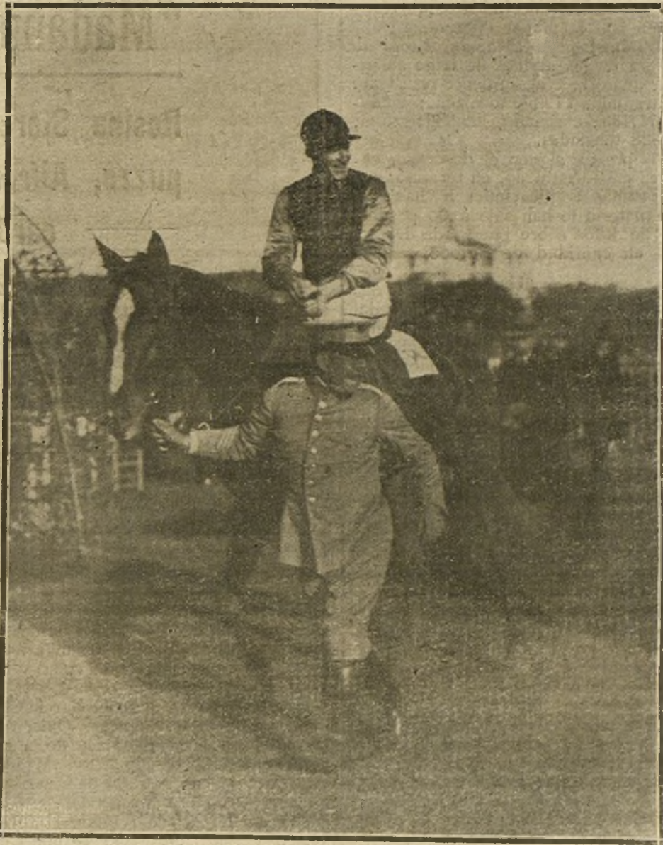
LAS CARRERAS DE CABALLOS.—LA POUPEE, DE LA ESCUELA DE EQUITACION, GANADOR DEL PREMIO «VALDERAS» EN LAS CARRERAS CELEBRADAS AYER EN EL HIPODROMO DE LA CASTELLANA.

Los treinta o cincuenta millones que el Gobierno dice haber invertido en las diferencias de jornales y precios de harina habían sido suficientes para poner en movimiento las tahonas necesarias. El suministro de pan no puede ni debe entenderse como un negocio más. Es un servicio público que cumple dirigir al Gobierno. Entendiéndolo éste de esa forma, ha venido actuando cerca de los fabricantes para mantener los precios equitativos. No hay más, pues, que ampliar un poco la intervención, y la fabricación del pan habrá pasado a pertenecer al Estado o a su delegación municipal.