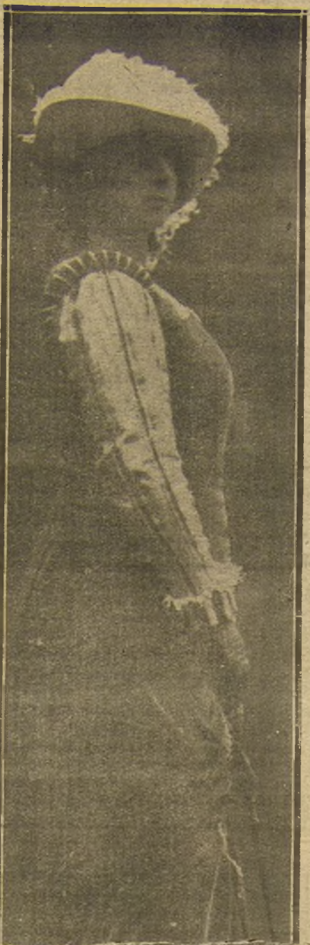
NADINA BORINA, NOTABLE SOPRANO, QUE ACTUARA ESTA TEMPORADA EN EL TEATRO REAL