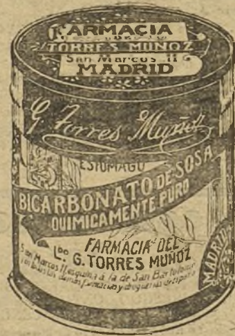
LATAS ECONOMICAS DE 1 1/2 KILOS