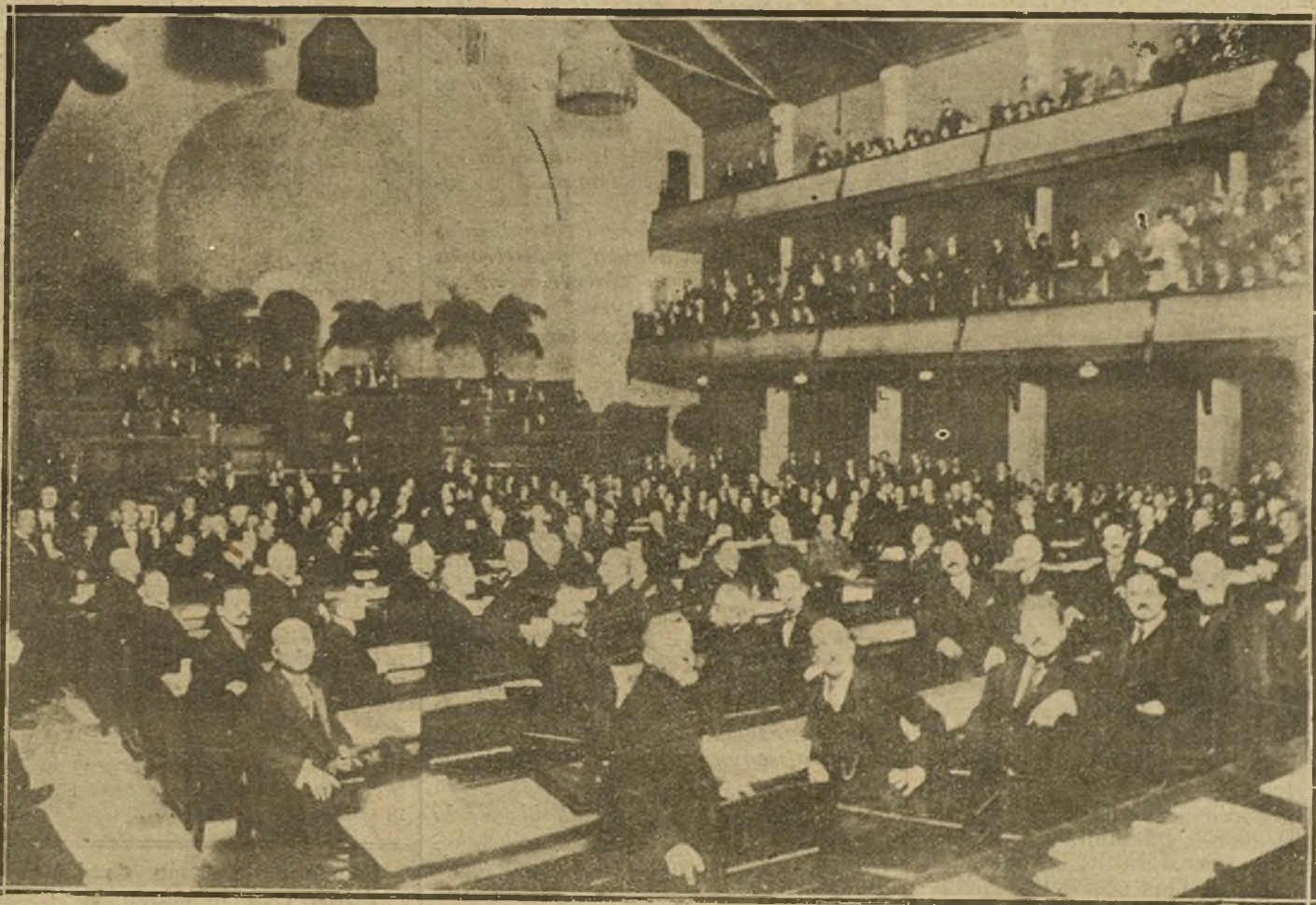
ASPECTO DE LA «SALA DE LA REFORMA» DURANTE UNA DE LAS SESIONES DE LA LIGA DE LAS NACIONES, CELEBRADA EN GINEBRA.