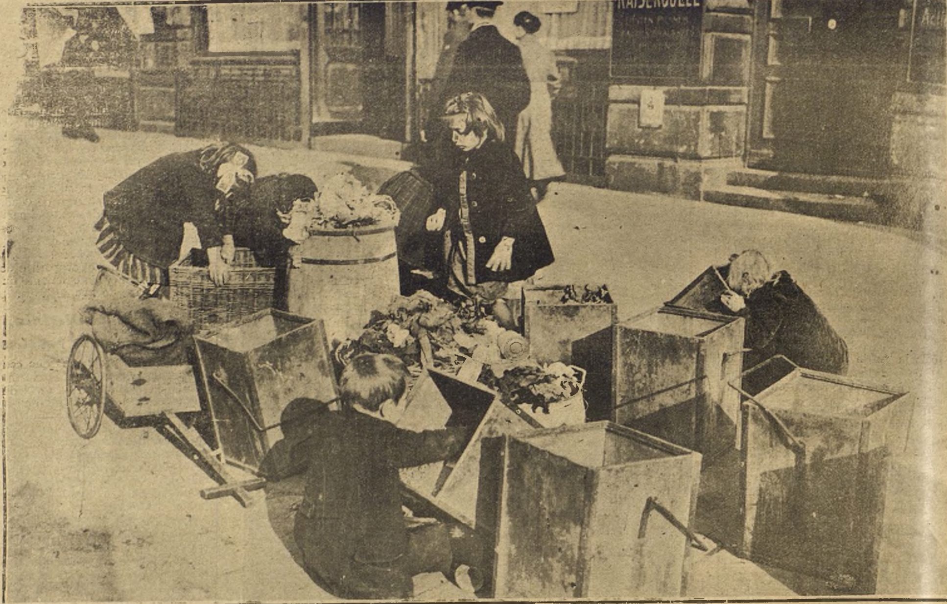
LA FALTA DE COMBUSTIBLE EN ALEMANIA.—GRUPO DE NIÑOS EN UNA CALLE DE BERLIN BUSCANDO EN LAS LATAS DE BASURA LOS RESIDUOS DE CARBÓN. (PHOTOTHER.)