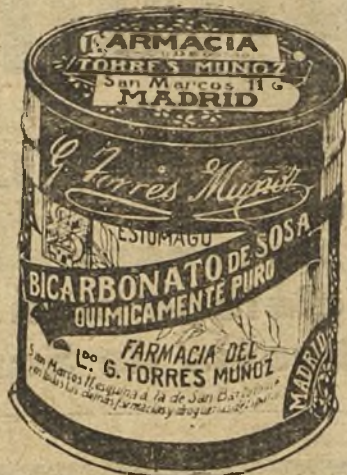
LATAS ECONOMICAS DE 1 1/2 KILOS

Una mecánica, con motor eléctrico. Figuras artísticas, clases, económicas. Misterios, tamaños grandes, cascos, molinos, norias, etc. LA FORTUNA, Hortaleza, 11 y 12.