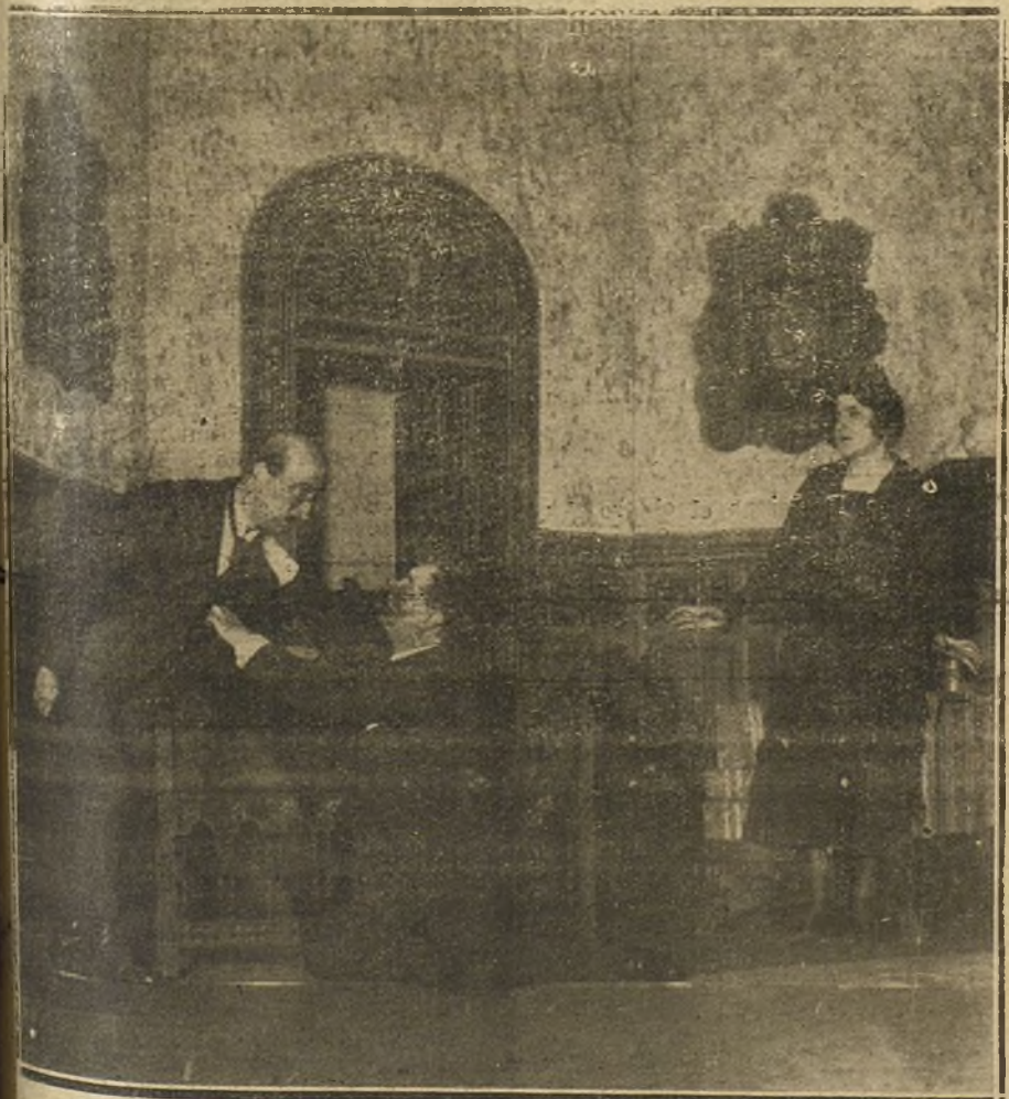
LA ESCENA DE «LA CARTERA DEL MUERTO», DRAMA DE ALONSO SECA, QUE SE ESTRENA ESTA NOCHE EN EL TEATRO DEL CENTRO.

La Policía tiene una pista, en virtud de una confidencia recibida, para gestionar la detención de los asesinos, y se es-