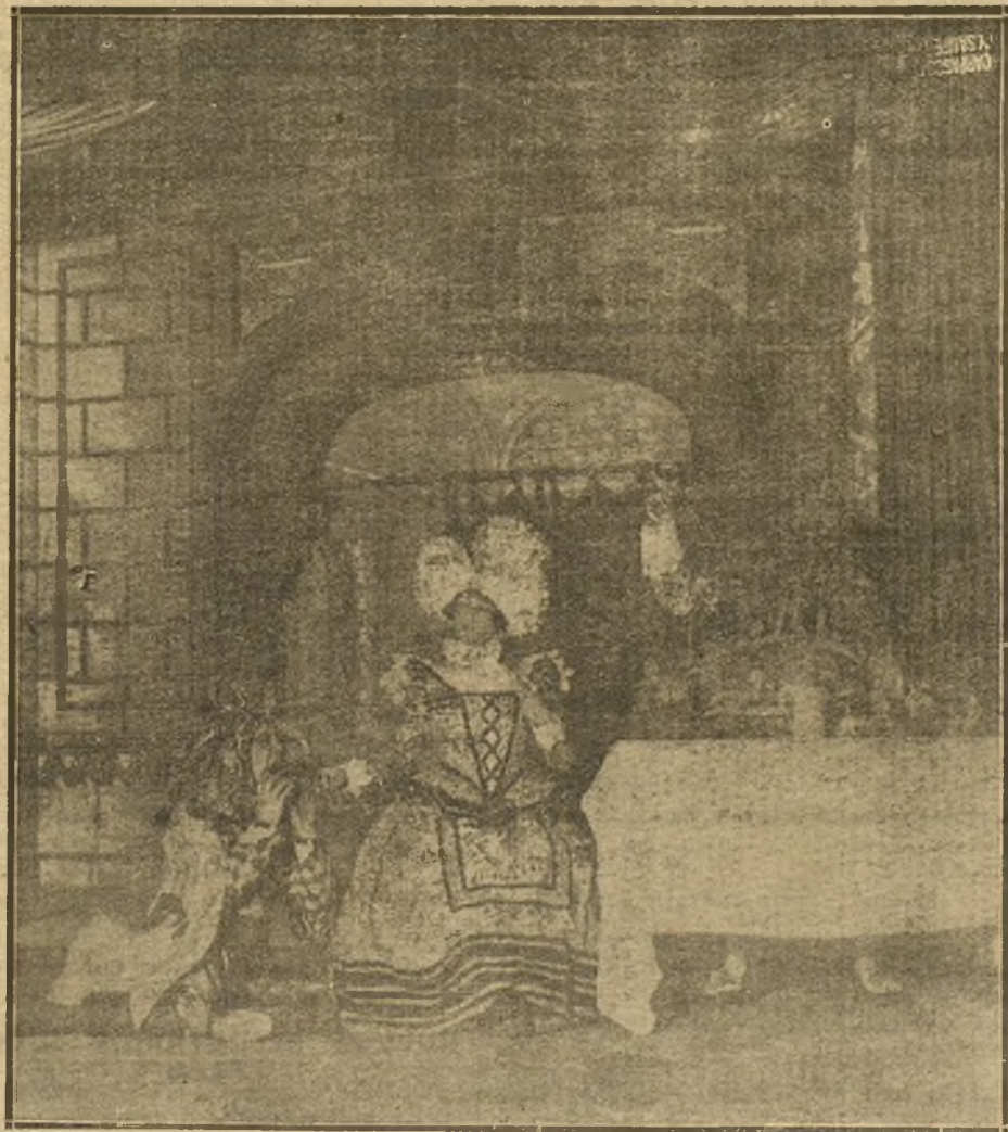
UNA ESCENA DE LA OBRA DE BENAVENTE "EL PRINCEPE QUE TODO LO APRENDIO EN LOS LIBROS", QUE SE REPRESENTA EN EL TEATRO ESPAÑOL, CON NUEVOS DECORADOS Y VESTUARIO.

Méjico.—Servicio se admite a riesgo del expedidor. Los telegramas están sujetos a censura.