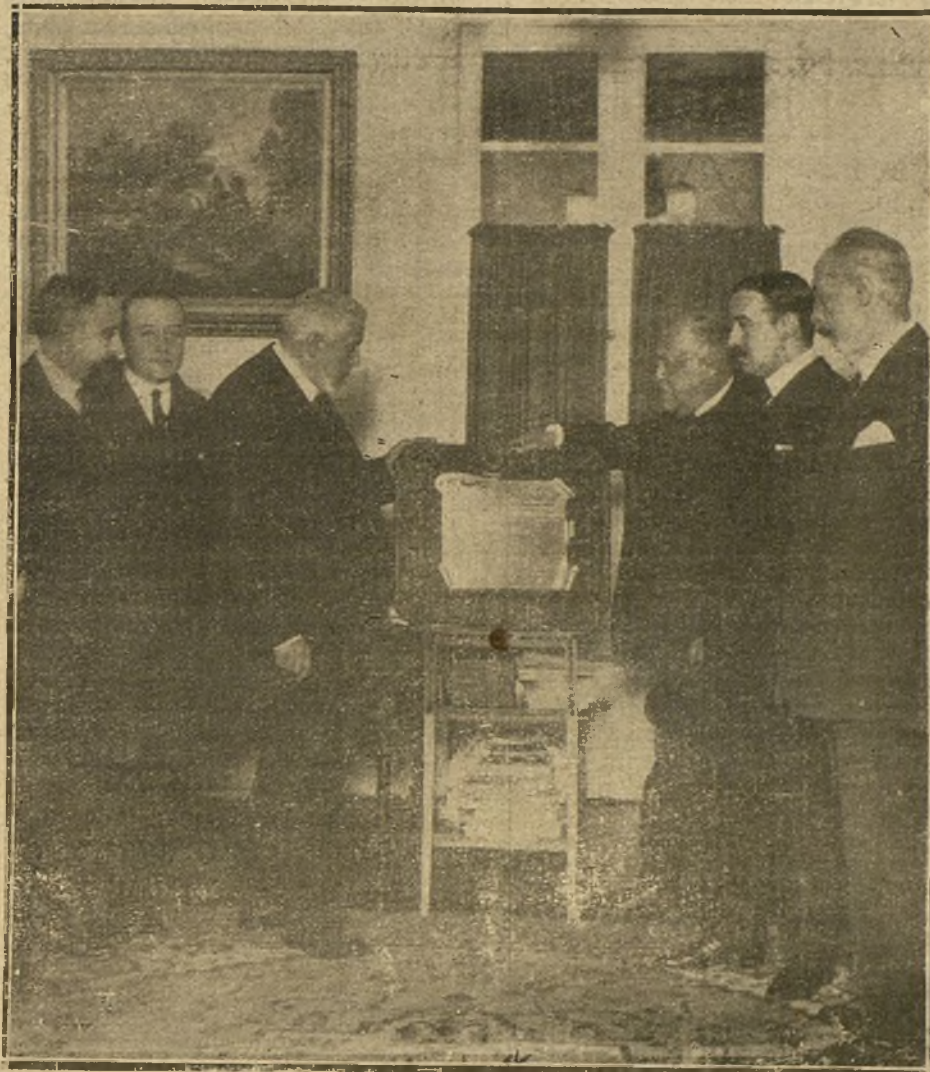
HOMENAJE AL DOCTOR ELIZAGARAY CON MOTIVO DE SU INGRESO EN LA REAL ACADEMIA DE MEDICINA.

En la criminal contienda de Barcelona caen lo mismo patronos que obreros sindicalistas, contra todos actúa la banda negra de perturbadores. A todos interesa, pues, que la batalla contra esa banda resulte eficaz y rinda provechosos frutos para la normalidad futura.