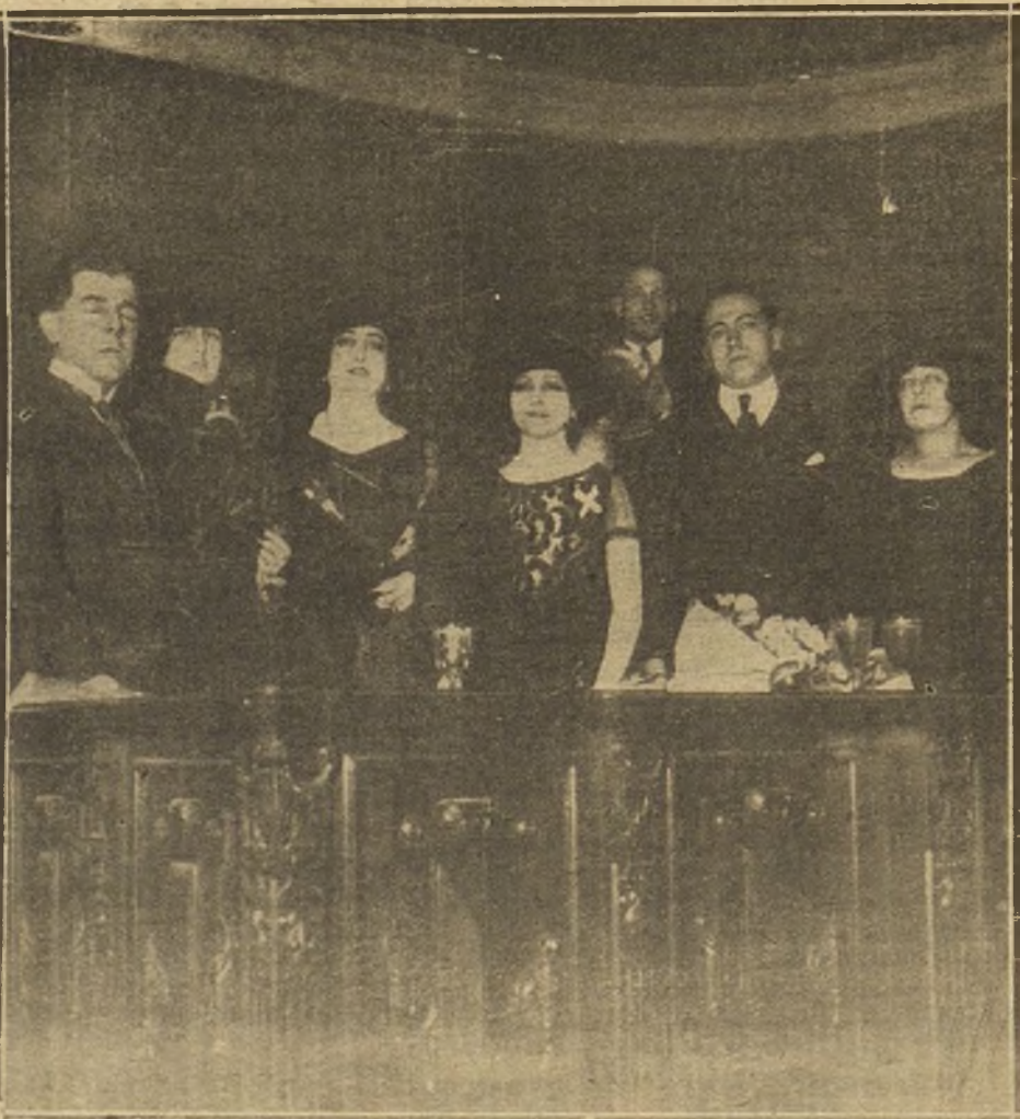
LA NOTABLE ACTRIZ CARMEN SICO AL TERMINAR LA LECTURA DE POESÍAS DEL LIBRO DE VALENTIN DE PEDRO «JIMAS DE PASIÓN» ALTO VERIFICADO AVER HS DE ATENEO

EL ANUNCIO EN «LA TRIBUNA» ES EL MAS PRODUCTIVO, POR SU AMPLIA INFORMACION Y EXTENSA TIRADA.