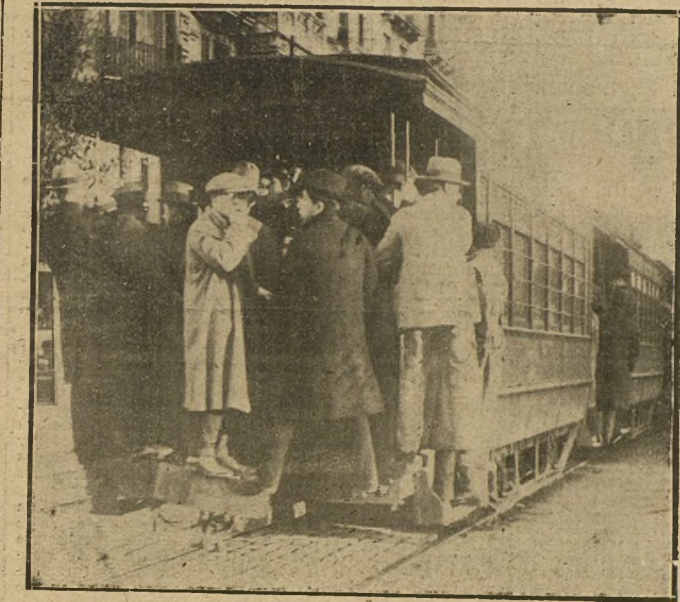
EL CONATO DE HUELGA GENERAL EN BARCELONA. EL FERROCARRIL ELECTRICO DE LA CALLE DE BALMES ABARROTADO DE PUBLICO, POR SER EL UNICO MEDIO DE LOCOMOCION QUE HABIA ESTOS DIAS EN BARCELONA.

Nunca el dilema shakespeariano mostró, como en esta ocasión, la hora suprema de la vida o de la muerte: ser, en humana confraternidad, o no ser, en inhumana exacerbación del odio... En esta hora, la generosidad no es más que instinto de conservación; por eso Inglaterra nos aparece generosa... En torno de ella, y en igual afán, se agruparon la mayoría de las naciones repre-