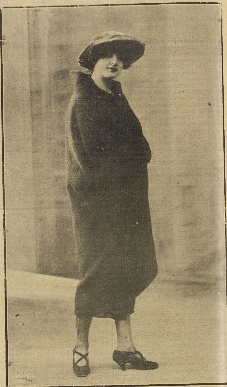
ELEGANTE CAPA ABRIGO, DE PAÑO RUSO, FORMA SENCILLISIMA, MODELO DE LA CASA LYA DE