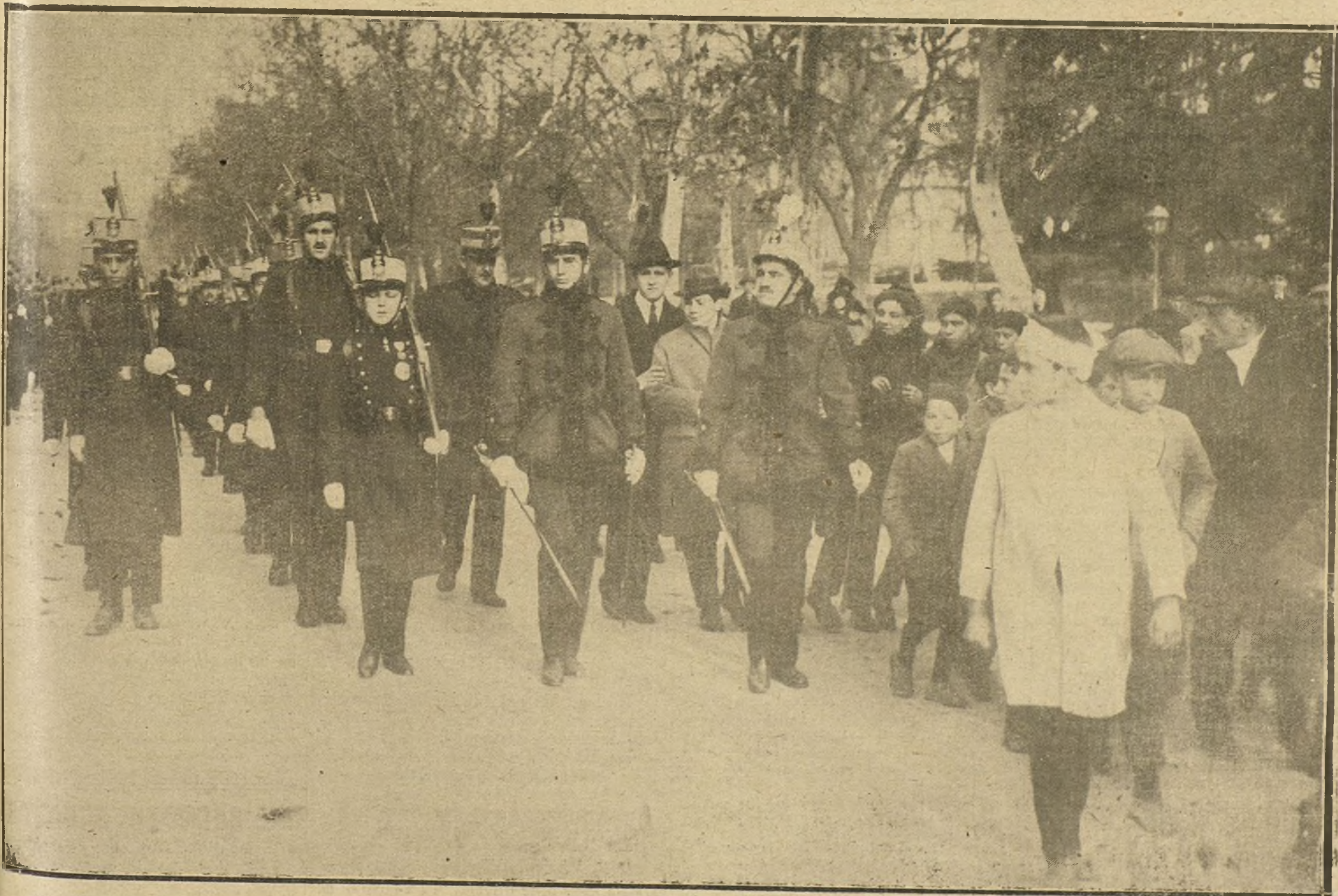
SE ADECUA EL PRINCEPE DE ASTURIAS AL FRENTE DEL REGIMIENTO A QUE PERTENECE, DESFILANDO POR LAS CALLES DE MADRID CON MOTIVO DE LA FIESTA DE LA PATRONA DEL ARMA DE INFANTERÍA.

EL ANUNCIO EN «LA TRIBUNA» EL MAS PRODUCTIVO, POR SU AMPLIA INFORMACION Y EXTENSA TIRADA.