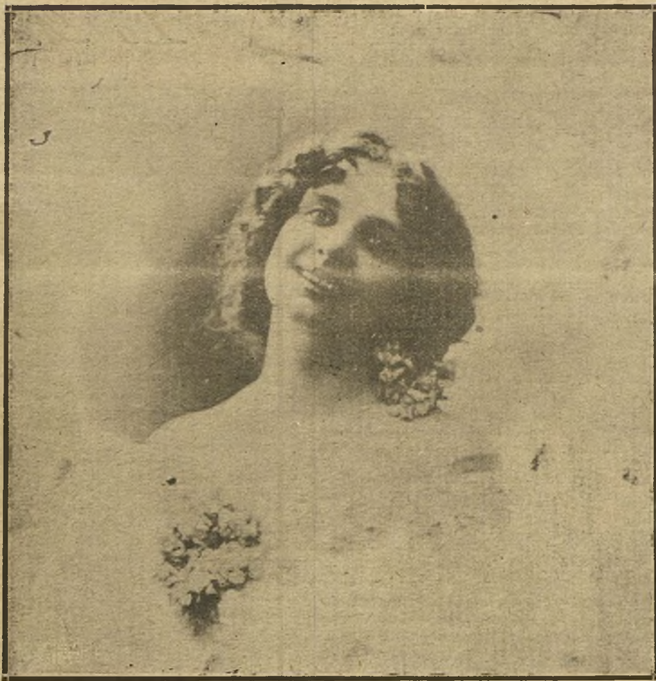
ROSINA STORCHIO, LA INSUPERABLE INTERPRETE DE «MADAME BUTTERFLY» Y «MANON»

No creo necesario, ni siquiera oportuno, entrar ahora a discutir el sistema lógico del leitmotiv, sus consecuencias y derivaciones, y otras cosas ya de tiempo tan manidas, y que todos cuantos nos interesamos algo en el arte tenemos a nuestro alrededor en innumerales (excesivos) libros escritos sobre ello.