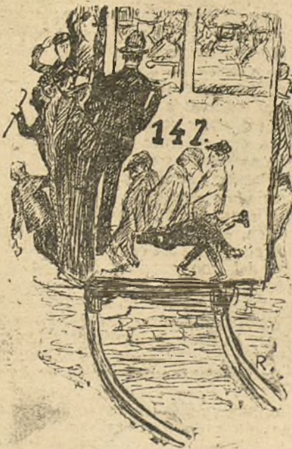
COMO VAN LOS TRANVIAS HOY

¿Por qué, para mayor justicia y sencillez de la conversación, no se da cuen-