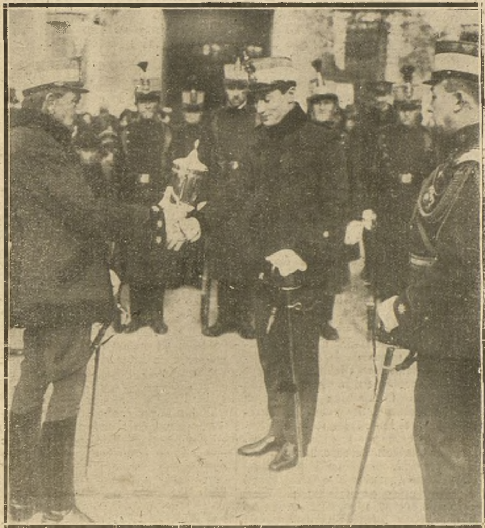
LA FIESTA DE LA PATRONA DEL ARMA DE INFANTERÍA.—EL CORONEL DEL REGIMIENTO DE WAD-BAS ENTREGANDO LAS COPAS A LOS GANADORES EN EL CONCURSO DE TIRO, ACOTO CELEBRADO EN EL CUARTEL DE MARIA CRISTINA.

si la generosidad de la nación no alcanzara las proporciones necesarias