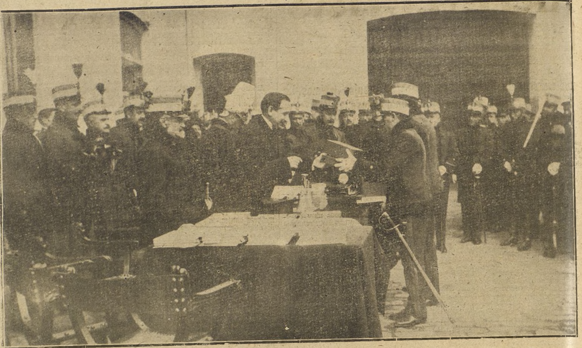
EL MINISTRO DE LA GUERRA EN EL CUARTEL DE LOS DOCKS, ENTREGANDO LOS PREMIOS DEL CONCURSO DE TIRO ORGANIZADO CON OCASION DE LAS FIESTAS DE LA PATRONA DEL ARMA DE INFANTERIA

verdadera diva de los negocios, es la que saldrá gahando.