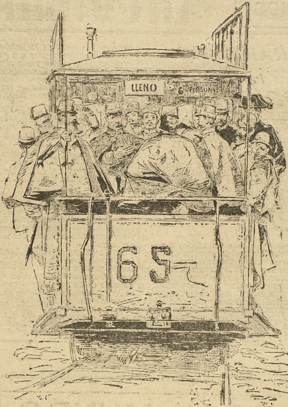
COMO IBAN YA LOS TRANVIAS EN LOS PRIMEROS TIEMPOS DE SU INVENCIÓN