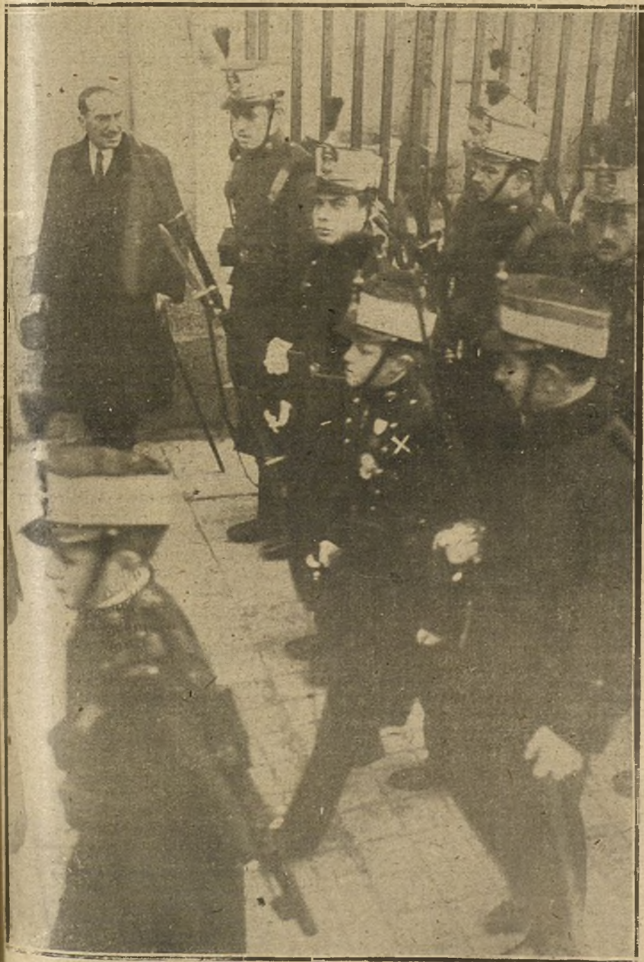
EL PRINCIPE DE ASTURIAS (N). ALSALIR DE LA IGLESIA DE LOS JERONIMOS, DESPUES DE ASISTIR CON SU REGIMIENTO A LA MISA CELEBRADA CON MOTIVO DE LA FIESTA DE LA PATRONA DE LA INFANTERIA.

—Jamás admitiremos — dijo — que Europa tenga la dirección de los asuntos del Canadá, y no olvidaremos tampoco que las ambiciones del viejo continente han ensangrentado al mundo. — Radio.