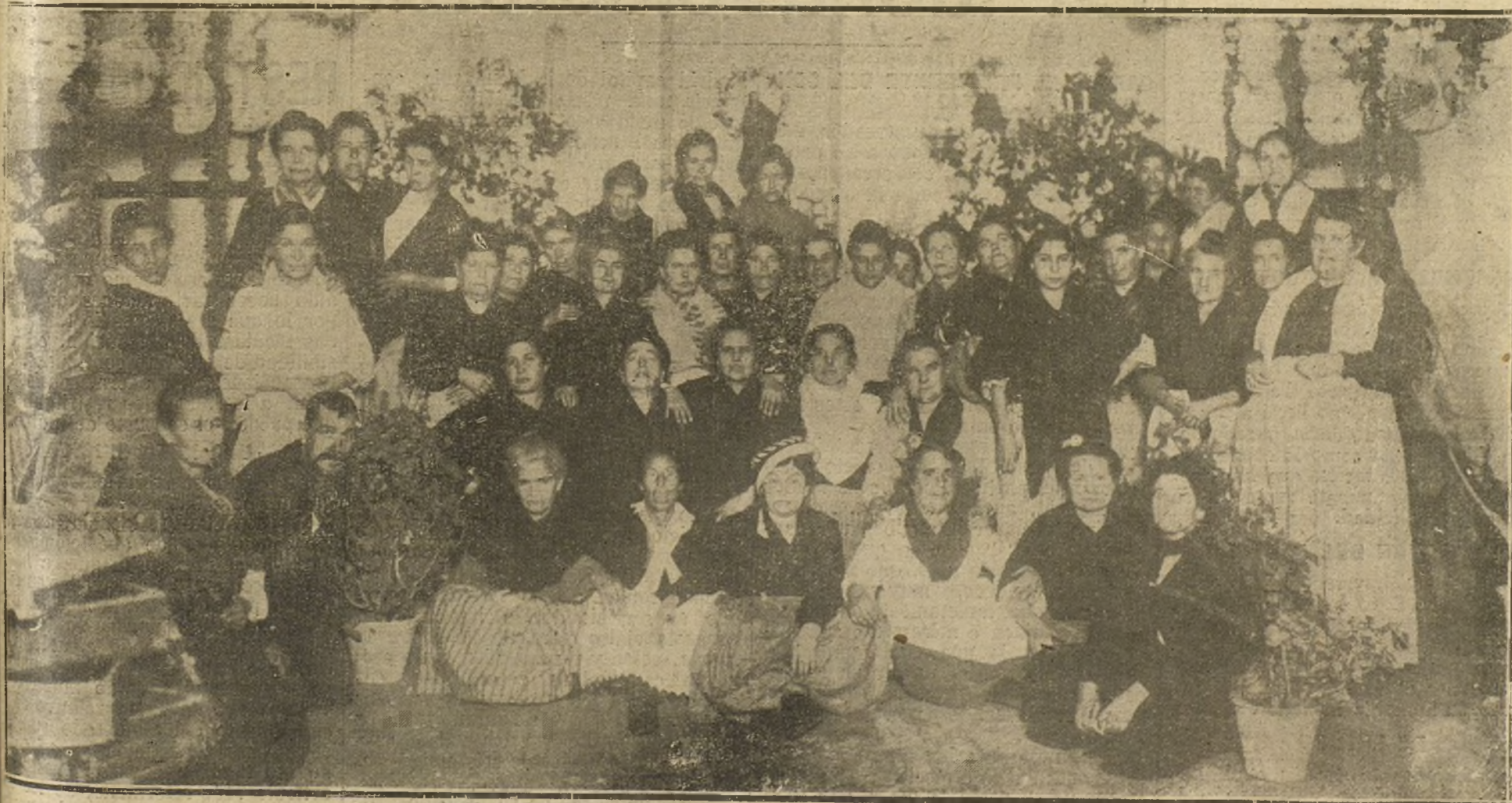
LAS CIGARRERAS SEVILLANAS.—GRUPO DE CIGARRERAS DE LA FÁBRICA DE TABACOS DE SEVILLA, ORGANIZADORAS DE LAS FIESTAS QUE SE ESTÁN CELEBRANDO EN LA ACTUALIDAD EN HONOR DE SU PATRONA.

Cansado de ensayos, de combinaciones y de interinidades, el país quiere asistir a una labor legislativa seria. Po-