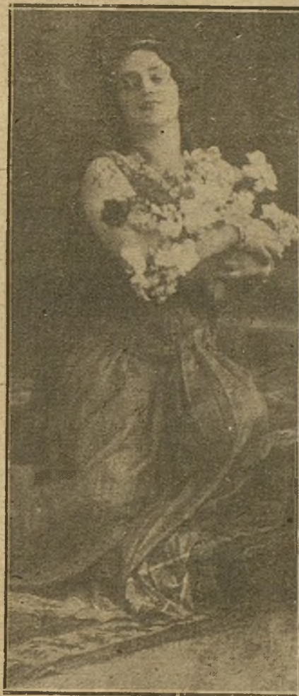
LA DISTINGUIDA SOPRANO CERTRUDIS KAPEL, QUE ACTUA EN EL TEATRO REAL