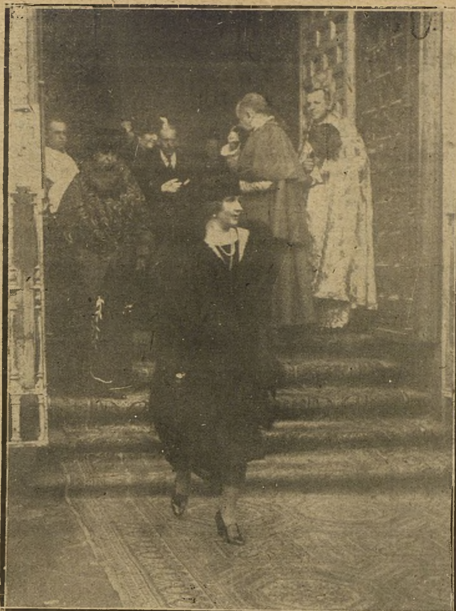
SUS MAJESTADES LAS REINAS DOÑA VICTORIA Y DOÑA CRISTINA AL SALIR ESTA MAÑANA DE LA IGLESIA DE LAS CALATRAVAS.