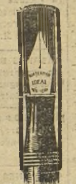
CAPUCHÓN DE SEGURIDAD

El modelo de llene automático se llena sin cuenta gotas en un segundo por un sencillo levanta- miento y cierre de la palanca. Una vez cerrada esta última, el mango queda liso sin ninguna parte saliente que estorbe para escribir o al llevar la pluma en el bolsillo; además lleva un ca- puchón roscado que cierra her- méticamente y es de toda seguridad. Este modelo tiene todas las per- fecciones que han creado la fa- ma de la pluma Ideal Waterman.