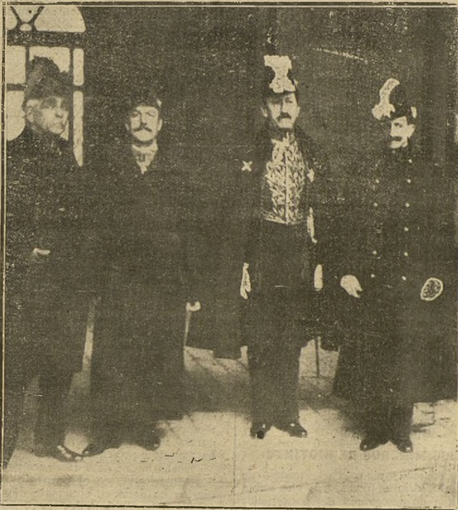
EL NUEVO REPRESENTANTE DIPLOMÁTICO DE VENEZUELA, D. J. A. MARTÍNEZ MENDEZ, AL SALIR DE PALACIO, DESPUÉS DE PRESENTAR LAS CARTAS CREDENCIALES A SU MAJESTAD EL REY.

Al futuro Parlamento se le prepara una obra importante. Se empieza a tener confianza en que esta obra no la malogre las divisiones y los especu-