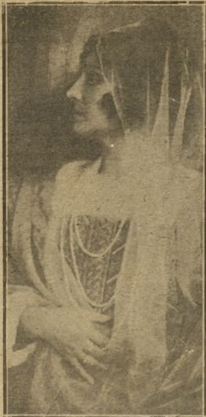
CARLOTTA DAHMEN, CELEBRADA SOPRANO DEL TEATRO REAL

Por eso nos hemos creído en el caso de amparar su protesta, y estamos dispuestos a seguir prestando a este asunto la atención que merece.