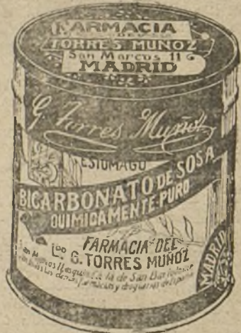
LATAS ECONOMICAS DE 1 1/2 KILOS