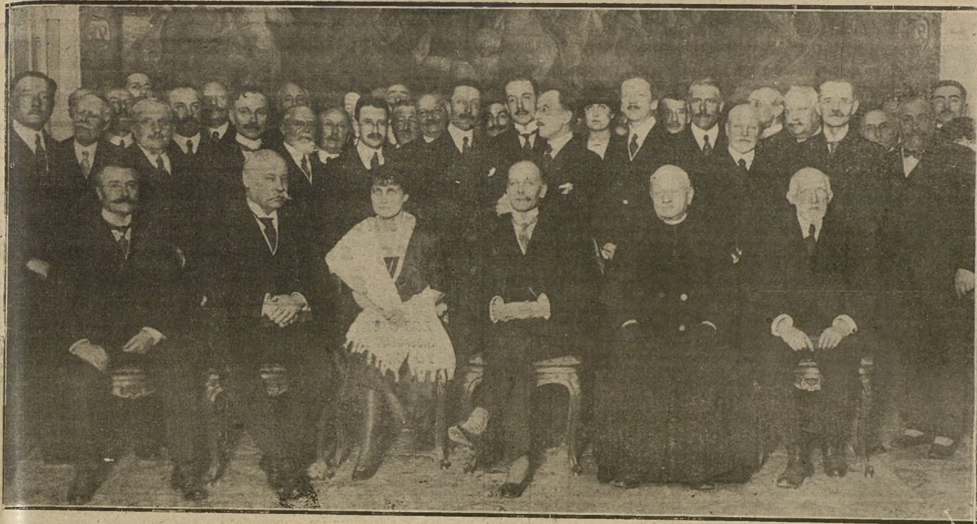
MOTIVO DE LA DESPEDIDA DEL EMBAJADOR, CONDE DE SAINT-AULAIRE.