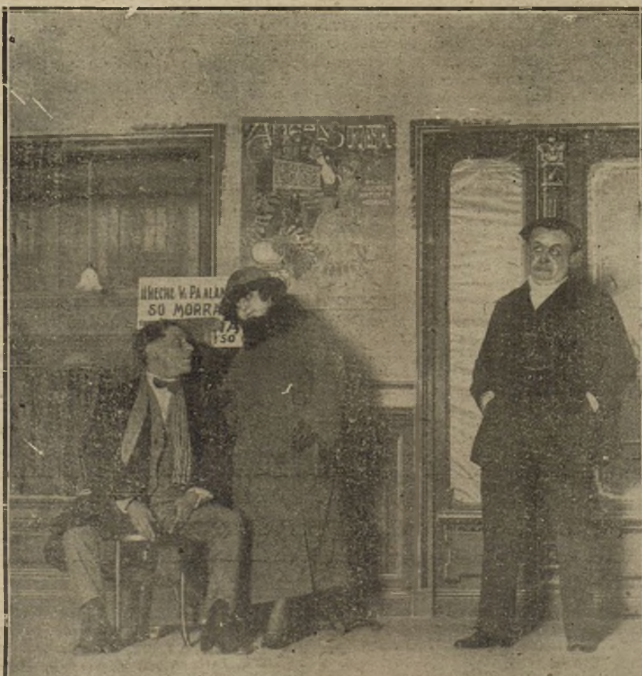
Y SEPULCRO EN LA ORRA. ASI PREDICA LA SEÑORA GAMEZ Y LOS SEÑORES AGUILAR TRO DE LA INFANTA ISABEL. (FOT. VIDAL) BA DIEGO. ESTRENADA AYER EN EL TEA

Y como la Prensa, en su mayoría, más del aspecto industrial que tiene, quiera atribuirsele, tiene otro, una vida de positiva idealidad e influencia en la vida de la nación, al país en general, en primer término a los gobernantes, interesa que no desaparezcan los periódicos que son órganos de la opinión pública, ser sustituidos por la Prensa que puede editar unos cuantos políticos despreciosos o financieros ambiciosos que busquen