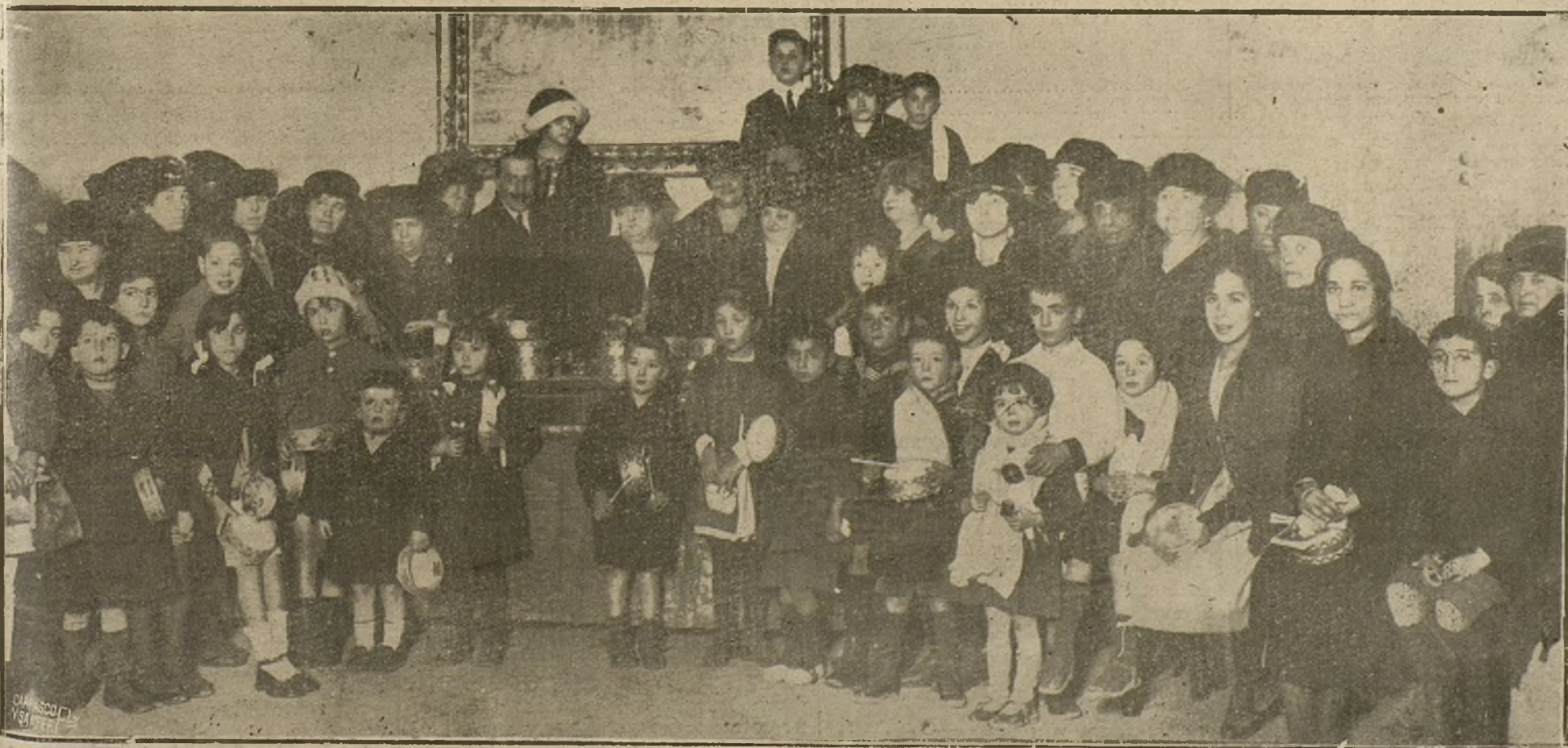
REPARTO DE PREMIOS A LOS NIÑOS QUE PROTEGE EL COMITE FEMENINO DE HIGIENE POPULAR. ACT. VERIFICADO AYER

gurarse que el señor Dato, además de la ayuda de los grupos derechistas, contará con apoyos tan estimables como el de los demócratas y los liberales agrarios, que han traído este año una lucida representación. Claro es que estos apoyos serán condicionados