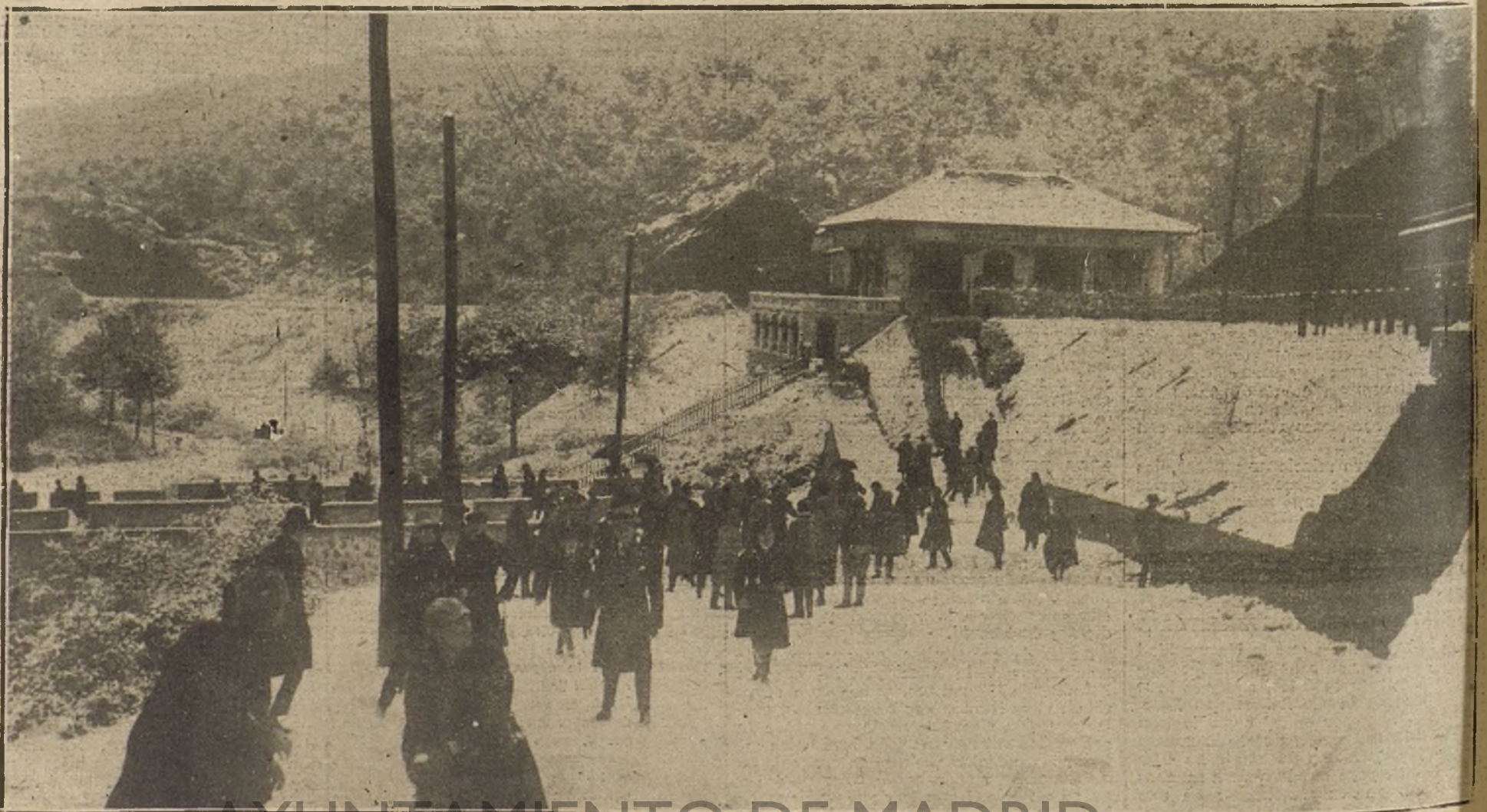
AYUNTAMIENTO DE MADRID UNA GRAN NEVADA EN BARCELONA.—ASPECTO DE LAS PLANAS DE VALVIDRERA, POCO DESPUES DE LA NEVADA.

Sin embargo, aunque la fecha exacta del viaje no ha sido fijada todavía, lo será muy en breve.—Radio.