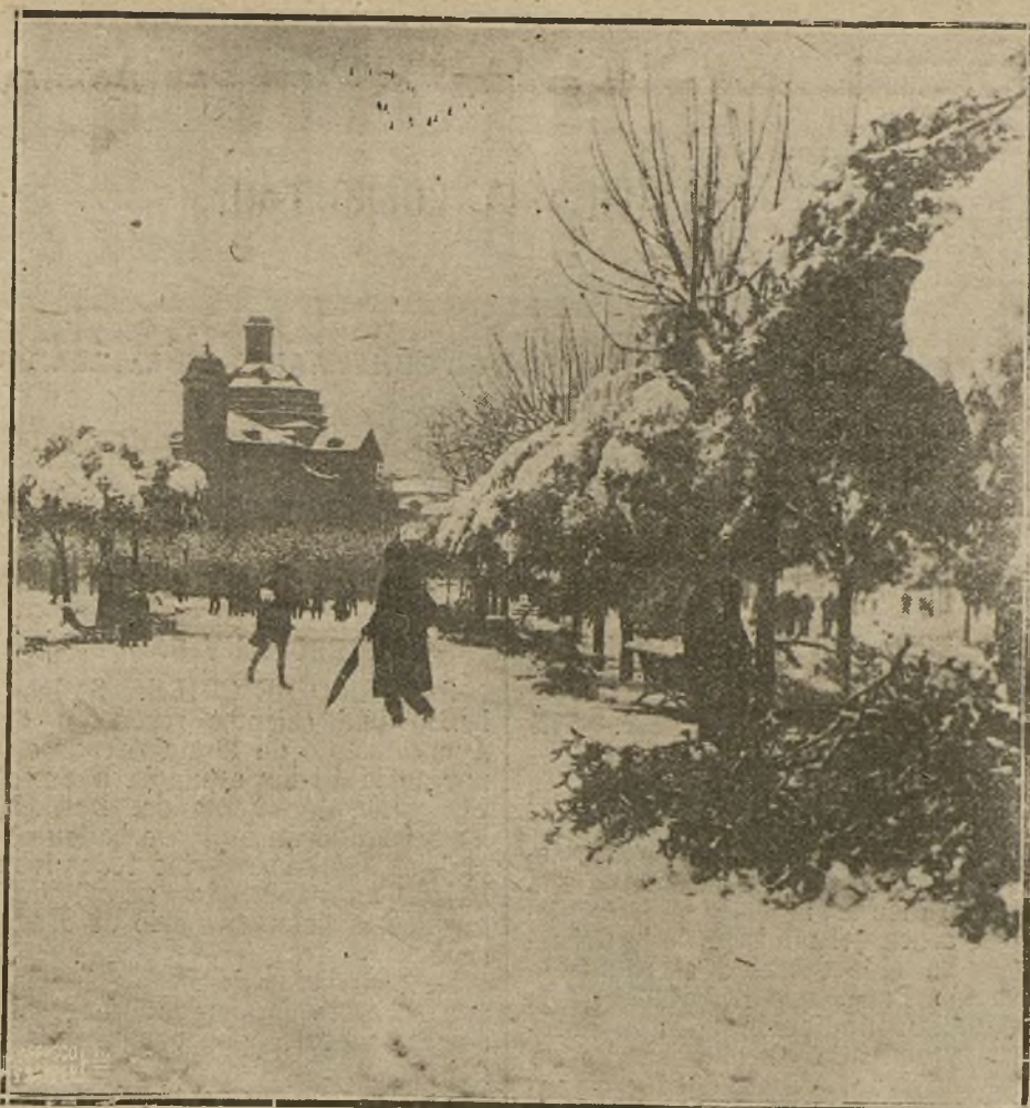
EL TEMPORAL DE NIEVES EN BARCELONA.—UN ASPECTO DEL PARQUE.