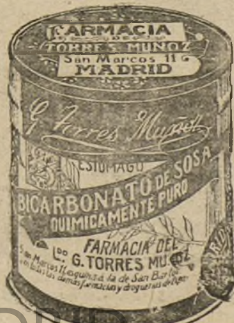
LATAS ECONOMICAS DE 1 1/2 KILOS

Delegación de la Compañía: Gran Vía, 16, Madrid