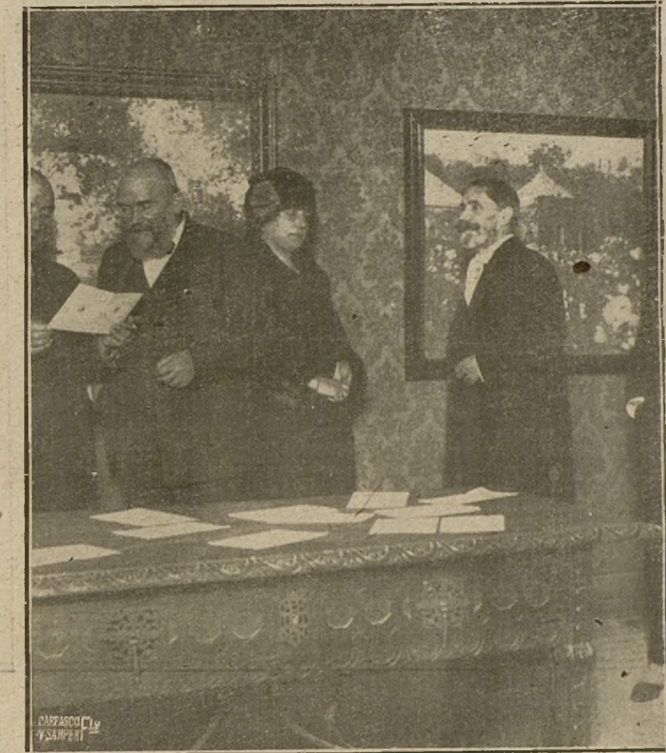
UN DETALLE DE LA EXPOSICION MEIFREN, INAUGURADA AYER TARDE EN EL SALON PERMANENTE DEL CIRCULO DE BELLAS ARTES.

Votos más, votos menos, en las Cortes tendrá el señor Dato alrededor de unos 200, a los cuales se sumarán au-