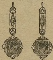
Núm. 1.161.—Pendientes oro y platino 4 brillantes, zafiros y rosas. Ptas. 625.