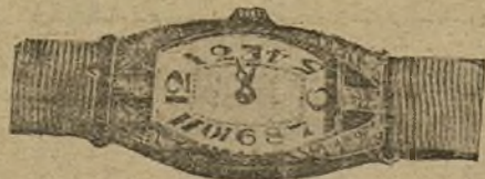
Núm. 2.748.—Reloj oro y platino, brillantes y oxix. Ptas. 1.800.