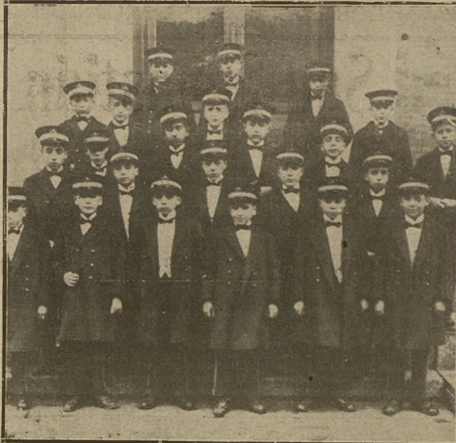
LOS NIÑOS DEL COLEGIO DE SAN ILDEFONSO QUE HAN SACADO LOS PREMIOS Y LOS NÚMEROS PREMIADOS.