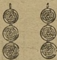
Núm. 2.200.—Pendientes oro y platino 6 brillantes. Ptas. 1.300.