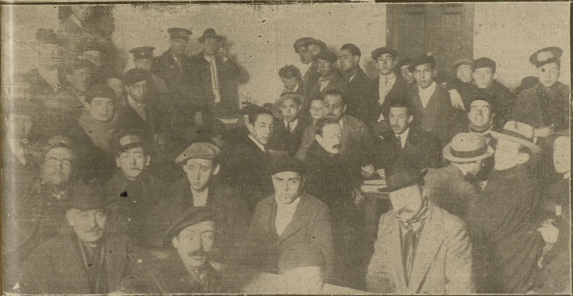
APARECE QUE OFRECÍA ESTA MAÑANA EL ANTIGUO LOCAL DE LA CASA DE CORREOS, DONDE SE HAN REUNIDO LOS CORRESPONSALES DE LOS PERIÓDICOS PARA HACER LA INFORMACIÓN TELEGRÁFICA Y TELEFÓNICA.

pesetas. Fina en Madrid. ¿Será ese mi número?