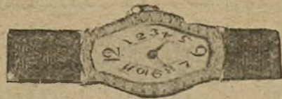
Núm. 2.650.—Reloj oro, platino y rosas. Ptas. 900.