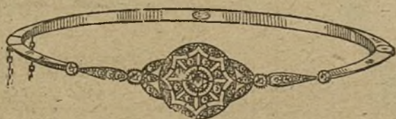
Núm. 1.159.—Pulsera de pedida, oro y platino 5 brillantes y rosas. Ptas. 700.