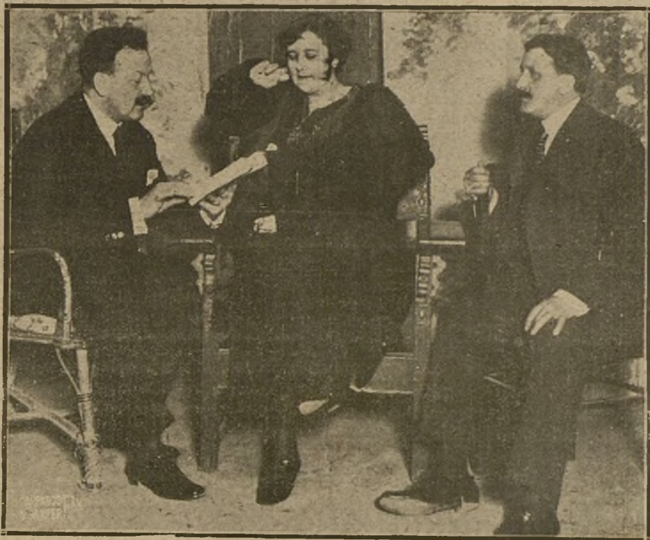
LA INSIGNE ACTRIZ ROSARIO PINO, QUE AYER SE HA DESPEDIDO DEL PÚBLICO MADRILEÑO, EN LA FOTOGRAFÍA APARECE ACOMPAÑADA DE LOS ILUSTRES COMEDIOGRAFO JOAQUÍN Y SERAFÍN ALVAREZ QUINTERO

Ya hemos visto el proceso de esos aumentos. A mayores sueldos, mayor