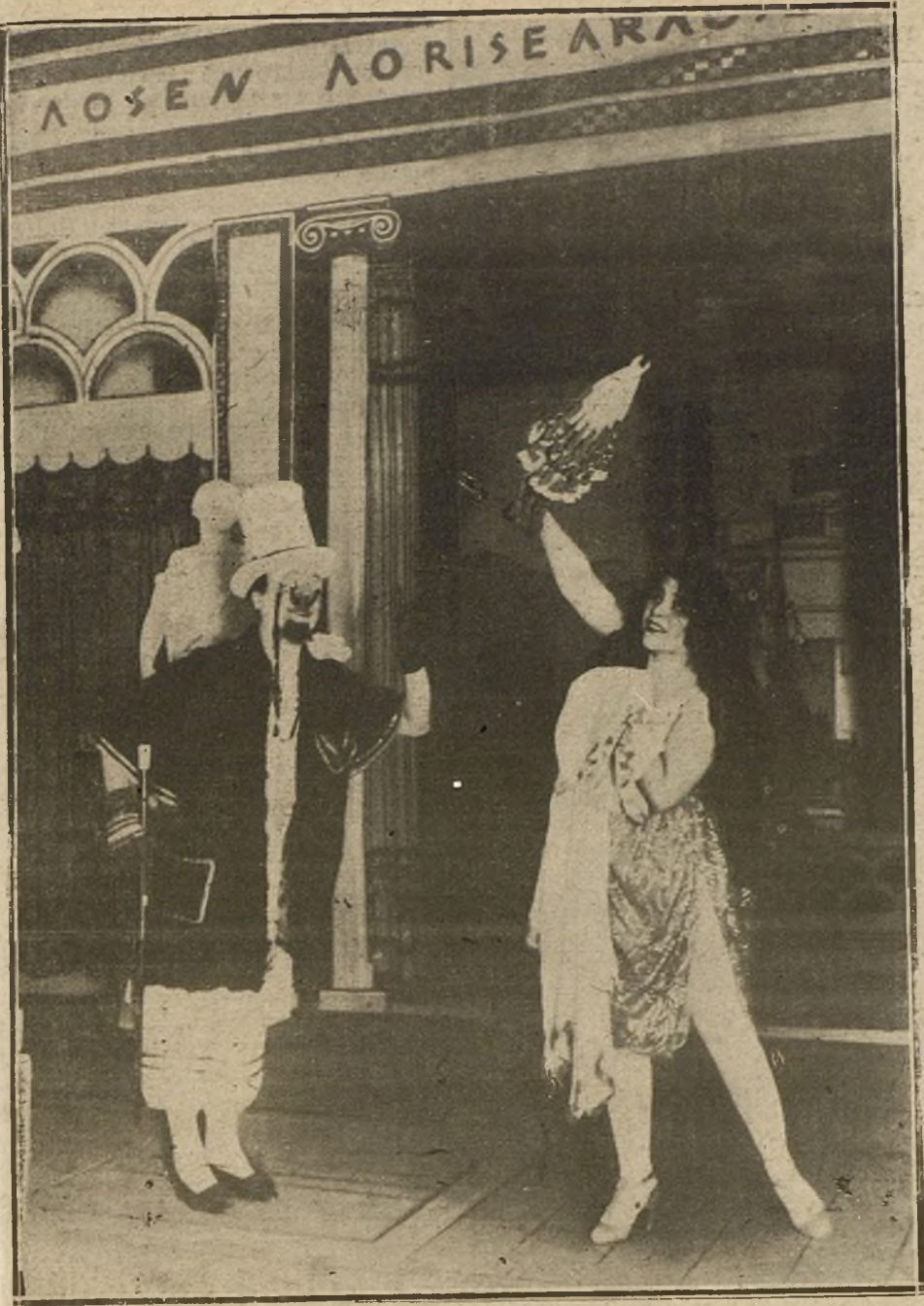
UN MOMENTO DE LA OPERETA «FI-FI», DEL MAESTRO CHRISTINZ, ESTRENADA ESTA TARDE EN EL TEATRO DE LA ZARZUELA.