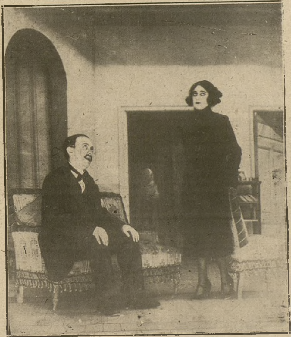
UNA ESCENA DEL JUGUETE COMICO «SAN PEREZ». ORIGINAL DEL SEÑOR MUÑOZ SECA, QUE SE HA ESTRENADO ESTA TARDE EN EL TEATRO DE LA COMEDIA.

También sin protestas es proclamado diputado a Cortes el marqués de Torrelaguna, y derrotado el señor Soria Hernández.