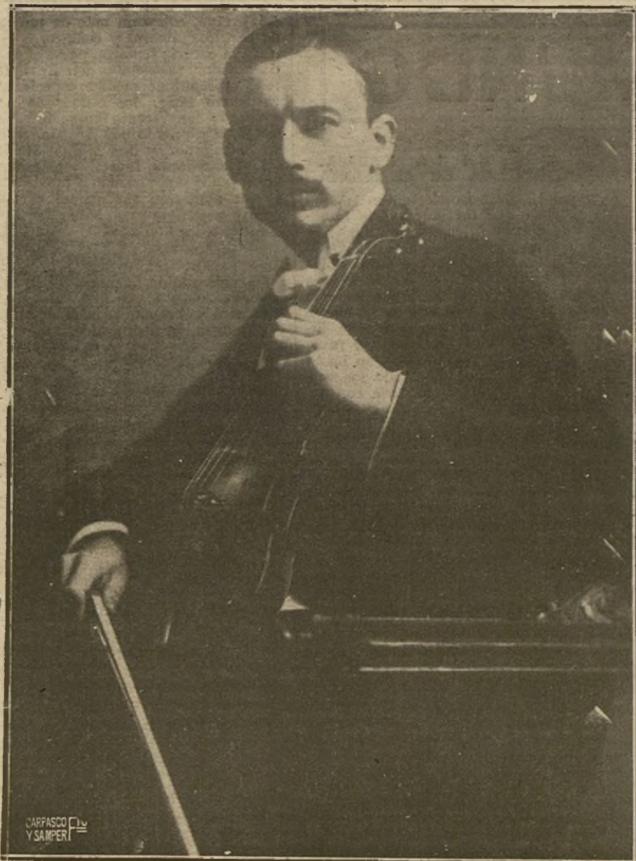
EL GENIAL VIOLINISTA VECSEY