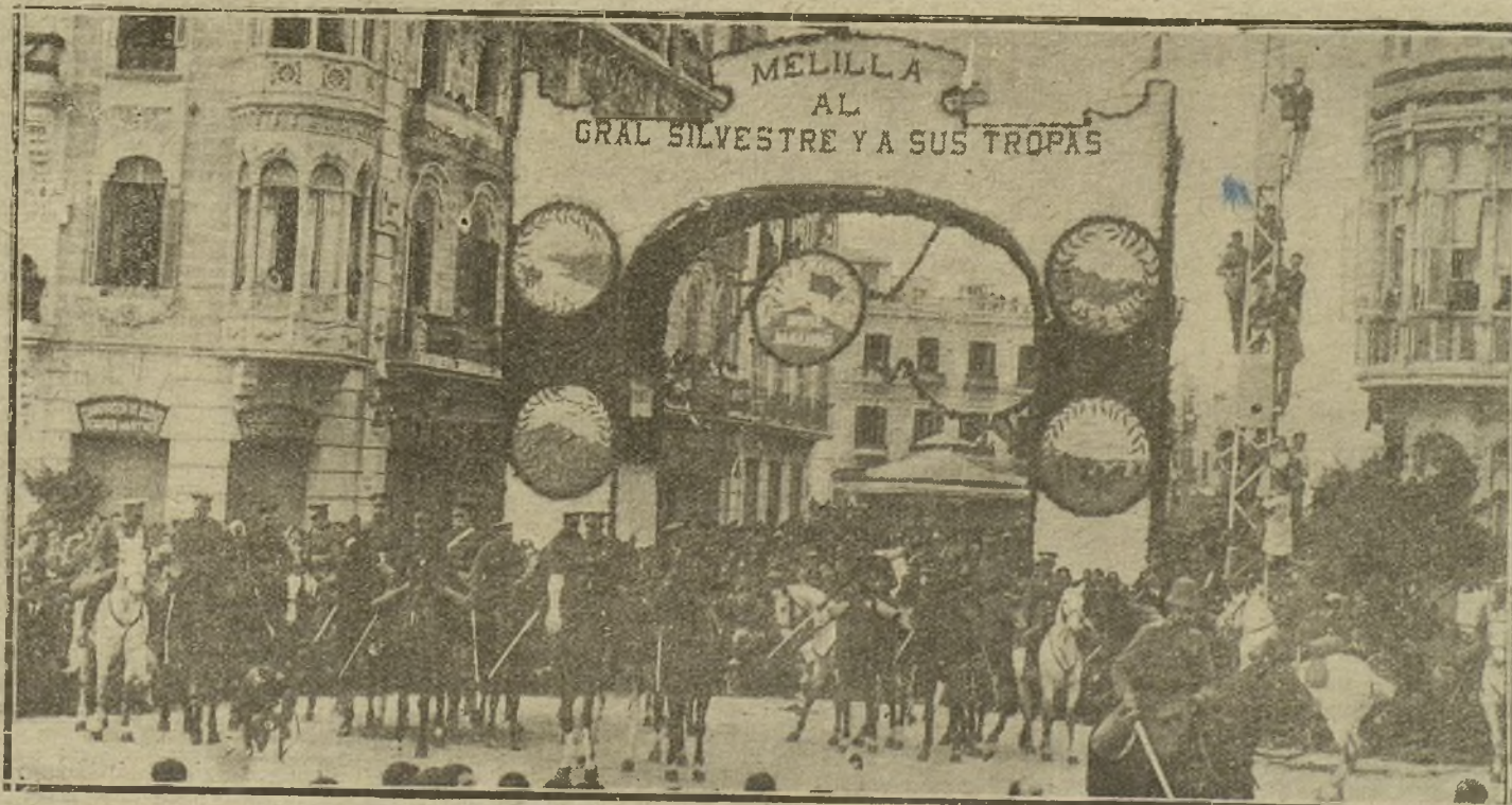
LOS GENERALES SILVESTRE Y BARON DE CASA D'VALILLO, CON SU ESTADO MAYOR, DURANTE LA MISA DE CAMPAÑA CELEBRADA EN LA PLAZA DE ESPAÑA CON MOTIVO DEL HOMENAJE TRIBUTADO POR EL PUEBLO DE MELILLA A LOS HEROES DEL MONTE MAURE.

—Idem al auditor de división don Luis Higuera y Bellido, marqués de Arlanza, en el cargo de auditor de la Capitanía general de la tercera región.