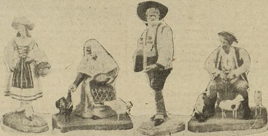
LA PASTORA DE LA PRESA, LA TIA GILA, BATO Y EL ZAGAL DE LAS OVEJAS

Siempre me parece que esas gachas deben estar muy buenas con un aliño que se les ha olvidado ya fabricar a las cocineras. Imitar la felicidad de aquellos pastores en el campo, encontrar noches como aquella entre las noches frías,