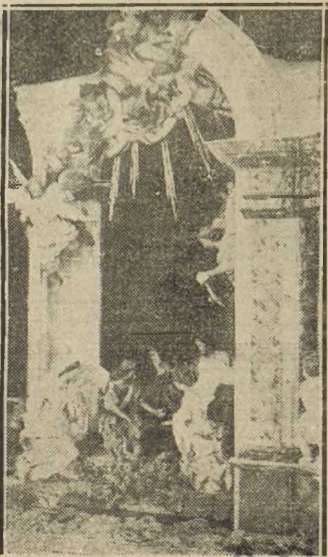
GRUPO DEL PORTAL DEL NACIMIENTO. DE SALZILLO

NO SE DEVUELVEN LOS ORIGINALES GRAFICOS NADA MAS QUE EN EL CASO EN QUE PREVIAMENTE HAYAN SIDO ADQUIRIDOS CON ESA CONDICION.