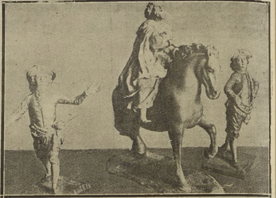
FIGURAS DEL NACIMIENTO. POR FRANCISCO SALZILLO, EL MURILLO DE LA ESCULTURA

Fue diversión de la corte más que de los principitos esos nacimientos magníficos. ¿Cómo romper un solo muñeco?