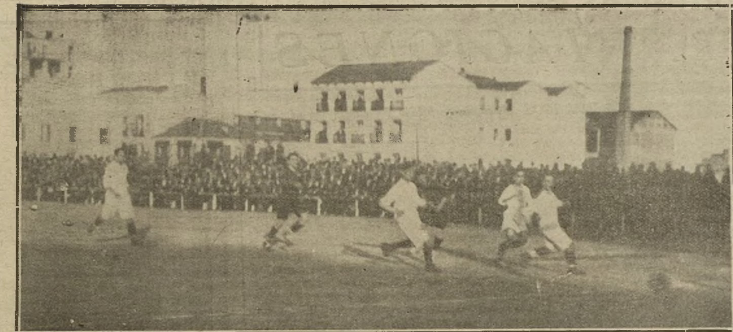
UN MOMENTO INTERESANTE DEL PARTIDO DE «FOOT-FALL» JUGADO AYER ENTRE LOS EQUIPOS RACING DE SANTANDER Y EL RACING DE MADRID.

Pocas veces se tiene la suerte de contemplar ante el altar nupcial una novia tan