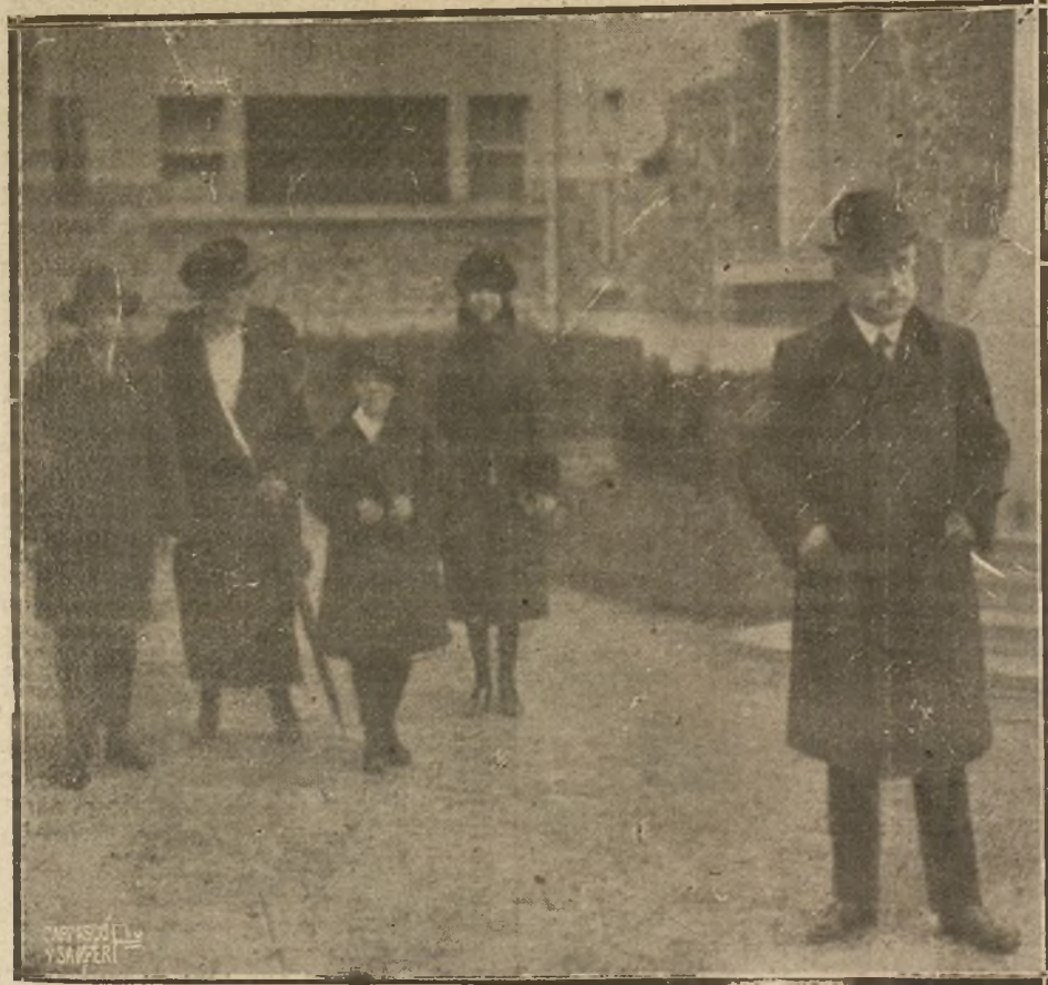
LA ENFERMEDAD DE DESCHANEL.—EL EX PRESIDENTE DE LA REPUBLICA FRANCESA PASEANDO CON SU FAMILIA POR LOS JARDINES DE LA VILLA QUE HABITABA HASTA RES- TABLECERSE TOTALMENTE.

alarma de los cuantacorrentistas y facilitando la garantía de las fortunas personales, como ya se hizo en otras provincias—recuérdese el reciente caso de Bilbao, cuando la difícil situación de la «Unión Minera», se habría podido conjurar el peligro y evitar el espectáculo que ayer ha dado el fuerte Banco de Barcelona.