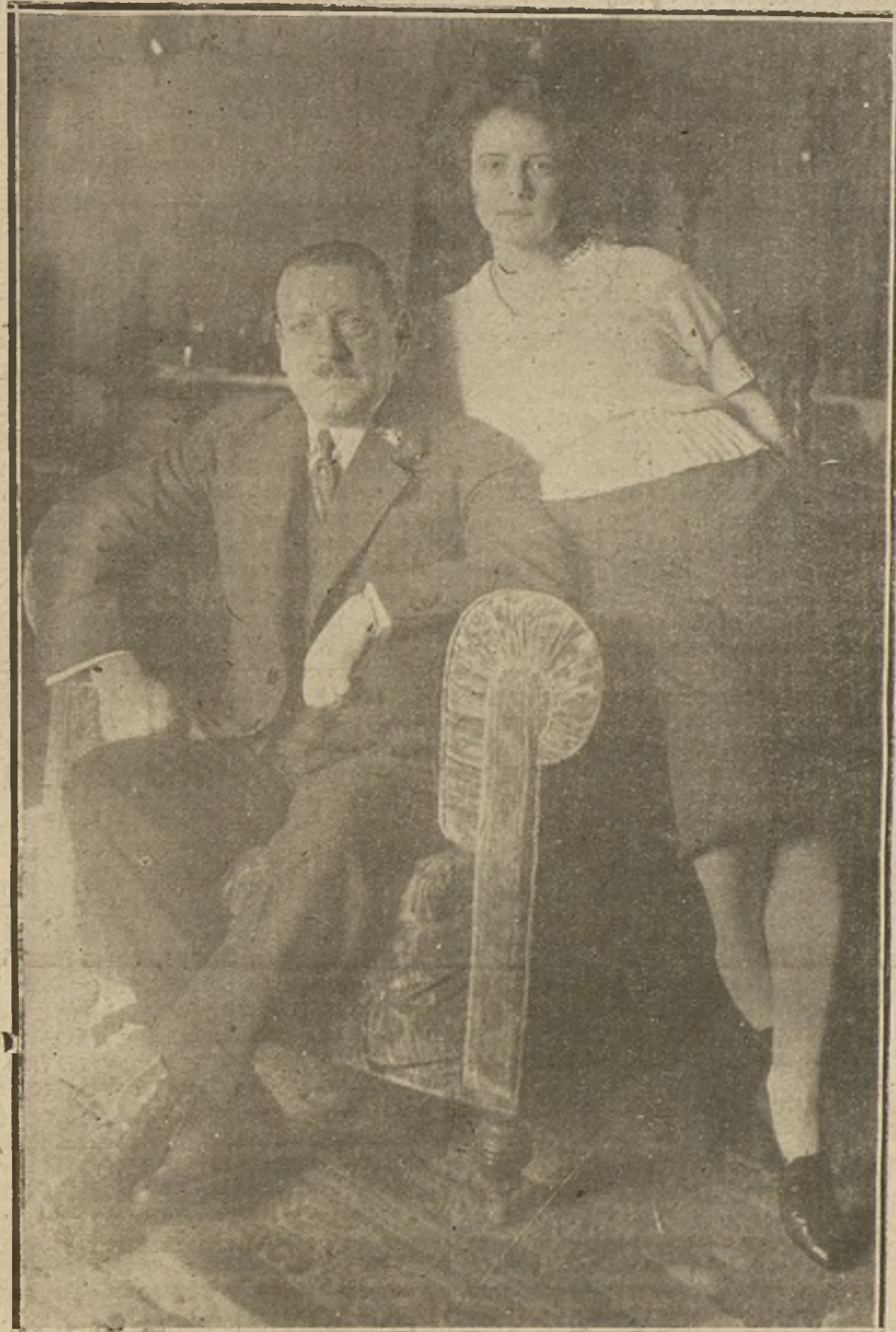
GENERAL MARTÍNEZ ANIDO, CON SU HIJA MARÍA TERESA, A LA QUE LA GUARNICIÓN DE BARCELONA HA HECHO UN ESPLENDIDO REGALO COMO HOMENAJE A SU PADRE POR EL ACIERTO CON QUE DESEMPEÑA EL CARGO DE GOBERNADOR CIVIL.

No dudamos del patriotismo con que las gentes de dinero de Cataluña habrán secundado el esfuerzo del Banco de España; pero estamos seguros de que si ese patriotismo se hubiese extremado, conteniendo, ante todo, la