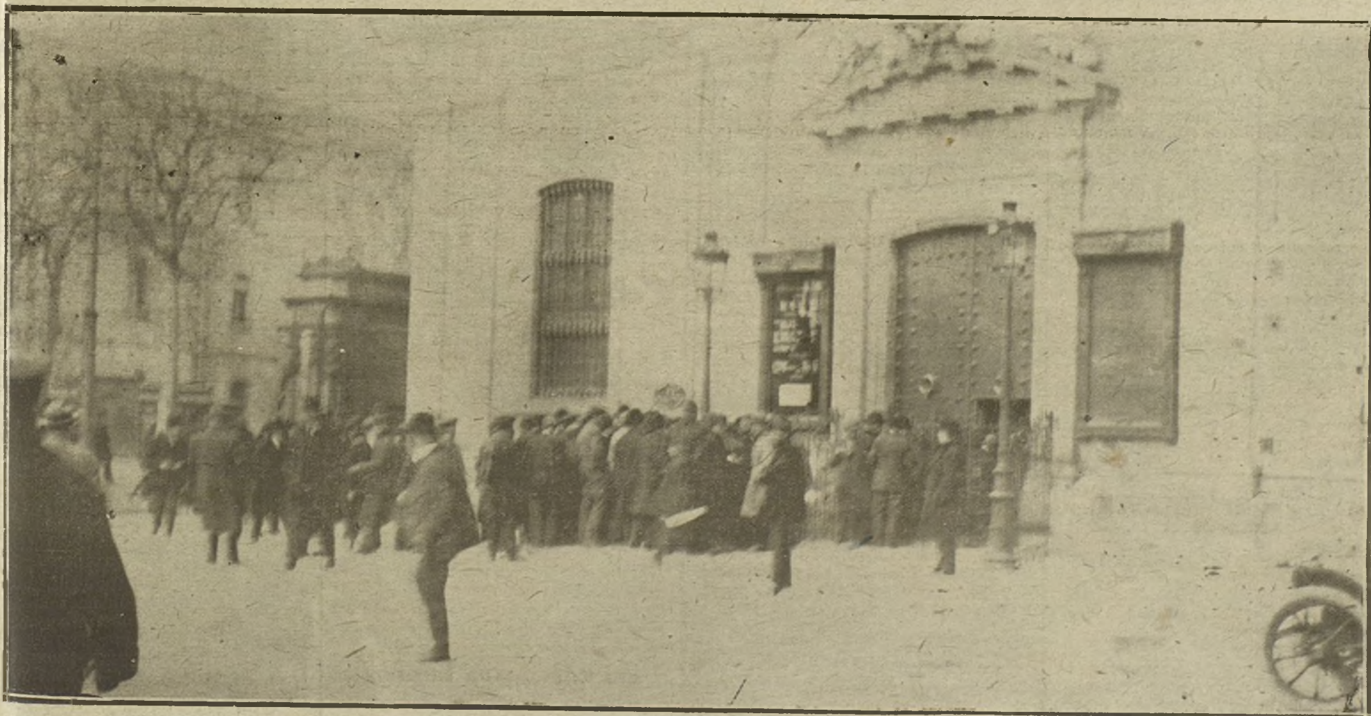
LA CRISIS FINANCIERA DE BARCELONA.—ASPECTO QUE OFRECÍAN AYER TARDE LOS ALREDEDORES DEL BANCO DE BARCELONA, AL FIJARSE EL CARTEL ANUNCIANDO LA SUSPENSIÓN DE PAGOS.

RIO DE JANEIRO. El Gobierno estudia la valorización del caucho.—A. A.