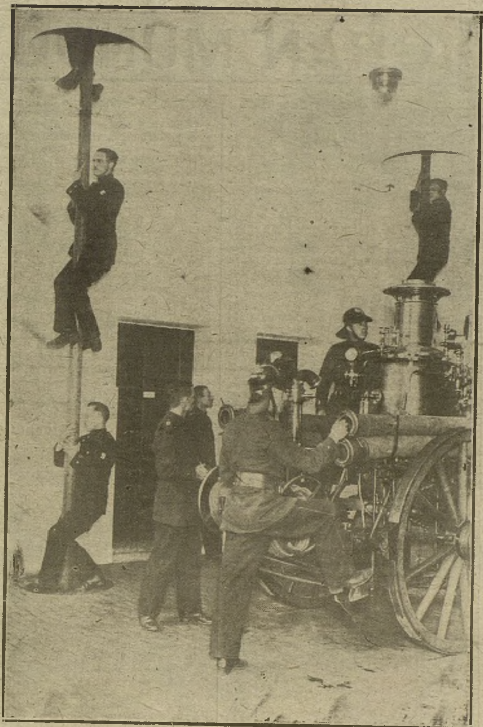
LA MODERNA INSTALACION DEL SERVICIO DE INCENDIOS EN NEUKOLIN (ALEMANIA). VISTA DEL DEPARTAMENTO DE AVISOS URGENTES, EN EL MOMENTO DE RECIBIRSE UNA ORDEN.