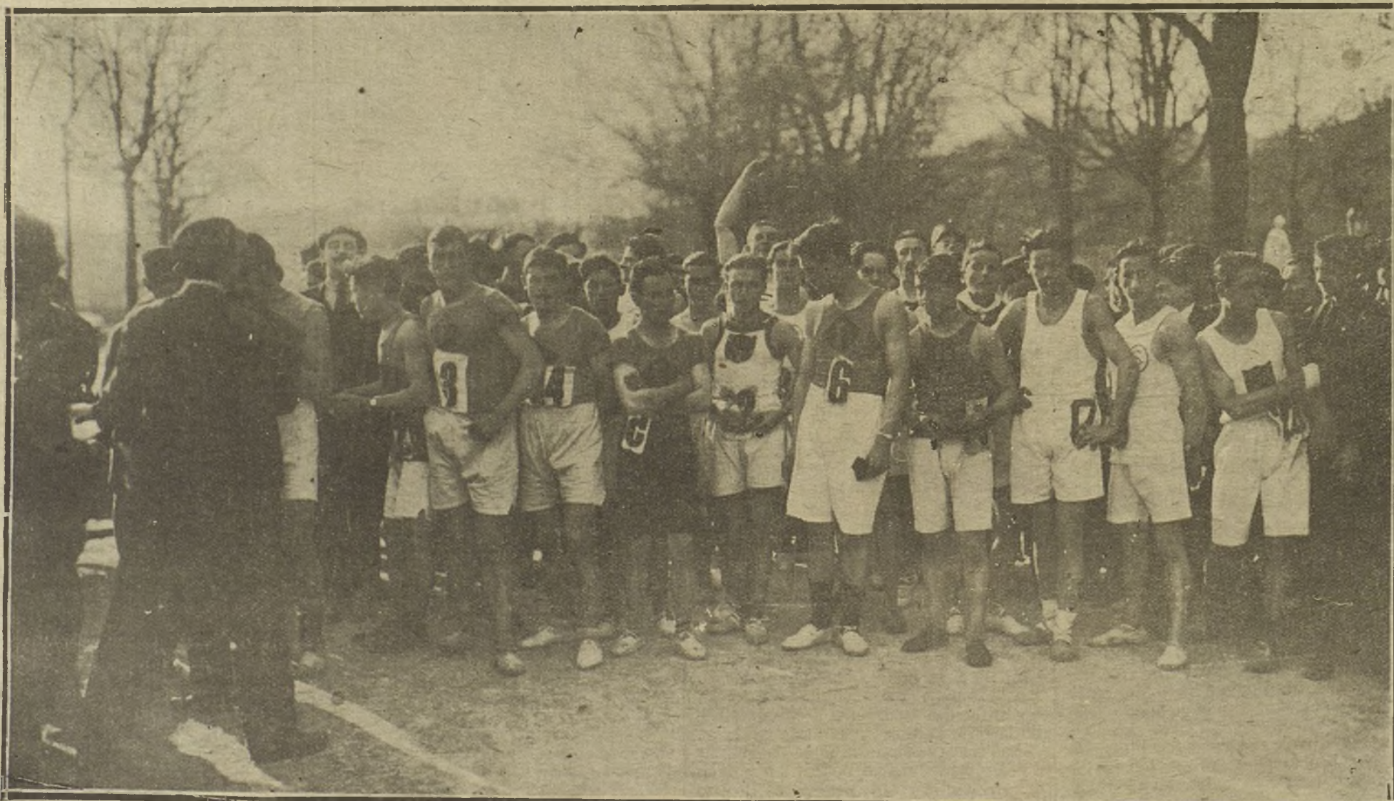
LOS DEPORTES EN SAN SEBASTIAN.—CUARTA CARRERA INTERNACIONAL ORGANIZADA POR EL CLUB DEPORTIVO «FORTUNA». GRUPO DE CORREDORES QUE TOMARON PARTE EN EL CONCURSO.

Vapor correo español «Rey Jaime I», para Palma; vapor americano «Elkino», para Nueva York; vapor danés «Tekken», para Tarragona y Valencia; vapor español «Andra Mendá», para Tarragona; pailebote español «Salvador Magron», para Ibiza; vapor noruego «Norranga», para Hamburgo.