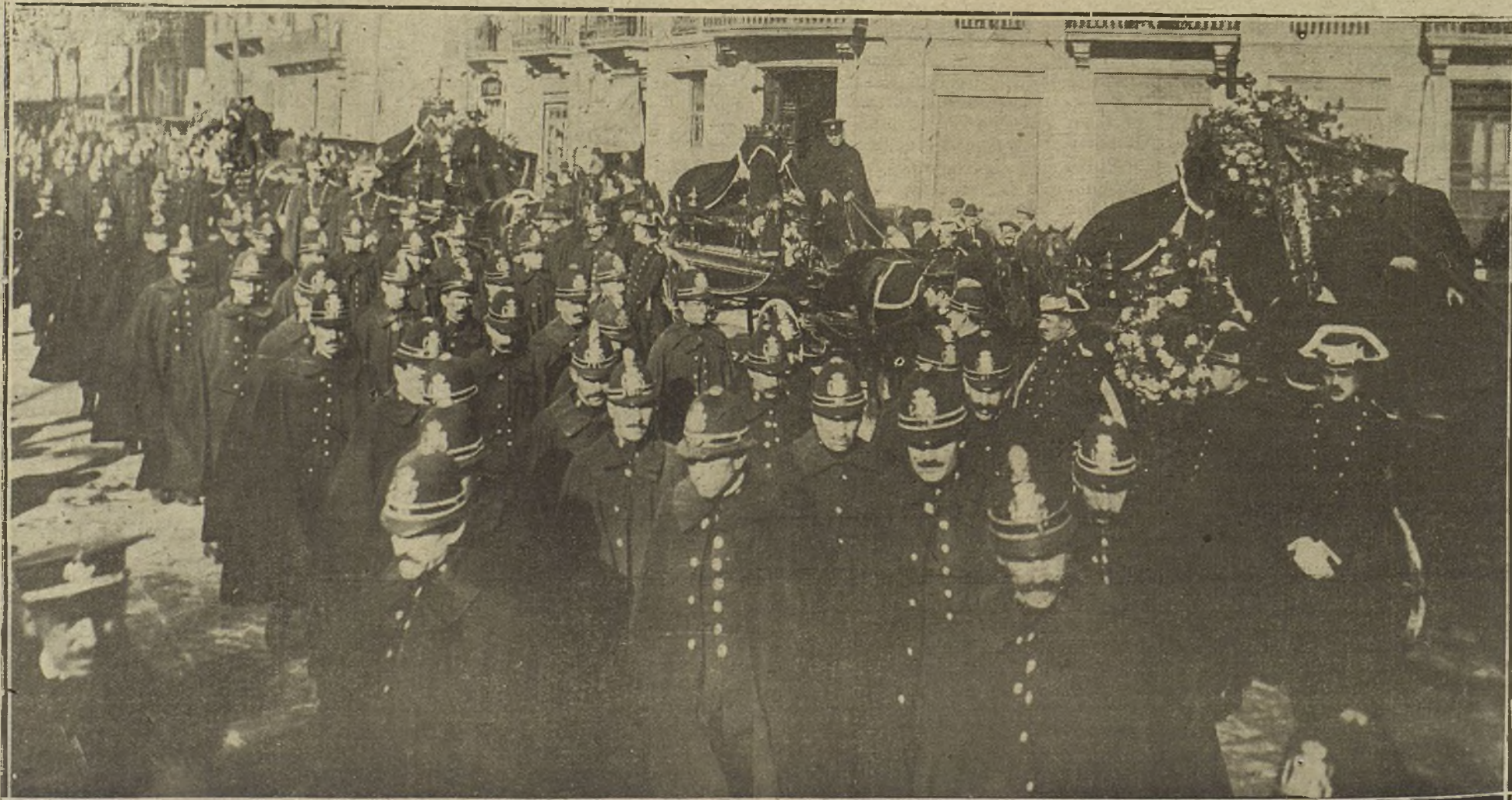
IMPONENTE MANIFESTACION DE DUELO. FERRADA CON MOTIVO DEL ENTIERRO DE LOS CUATRO GUARDIAS DE SEGURIDAD MUERTOS EN LA LUCHA SOSTENIDA DIAS PASADOS CON GENTE VULGARE EN LA BA BRIDA DE ATARAZANAS.

También aseguran que había declarado que, si Fiume llegara a rendirse contra su voluntad, a él no le quedaría más que una operanza: la de encontrar la muerte en la lucha.