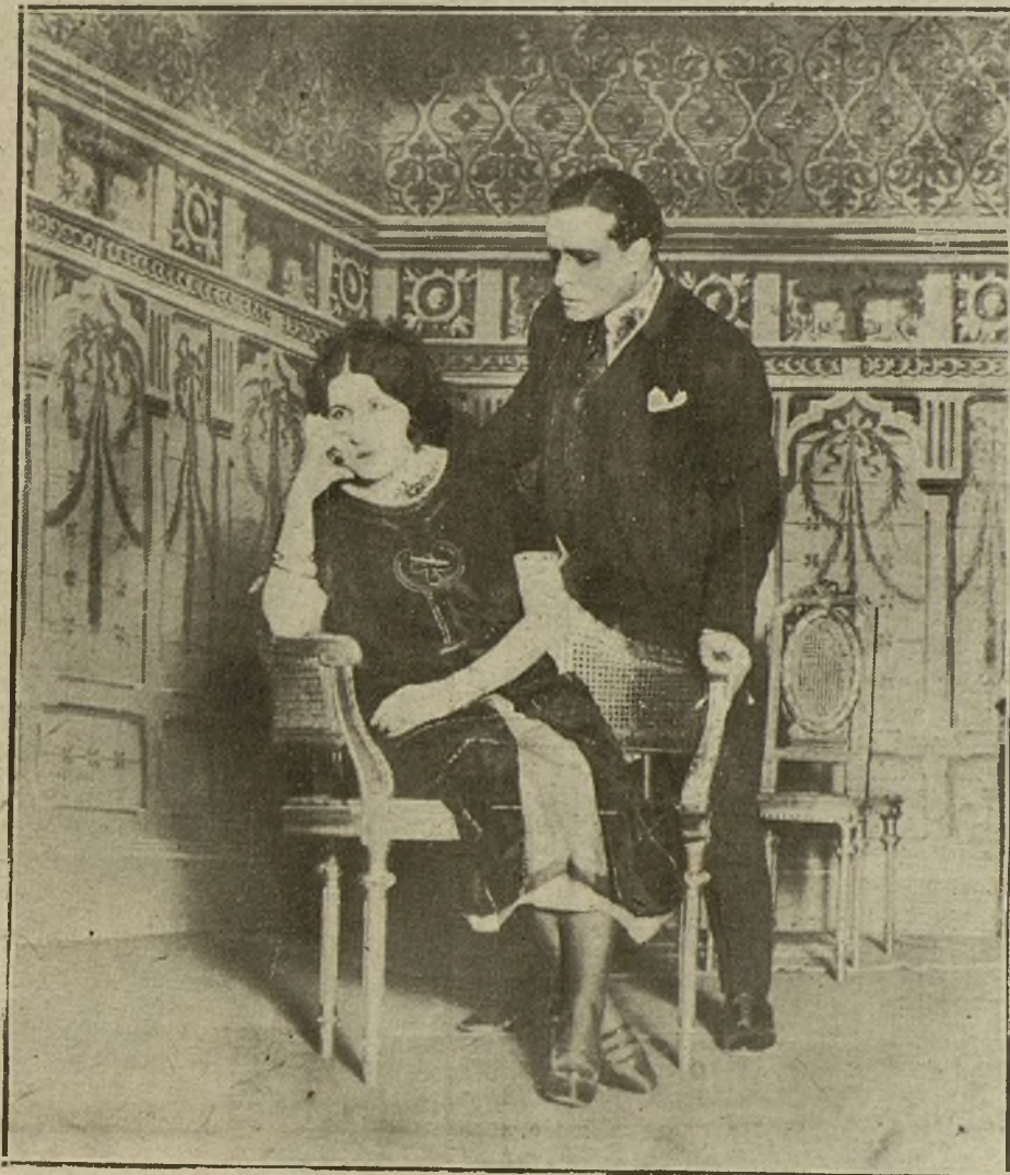
UNA ESCENA DEL DRAMA «COMO EL HUMO», QUE SE ESTRENA ESTA NOCHE EN EL TEATRO DEL CENTRO.

Las responsabilidades deberán pedirse en una Junta general, que se convo-