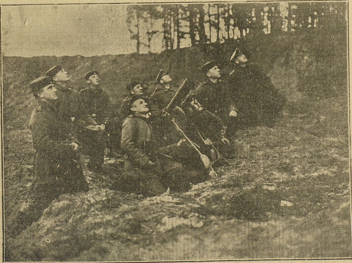
LA GUERRA EN ORIENTE.—Soldados alemanes disparando contra un aeroplano ruso.

La situación del barco es peligrosa, considerándose muy difícil el salvamento.