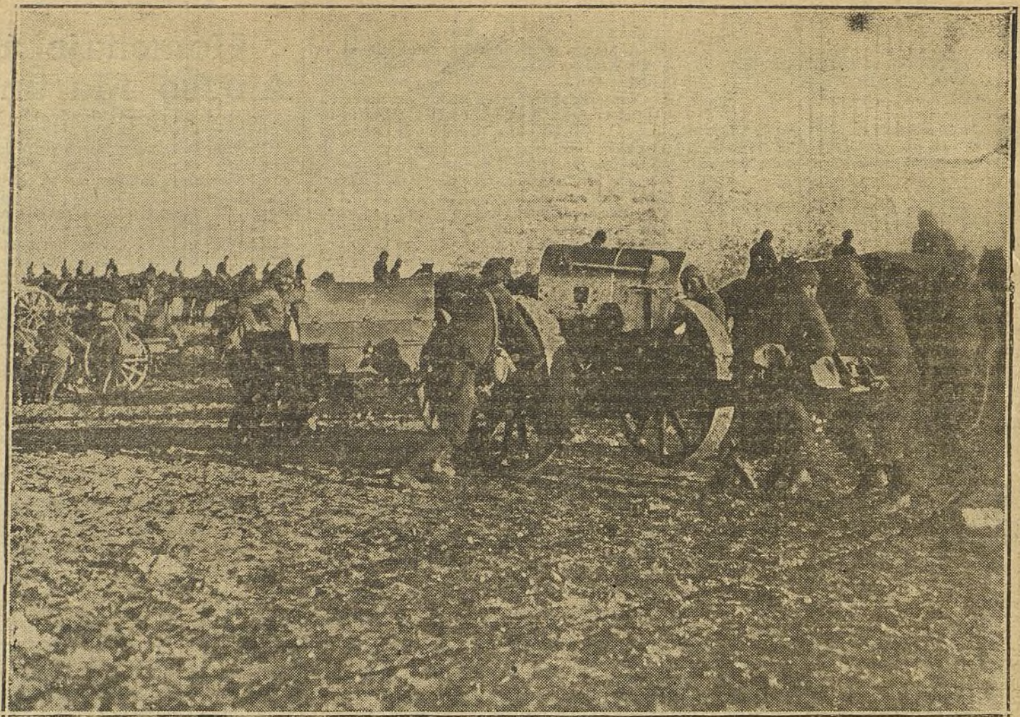
LOS TURCOS EN LA GUERRA.—Artillería turca instalando una batería en el desierto.

¿Quién sabe si en aquel atardecer sensual del año 1909 se ha iniciado la primera página de un nuevo capítulo de la historia de España!