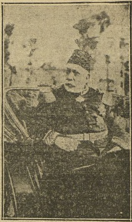
El Sultán de Turquía, cuyo estado de salud inspira serios cuidados.

Realmente son tan estupidas como incomprensibles, llegando los egoísmos y