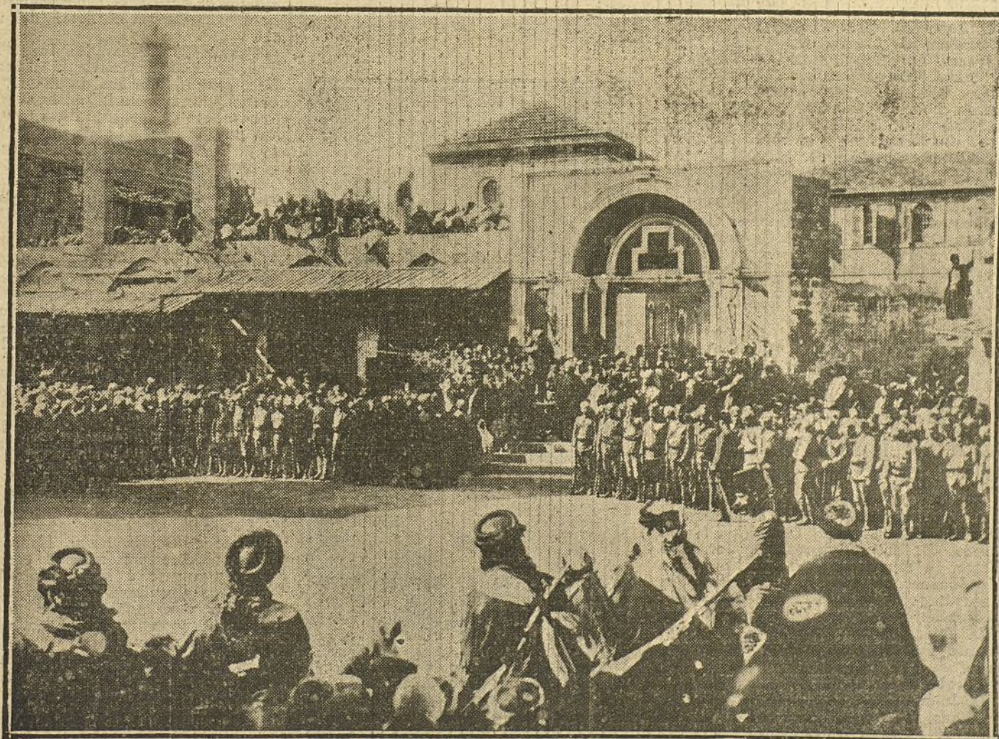
LOS TURCOS A