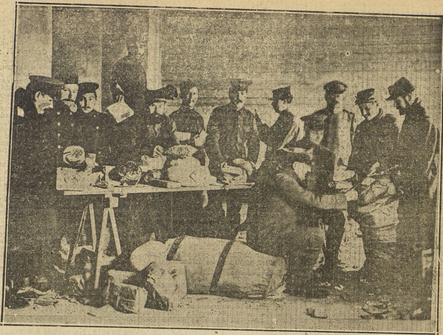
DE PRISIONEROS DE GUERRA.—Entrega de paquetes postales en el campamento de Döberit.

También se celebrará una gran corrida de novillos el día 29, lidiándose ocho reses de la ganadería de Miura por cuatro novilleros aún no designados.