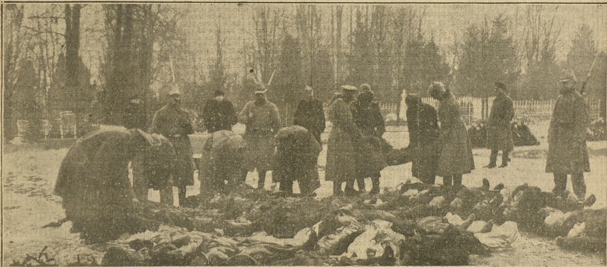
DESPUES DEL COMBATE.—Prisioneros rusos enterrando a las víctimas del sangriento combate de Memel.

EXPLOSION EN EL CAPITOLIO DE WASHINGTON.—UN AVIADOR MUERTO.—LA ACCION NAVAL DE ALEMANIA. EL ATENTADO CONTRA MORGAN.—VICTOR MANUEL EN EL CAMPO DE BATALLA.—OTRO EMPRESTITO ITALIANO.—LOS SERVIOS EN DURAZZO.—EL HOSPITAL JOFFRE.—LAS COSECHAS EN HUNGRIA.—UN TORPEDE-RO ITALIANO A PIQUE.—LO DEL «ALBATIOS».—MANIFIESTO DE LOS FRANCOFILOS ESPAÑOLES