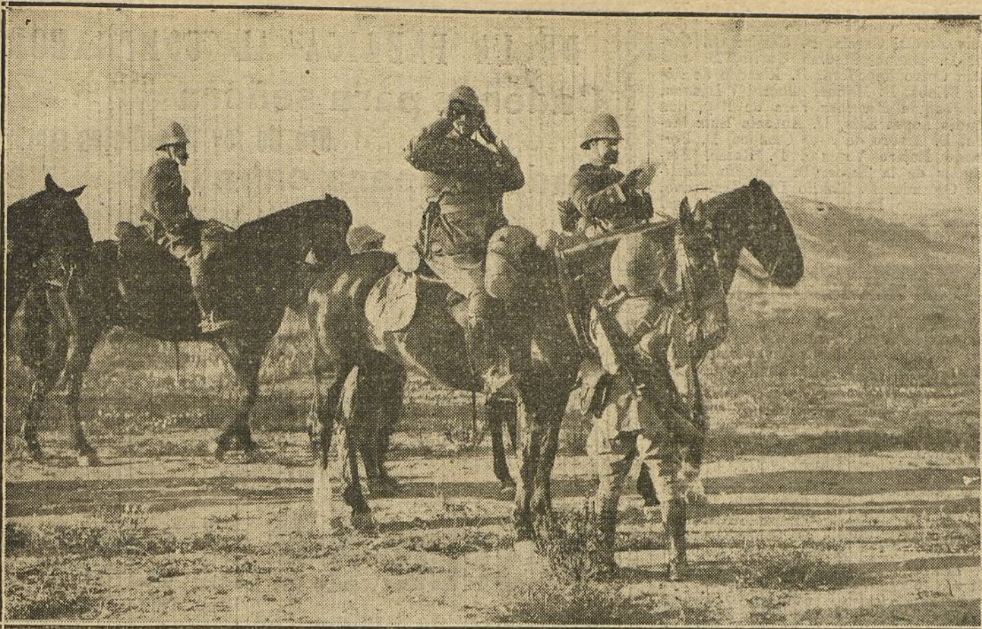
LAS ÚLTIMAS OPERACIONES EN MELILLA. —El jefe de Estado Mayor coronel Fernández Heredia, leyendo un parte arrojado por el coronel Vives desde un aeroplano, en el cual da cuenta de las posiciones que ocupa el enemigo. El general Jordana sigue con sus gemelos las evoluciones del aeroplano.