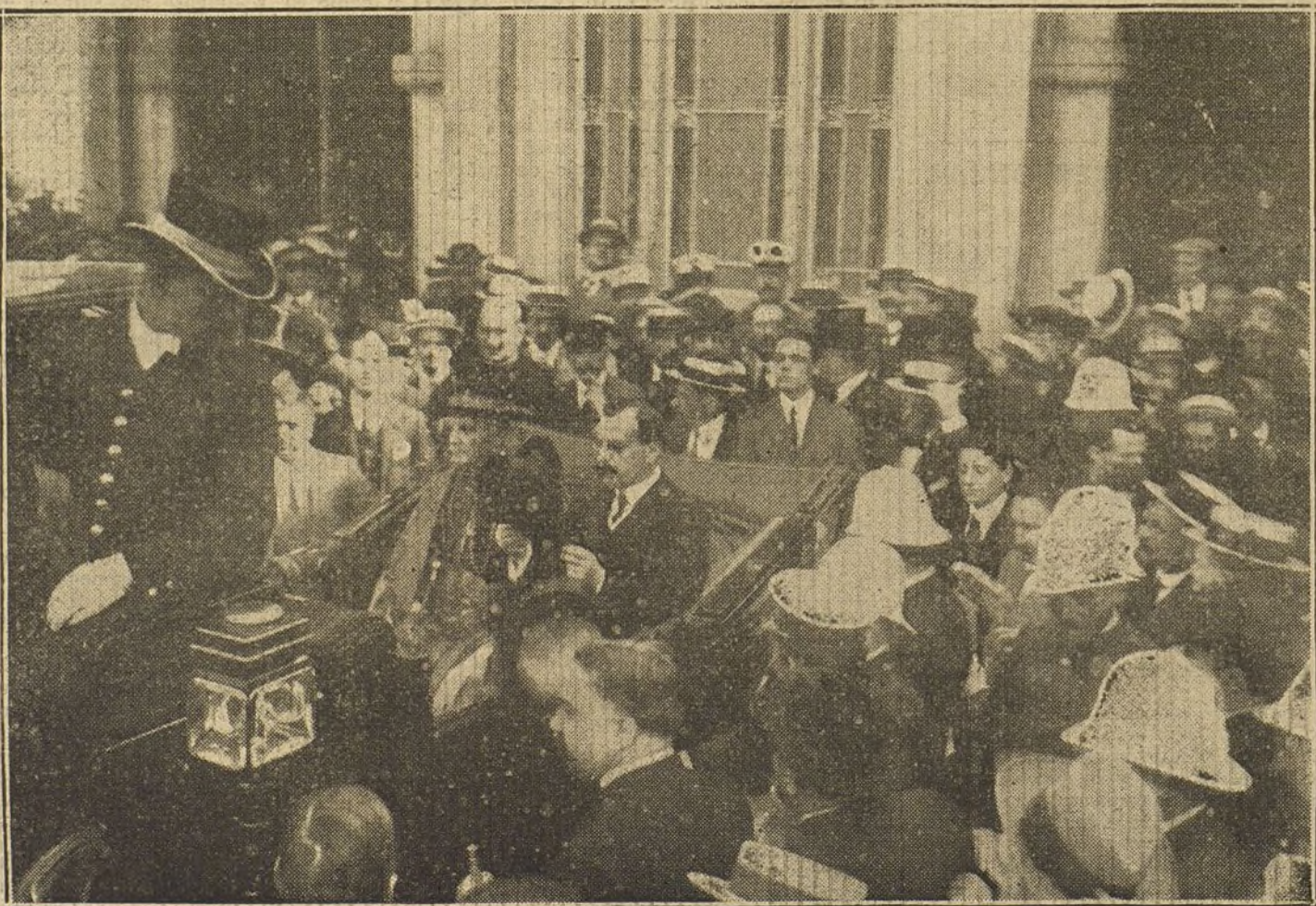
EL NUNCIO EN BARCELONA.—Llegada de monseñor Agón, a la ciudad condal.

NUMERO DEL TELEFONO DE LA REDACCION. ADMINISTRACION Y TALLERES DE «LA TRIBUNA»: 4.444