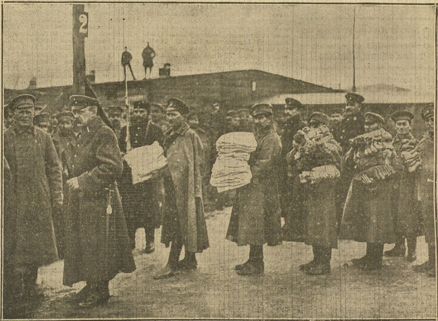
LOS PRISIONEROS DE GUERRA. —Entrega de ropa blanca á los prisioneros rusos en el campamento de Guben.