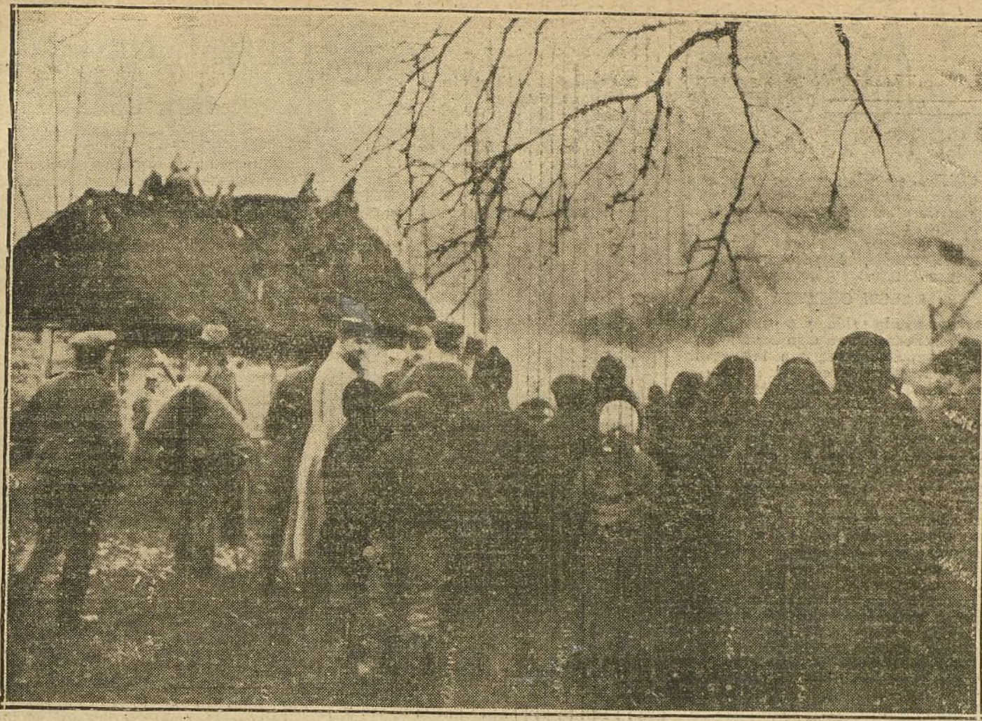
DESPUES DEL COMBATE. —Tropas alemanas ayudando a los aldeanos a localizar un incendio producido por las granadas rusas en un pueblo de la Polonia rusa.

gal Literature of Germany By Adwin M. Borchard Law Librarian.