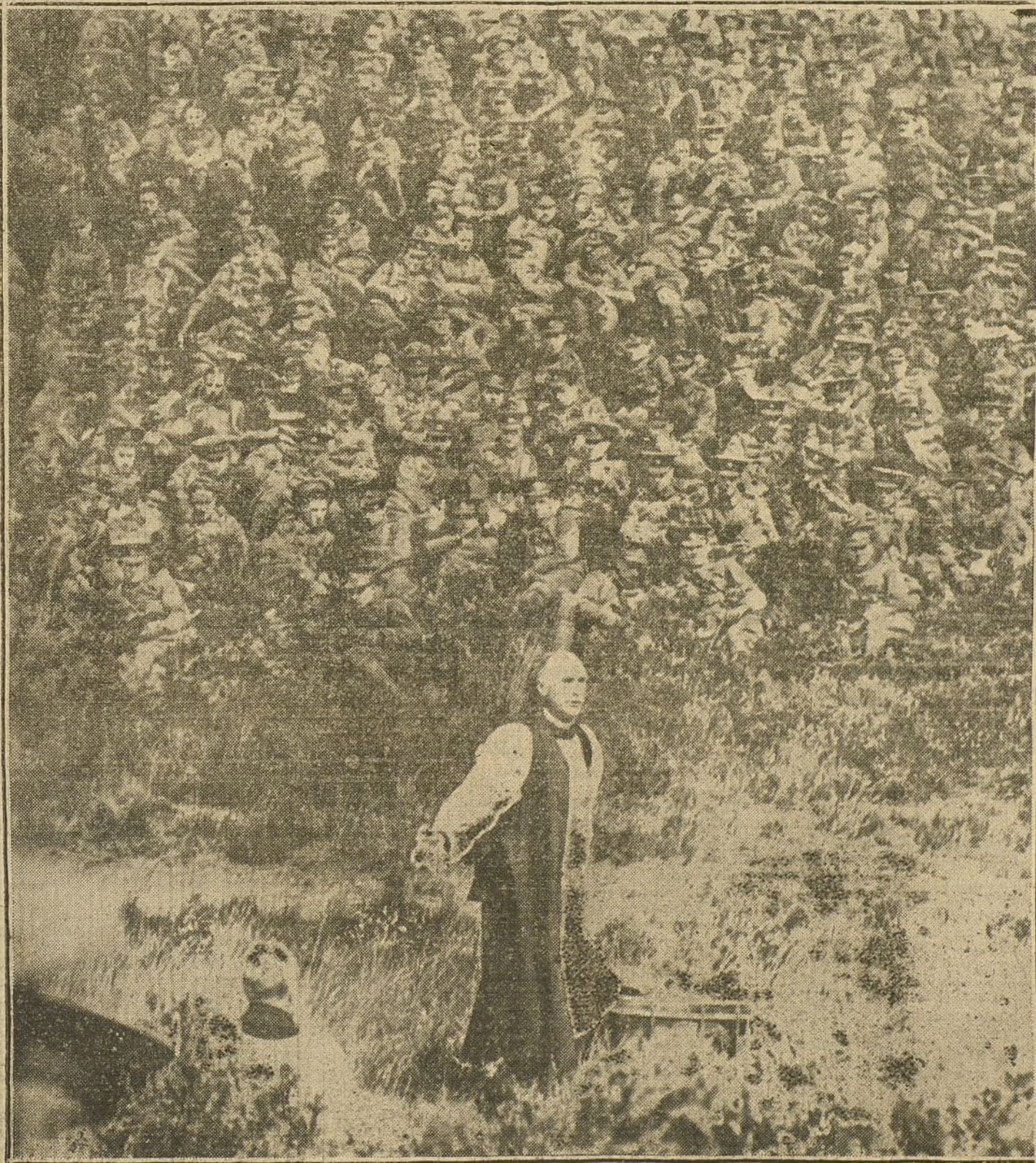
El arzobispo de Londres arrojando a las tropas británicas en uno de los campamentos próximos a la línea de fuego del teatro belga de operaciones.

«La caída de Lemberg es un suceso decisivo. El mismo Estado Mayor ruso declara que pasará algún tiempo hasta que Rusia pueda emprender una nueva ofensiva. Este entreacto, sin embargo, puede ser fatal para los ejércitos aliados. Un peligro grande está amenazando al ejército italiano. Italia ha esperado demasiado para decidirse y dejó escapar la ocasión de lograr una acción en los Dardanelos sin peligro para sus propias fronteras. A pesar de las afirmaciones de Asquith, y a pesar de un eventual apoyo de la flota italiana, parece ahora excesivamente dudoso que los aliados venzan a los turcos dentro de un tiempo limitado. Como ellos no pueden disponer de nuevas tropas para mandarlas a los estrechos, la caída de Lemberg tiene su repercusión sobre la política balcánica. Es muy poco probable que el general Cadorna pueda resistir a los ataques austro-alemanes, y es posible que Joffre se verá en la necesidad de mandar un ejército francés al Norte de Italia, en vez de recibir el mismo refuerzo italiano. Por esta razón es muy posible que la gran victoria del general Mackensen, tenga verdadera importancia en el sentido de un rápido desenlace de la guerra mundial.»