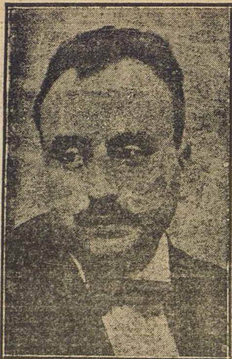
IGNACIO PINAZO, que ha obtenido segunda medalla en la Exposición de Escultura.

Ignacio Pinazo, alejado desde 1900 de las Exposiciones, vuelve completamente renovado. «El saque» (que sinceramente hemos de confesar que no es un acierto definitivo), rompe la igualdad de los desnudos de mujer y de los bustos-retratos, que tanto abundan en el Palacio de Cristal. Felicitémonos de que un escultor tan notable busque en un campo original fuentes de inspiración. El desnudo femenino es la principal y más espléndida representación plástica de la Belleza; pero no es la única, ni en proporciones exclusivistas siquiera. El plausible empeño de aislarse de la rutina, arriesgando gran parte del éxito, para modelar una figura en movimiento muy complicada de com-