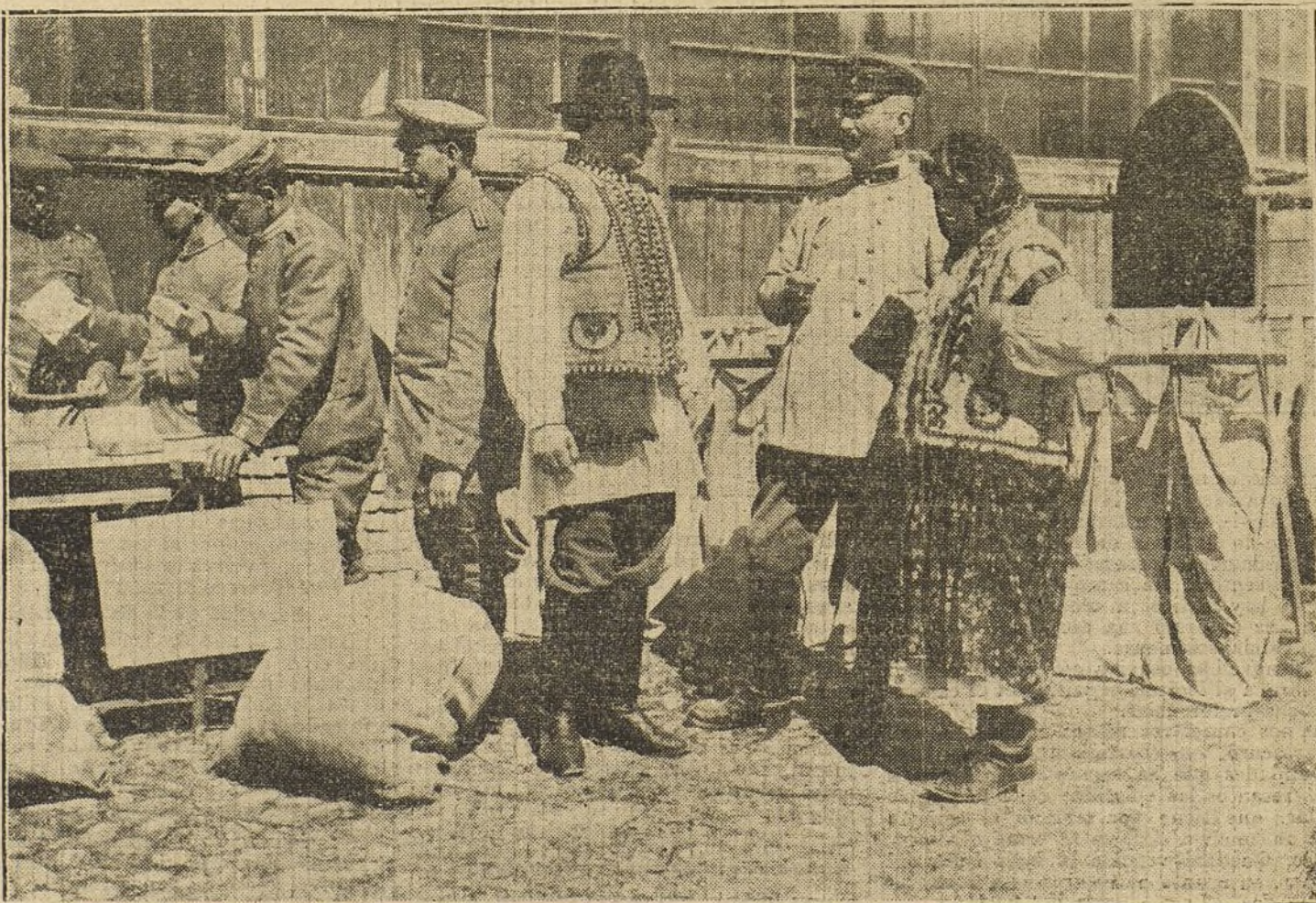
LA RECONQUISTA DE GALITZIA.—Patio de una ambulancia de Correos establecida en la región recién ocupada por los austroalemanes.

Con muy buen acuerdo, la biblioteca del Congreso de los Estados Unidos ha comenzado la labor de confeccionar unas «Guías» para el estudio del Derecho y Literatura jurídica de otros países, con objeto de dar a conocer a los juristas americanos las instituciones jurídicas extranjeras, estudio importante de Derecho comparado, muy solicitado en aquellas tierras. Y es interesante observar que la primera de esas «Guías» no se dedica a Inglaterra, país unido por tantos lazos y del mismo idioma; la primera obra de esta clase se dedica a reseñar la Legislación y Literatura jurídica alemana. Las causas de esta elección las explica su autor en el prólogo de la obra, y son, a saber: «La importancia comercial de Alemania, sus esfuerzos para resolver los problemas económicos y sociales del tiempo presente, esfuerzos que han atraído una bien ganada admiración, y porque en ciencia jurídica, la investigación alemana durante la última generación ha intensificado la verdad de la afirmación de Sheldon Amos, hecha hace cuarenta años, que los resultados en la ciencia de la jurisprudencia dependerán principalmente de una mayor familiaridad de lo existente hasta hoy, en la educación jurídica, con la «inmensa» é «invaluable» literatura jurídica de Alemania. «La jurisprudencia moderna es esencialmente una creación alemana.» («Science of jurisprudence», página 505.) Guide to the Law And Le-