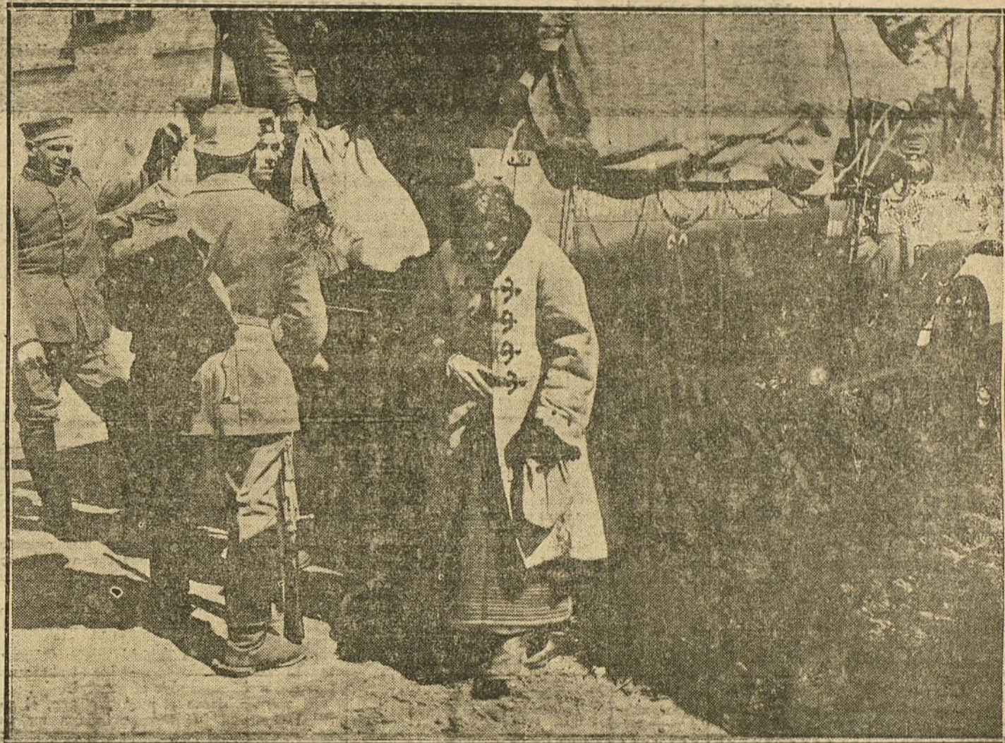
LA RECONQUISTA DE CALITZIA. Llegada del correo a una localidad de la Calitzia oriental, recientemente reconquistada por los austroalemanes.

MINISTROS INGLESES EN LAS TRINCHERAS. — EL GENERAL COURAND EN FRANCIA. — EN LOS PAISES BALKANICOS. — LA ACCION NAVAL DE ALEMANIA. — EL PAPA Y LA GUERRA. — AVIADOR APOCRIFO. — ITALIA Y TURQUIA. — SERBIOS Y AUSTRIACOS. — EL CASO DEL «ARMENIAN». — LA FABRICACION DE MUNICIONES EN RUSIA. — EL EMPRESTITO INGLESES. — EL VATICANO Y LOS PRISIONEROS DE GUERRA