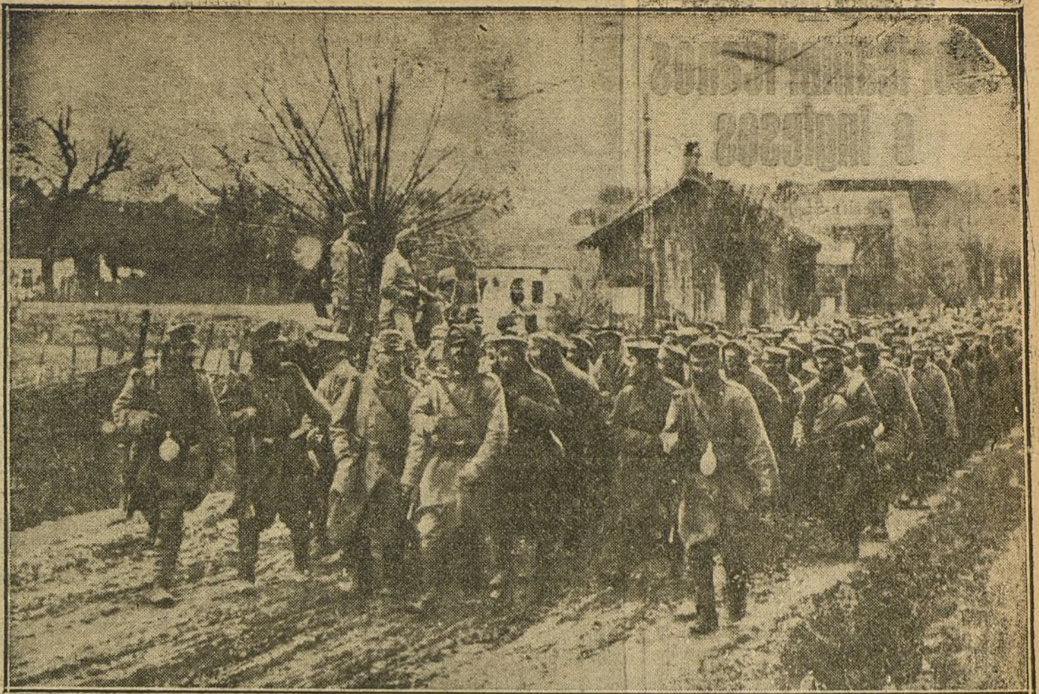
LA GUERRA EN ORIENTE.—Soldados austriacos conduciendo prisioneros rusos después de una acción en las montañas.

A despedir al jefe de los liberales acudieron a la estación numerosos amigos políticos y particulares.