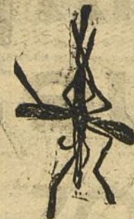
ESANOFEELE Mosquito que propaga la malaria.

Dosis curativa: Seis píldoras diarias, por quince días. Dosis preventiva y reconstituyente: Dos píldoras diarias.