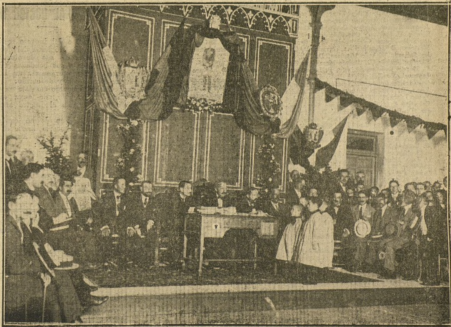
EN EL ASILO DE LA PALOMA.—Reparto de premios de fin de curso, presidido por el alcalde de Madrid.

LA TAREA DE DEVOLVER TODOS LOS TRABAJOS QUE NO PUBLICAMOS SERIA ABUMADORA, Y PARA EVITARLA, COMO PARA PREVENIR RECLAMACIONES, QUE RESULTARIA IMPOSIBLE ATENDER, RECORDAMOS QUE NO SE DEVUELVEN LOS ORIGINALES.