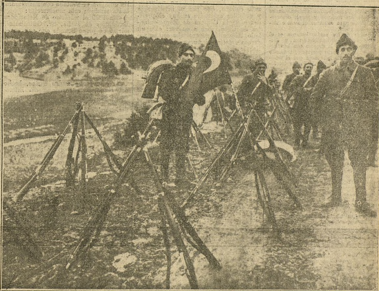
LA RECONQUISTA DE CALITZIA. —Campamento de Húsares del Ejército austro-húngaro en las cercanías de Lemberg.

«La escasez de carbón presenta una grave dificultad para los ferrocarriles italianos, que tendrán que suprimir muy pronto gran