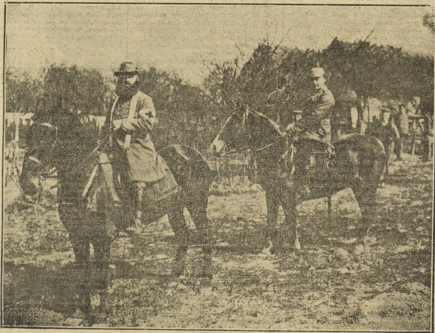
EL EJERCITO ALEMAN. —Un predicador militar alemán en la línea de combate.

A la Asociación de los Exploradores se le han imputado muchos defectos. Los ultramontanos la han tildado de atea porque a los muchachos no se les sometía constantemente a prácticas de devoción. Los radicales la han considerado como una colectividad atada de misticismoñoño. Los antimilitaristas se han permitido juzgarla como un organismo automático.