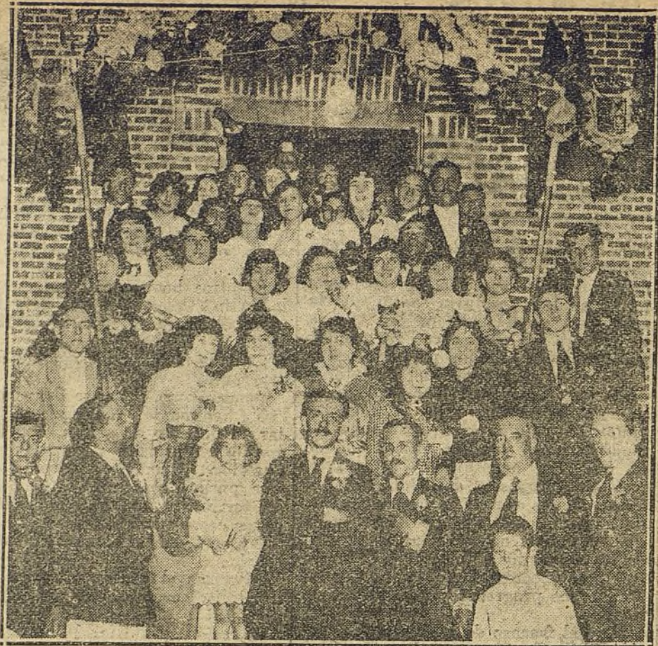
FESTEJOS EN LA PROSPERIDAD. —Grupo de señoritas y Junta directiva de la Institución de Amigos de la Enseñanza que postularon ayer en aquella popular barriada para el sostenimiento de dicho Centro.

Que Inglaterra y Francia han de intentar nuevamente un ataque a los Dardanelos con el fin de ver si pueden forzar el Estrecho y apoderarse de Constantinopla, es de todo punto indudable. Quizás dentro de unas cuantas semanas ya tengamos noticias de que las escuadras inglesa y francesa hayan comenzado las operaciones en gran escala en dicho lugar, y... también de que éstas se han visto obligadas a volver riendas