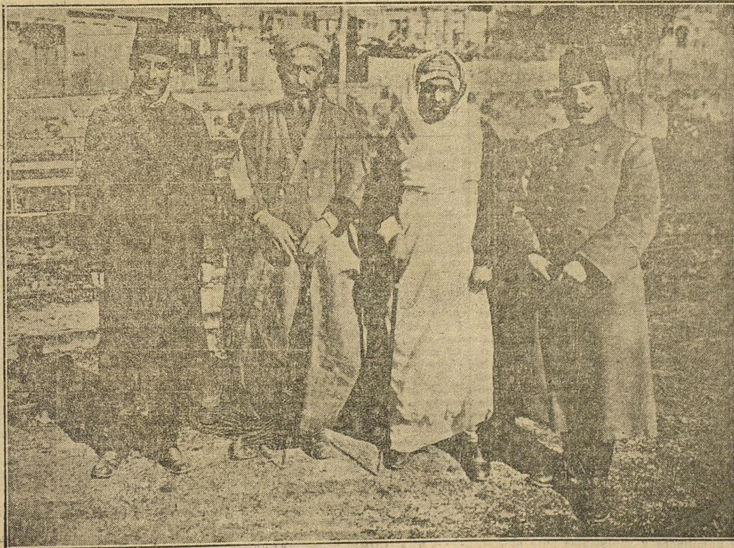
LA GUERRA EUROPEA.—El caid de los Semsis, uno de los hombres más influyentes en las tribus árabes del Asia Menor, que ha predicado la guerra santa en favor de Turquía.

El pueblo de Moraleja está consternadísimo y pide indignada y enérgicamente el castigo de los culpables.