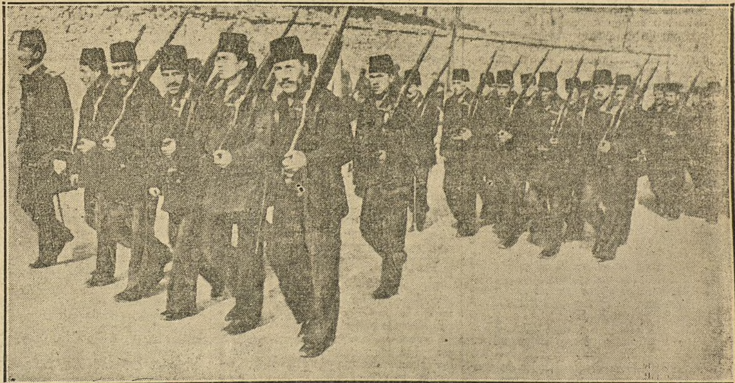
LA GUERRA EUROPEA.—Soldados turcos de Infantería de Marina, dirigiéndose a la línea de trincheras de Gallipoli.

El Ministerio ha dado orden para que se venda el casco de la «Numancia». La venta producirá una cantidad insignificante.