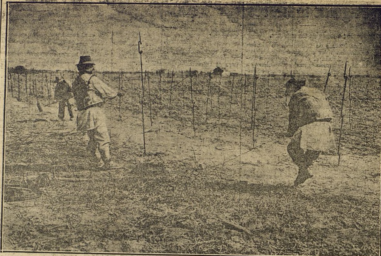
LA GUERRA EUROPEA.— Campesinos rutenos de la Bukovina ocupados en la instalación de alambradas, para proteger las posiciones austrohúngaras.

Los éxitos de Melilla y Larache no deben sumarse a la obra del protectorado porque indican acciones separadas por completo de la política de la Alta Comisaría. Pero también añadiremos, como leve disculpa, que el fracaso de Tetuán sería injusto achacarlo a una sola responsabilidad, sino que es consecuencia inevitable de esa equivocada política, es como un resumen doloroso de toda la obra del protectorado. En Tetuán, lo repetimos, no fracasó un residente, fracasó todo un sistema colonial.