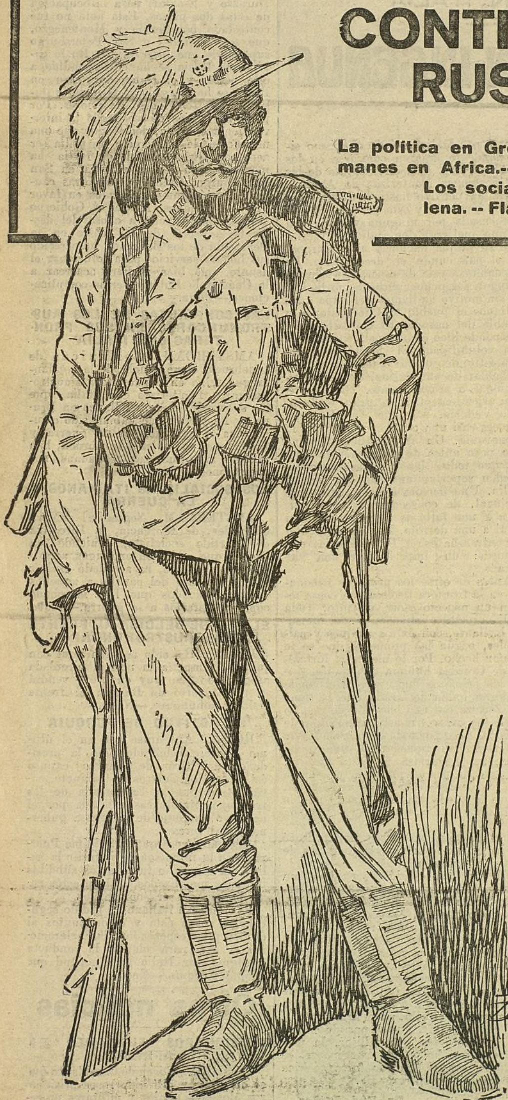
EL EJERCITO ITALIANO.—Tipo de «bersaglieri». (Dibujo de Agustín).

La política en Grecia.--Consejo de guerra en París.--Prisioneros alemanes en Africa.--Italia y Turquía.--El Rey Alberto al frente italiano. Los socialistas.--La Cuádruple Entente.--La neutralidad chilena.--Flandes, autónoma.--Alemania y los Estados Unidos.