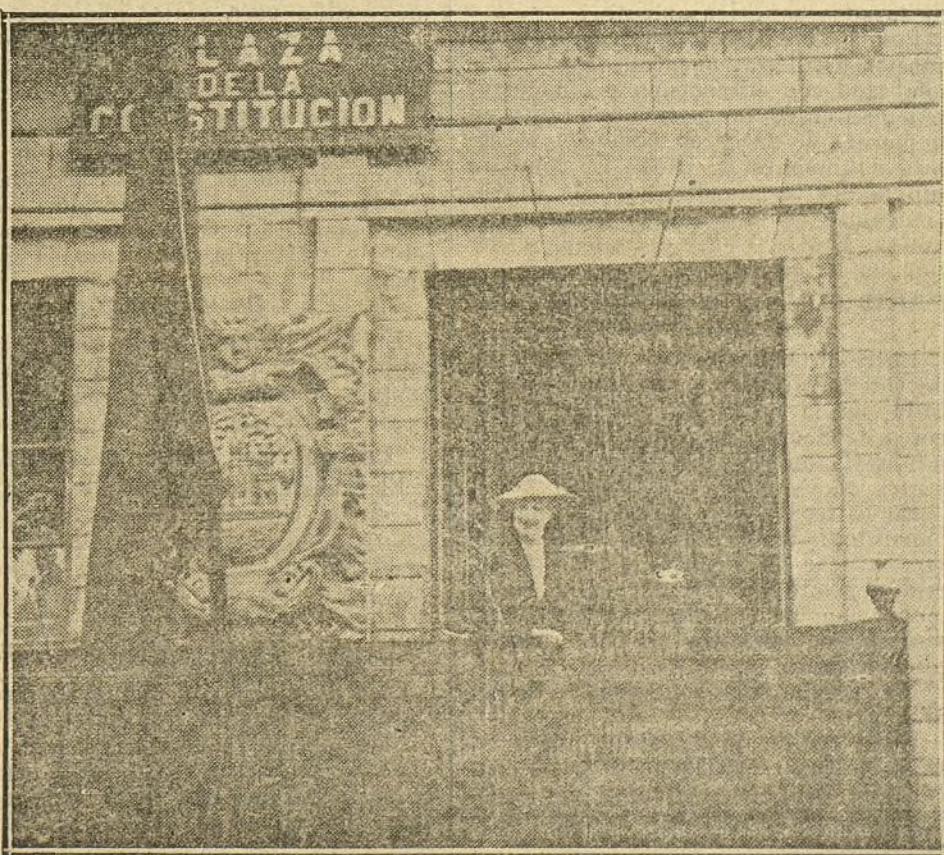
EL VERANEO REGIO.—Las Reinas doña Victoria y doña María Cristina asomadas al balcón del Ayuntamiento de Rentería.

LONDRES. En la catedral de Westminster se ha celebrado una solemne función religiosa para impetrar la independencia nacional de Bélgica. Ha asistido al acto una numerosa concurrencia, y entre ella una delegación belga, que ha expresado la gratitud de