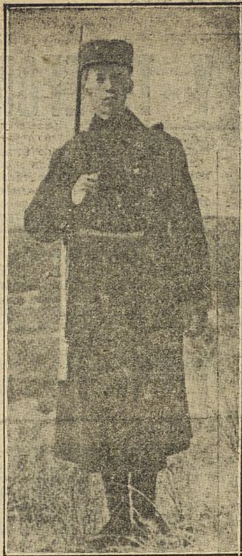
LA GUERRA EUROPEA.—El Príncipe Leopoldo de Bélgica, soldado de uno de los regimientos de línea que defienden la independencia de su país.

«pero no puedo, y me conformo con no besarlas, como hacen otros.