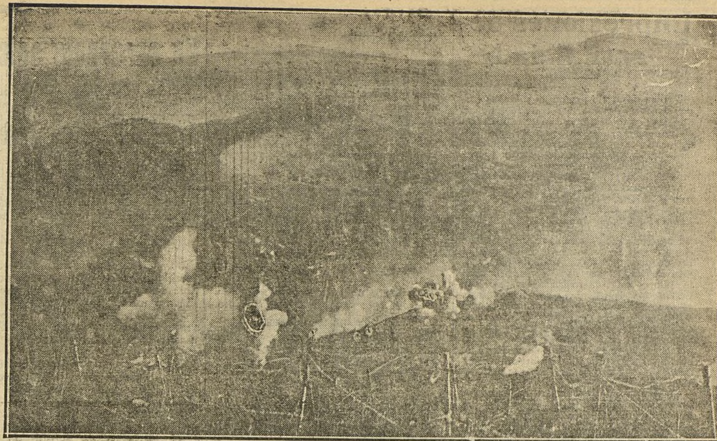
LA GUERRA EUROPEA.—Bombardeo de las líneas francesas, en la Alta Alsacia, por la artillería alemana.