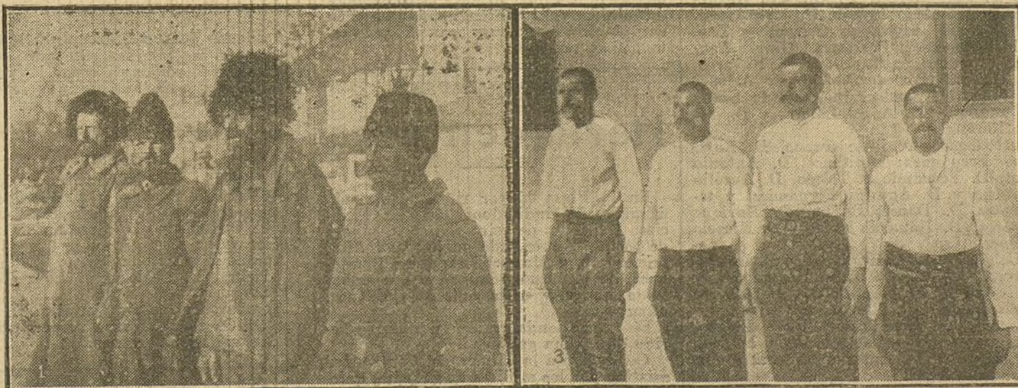
RUSOS Y AUSTROALEMANES. —Prisioneros rusos antes y después de ingresar en el campamento alemán, donde les bañan, les cortan el pelo y les dan ropa limpia.

En la misma sesión el Ayuntamiento ha acordado destinar diez mil pesetas para que los tenientes de alcalde las inviertan en organizar festejos en sus respectivos distritos.