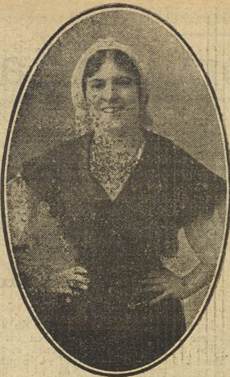
EMILIA BENITO, notable cancionista española, que está obteniendo un inmenso éxito en el teatro del Buen Retiro.

Polonia, especialmente, odia á Rusia; su fusión es imposible; mares de