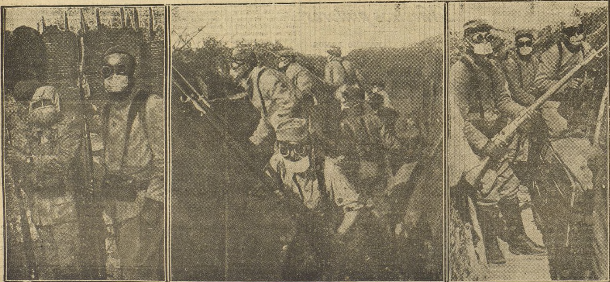
LA GUERRA EUROPEA.—Curioso aspecto de los guerreros modernos. Soldados franceses con caretas protectoras contra los gases asfixiantes.

NUMERO DEL TELEFONO DE LA ADMINISTRACION DE «LA TRIBUNA» (PLAZA DE CANALEJAS, 6): 5.55