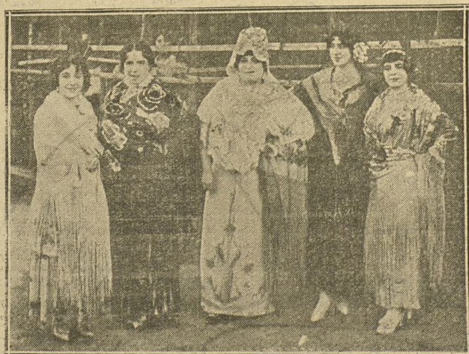
LAS MADRILEÑAS. —Artistas que tomaron parte en las fiestas organizadas anoche en la Fuente de la Victoria.

que el número de la mejor camisería, EL BUEN GUSTO, es el 24 duplicado. Especialidad en blusas para señora, desde 3 pesetas. Elegancia y economía. EL BUEN GUSTO.