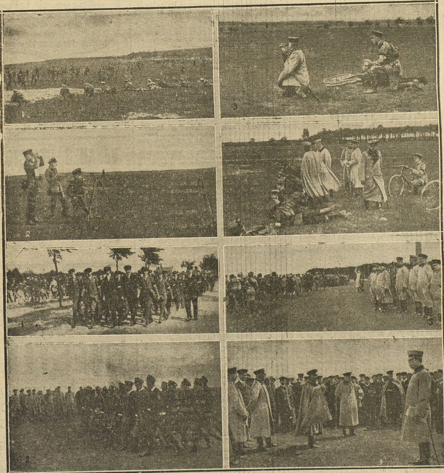
COMO SE PREPARA ALEMANIA.—Ejercicios militares de los muchachos a quienes corresponderá ingresar en filas dentro de uno ó más años. Todos los jóvenes alemanes se preparan prácticamente para la guerra y están dedicados a la instrucción bélica y a las maniobras. Cuando entran en el Ejército son excelentes soldados y poseen extensos conocimientos, que los dan una gran superioridad sobre el enemigo.

—Sí, señor; tiene usted razón. Pues no es nada lo del ojo!