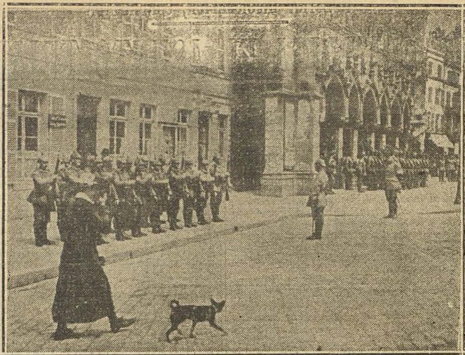
ALEMANIA EN BELGICA.—Relevo de la guardia en la plaza del Ayuntamiento, en San Quintín.

Mientras tan trascendentalísima innovación se aprueba ó no, lord Kitchener pronuncia un nuevo discurso para enaltecer el patriotismo de los vasallos del Rey Jorge, y un grupo de